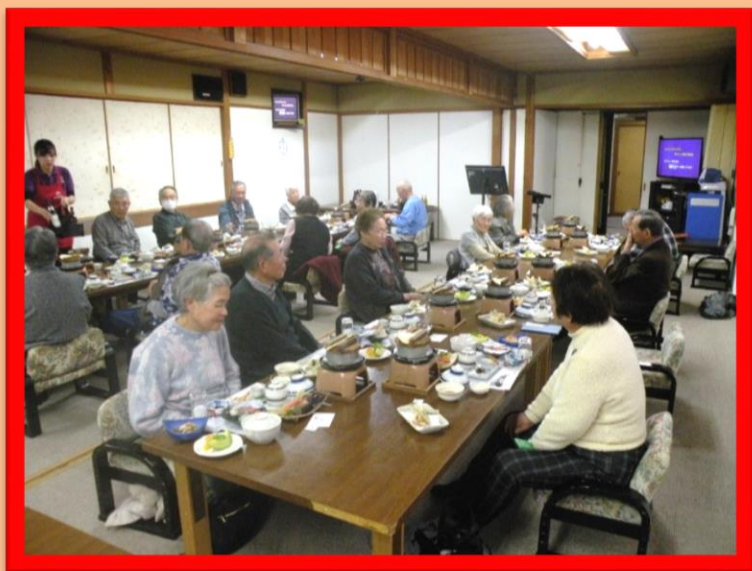
話に花が咲きあつという間に時間がたちます。