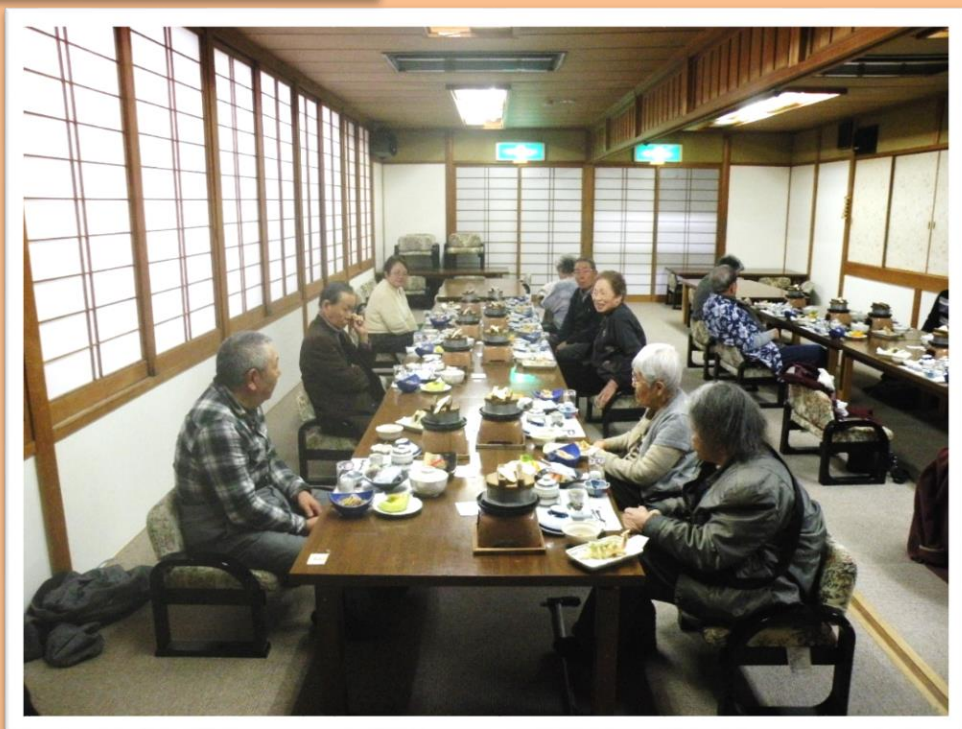
食事は刺身、てんぷら、釜めしと 盛り沢山あり食べきれるかな・・・！！