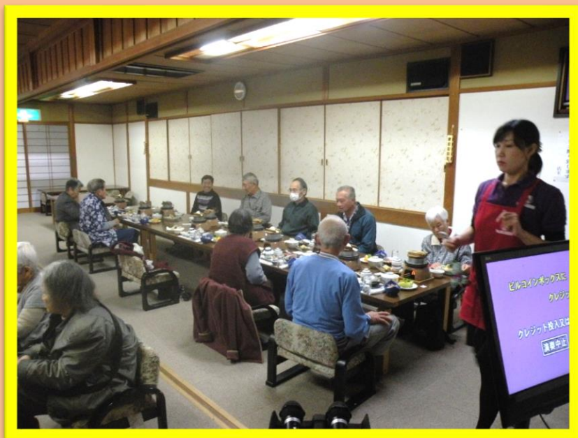
風呂から上がり、食事をしながら楽しく語らい。