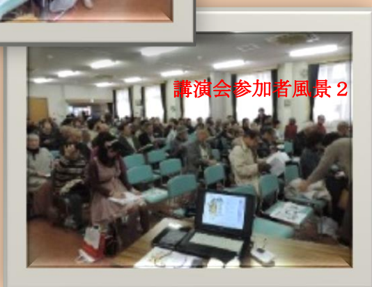
講演会参加者風景2