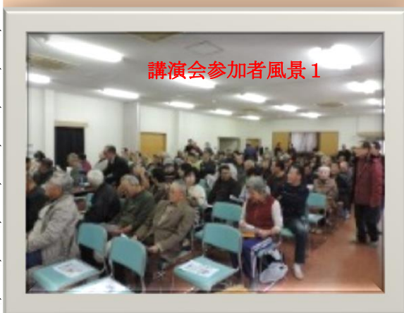
講演会参加者風景1