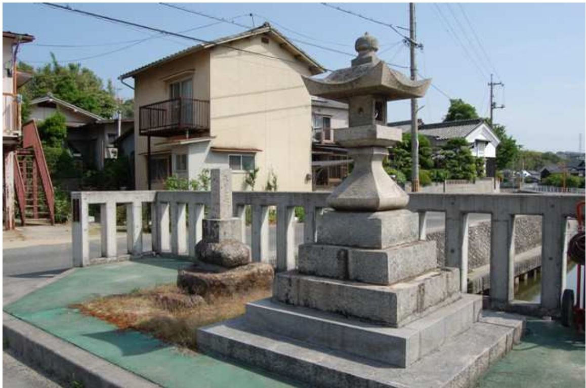
中村橋に鎮座する常夜燈と地神様