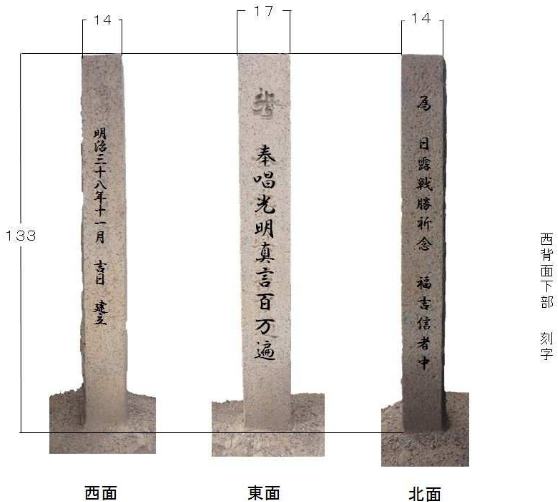
祈念碑（日露戦勝）寸法図（単位：cm）