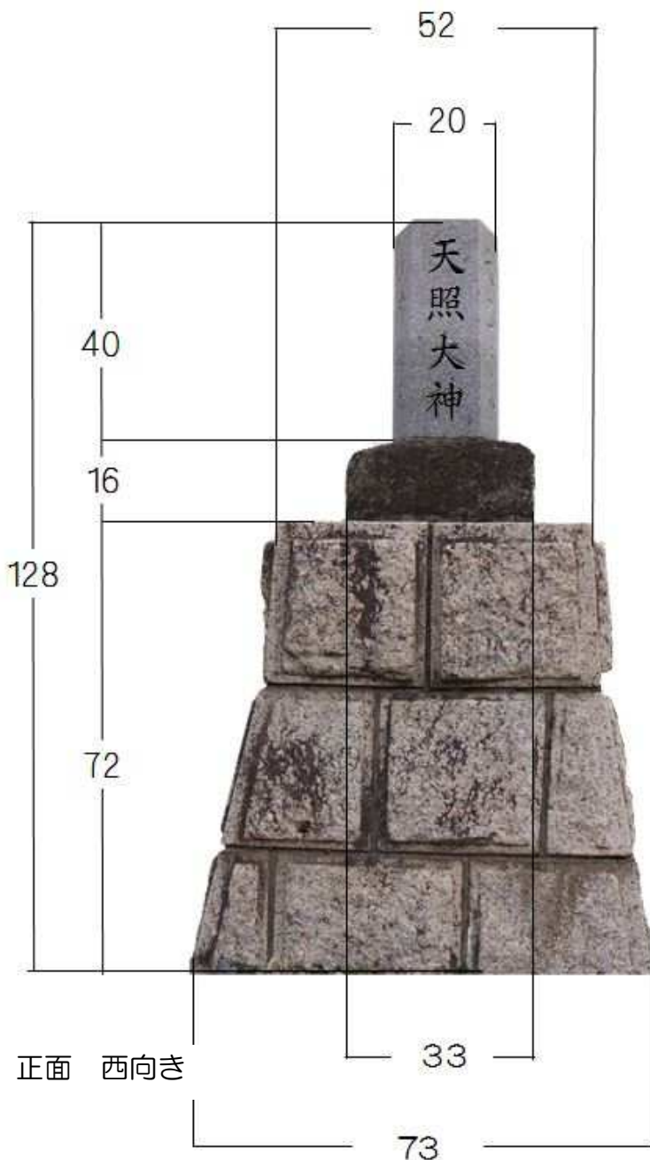
湊地神様寸法図（単位：cm）