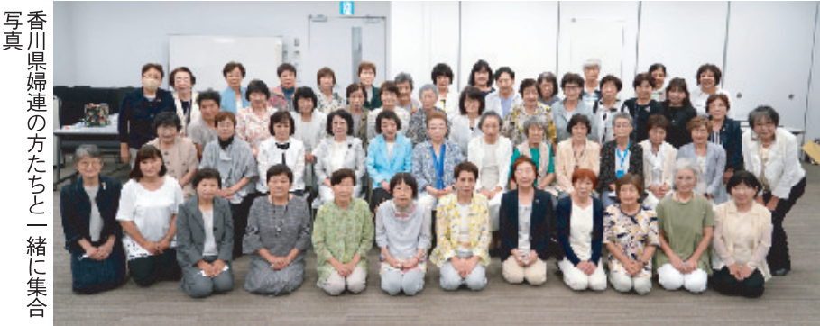
香川県婦連の方たちと一緒に集合写真

集合写真を撮って解散いたしました。その後、炎天下の栗林公園の中をしばらく歩いて、お食事所「吹上亭」で美味しいおうどんをいただきました。その日の宿泊先は小高い丘に立つ「花樹海」。例年行っていた出しものや、ビンゴゲームもなく、落ち着いてお料理を楽しむことができました。次の日には徳島県立阿波十郎兵衛屋敷で浄瑠璃の名場面を見学しました。参加者は二十四名と少し寂しかったですが、泊つきの研修でしたので、宿泊先やバスの中で充分交流ができました。