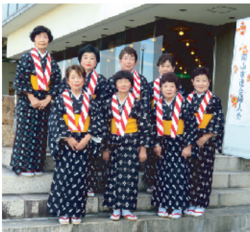
平福学区 (秋田おぼこ甚句、安里屋ユンタ)