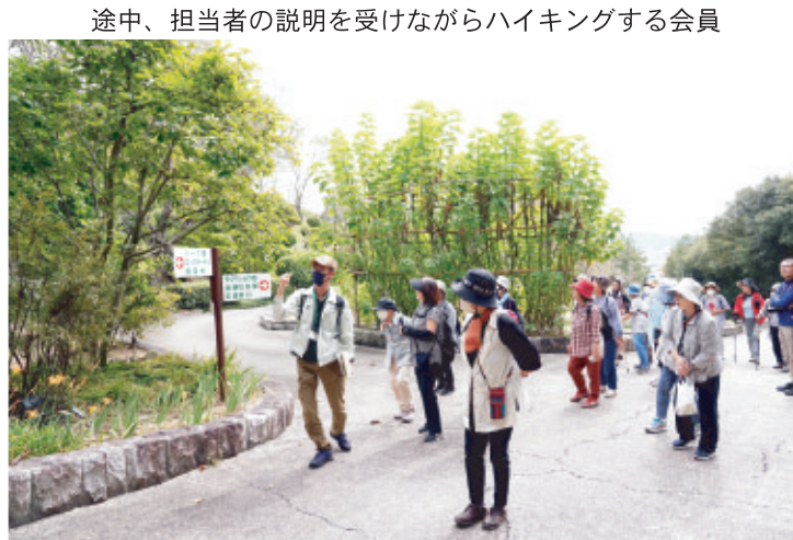
途中、担当者の説明を受けながらハイキングする会員