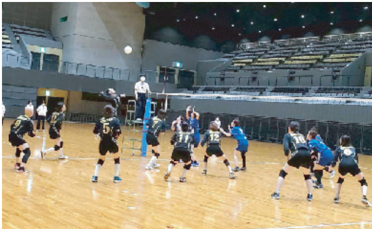
熱戦を展開する妹尾チーム(手前)と大元チームの決勝戦

コート内では、選手同士の声かけやハイタッチが多々見られました。練習を通しての「絆」を強く感じました。