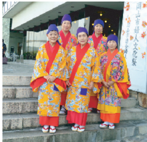
岡南学区 (安里屋ユンタ)