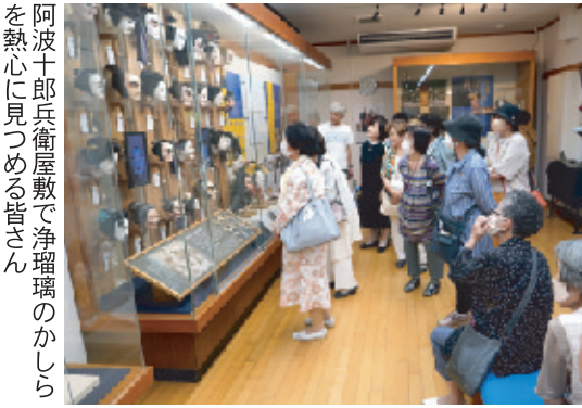
阿波十郎兵衛屋敷で浄瑠璃のかしらを熱心に見つめる皆さん

集合写真を撮って解散いたしました。その後、炎天下の栗林公園の中をしばらく歩いて、お食事所「吹上亭」で美味しいおうどんをいただきました。その日の宿泊先は小高い丘に立つ「花樹海」。例年行っていた出しものや、ビンゴゲームもなく、落ち着いてお料理を楽しむことができました。次の日には徳島県立阿波十郎兵衛屋敷で浄瑠璃の名場面を見学しました。参加者は二十四名と少し寂しかったですが、泊つきの研修でしたので、宿泊先やバスの中で充分交流ができました。