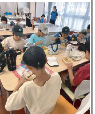
小学生と楽しくお食事する皆さん

もっと食べたい」と、いろんな楽しい声が飛び交う交流会となりました。「人参嫌い!」