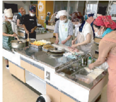
包丁の使い方を教わる子どもたち

が、工夫して行ってきました。通常、月一回ほど、年十回行っています。昨年度は、最終回三月に岡山まつり寿司をみんなで作り、地域の方にも、持って帰っていただきました。本年度は、岡山市出前講座二回「内水洪水」「資源ゴミの捨て方」、講演「岡山城主3人の評価を違った切り口から」と題して地域の歴史研究家にお話をいただきました。そして、九月には、竹を寄付して