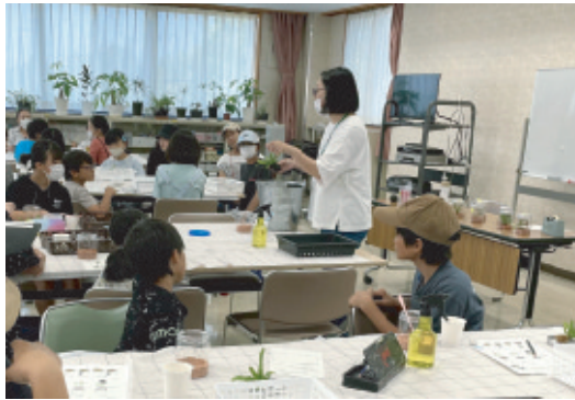
久しぶりのガーデニング教室で講師の説明を聞く親子ら

令和五年七月二十一日(金)浦安総合公園で久しぶりに親子ガーデニング教室が行われました。