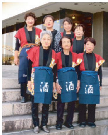
連合婦人会 (令和おどり他)