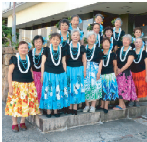
御津南学区 (高原列車は行く、乾杯)