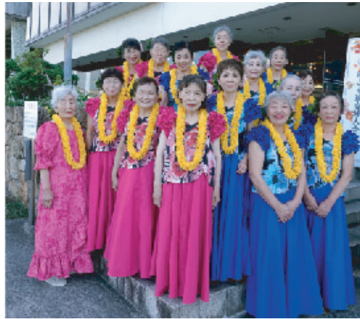
御津学区 (イ・コナ、ナニカマクラ)