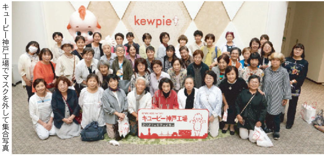
キューピー神戸工場でマスクを外して集合写真