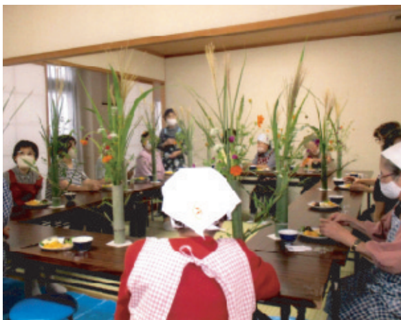
お月見に向け、秋の草花を生ける参加者

が、工夫して行ってきました。通常、月一回ほど、年十回行っています。昨年度は、最終回三月に岡山まつり寿司をみんなで作り、地域の方にも、持って帰っていただきました。本年度は、岡山市出前講座二回「内水洪水」「資源ゴミの捨て方」、講演「岡山城主3人の評価を違った切り口から」と題して地域の歴史研究家にお話をいただきました。そして、九月には、竹を寄付して