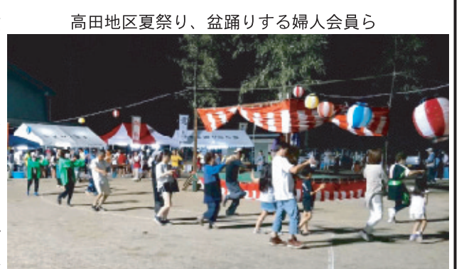
高田地区夏祭り、盆踊りする婦人会員ら