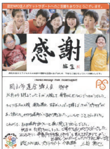
ポケットサポートから届いたお礼状