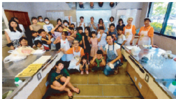
調理前にみんなで集合写真

午前中は中国の方の指導を受け親子でクッキング(本場の水餃子他)、午後よりディスコンで遊びました。