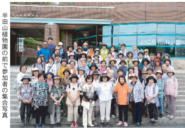
半田山植物園の前で参加者の集合写真