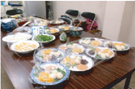
お月見団子を手作り

清輝学区でも婦人会が企画している地域交流会が、コロナの影響で中止を余儀なくされたこともありまし