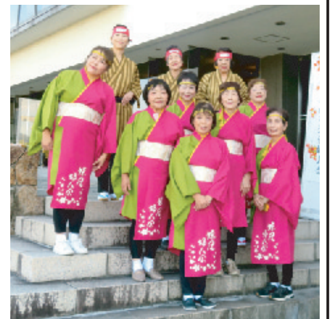
妹尾学区 (なんか一丁やっつろかい他)