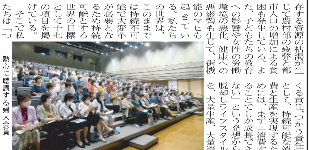
熱心に聴講する婦人会員

存する資源の枯渇が生じて農村部の疲弊と都市人口の増加による貧困も発生している。また、子どもたちの教育への影響や女性の労働環境の悪化、健康への悪影響も生じて、街機能のマヒも起きています。私たちの世界は、このままでは持続不可能で大変革が必要となるため持続可能な世界の実現として十七の項目を掲げている。そこで私たちは「つ