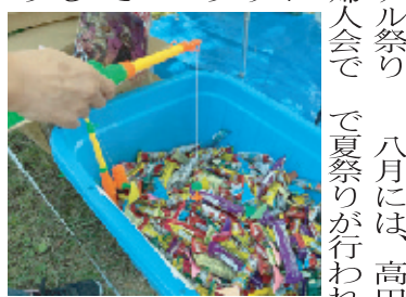
ホテル祭り、上手にお菓子が釣れました

六月に、ホテル祭りが開催され、婦人会では子どもたちに楽しんでもらうために、磁石のついたおもちゃの釣竿を使ってお菓子釣りをしました。大勢の