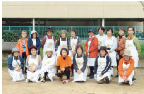
参加者の集合写真

皆様、おはようございます。お高いところからご参加くださりありがとうございます。一言ご挨拶申し上げます。平素は、岡山市連合婦人会の活動に多大なご理解と協力をいただきありがとうございます。厚くお礼申し上げます。最近、新型コロナウイルス感染症の影響