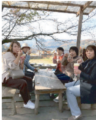
安富牧場でほっと一息

を味わうことができました。年々減少している会員数をくいとめるにはどうしたらいいか等いろいろと課題はありますが現在の会員を大事に、みんなで共に歩んでいきたいと挨拶