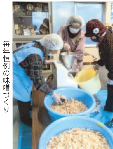
毎年恒例の味噌づくり

福浜学区では、毎年手作り味噌を作っています。家庭料理には欠かせない調味料の味噌。仕込みは、今年も「寒仕込み」で一月二十九日で終わりました