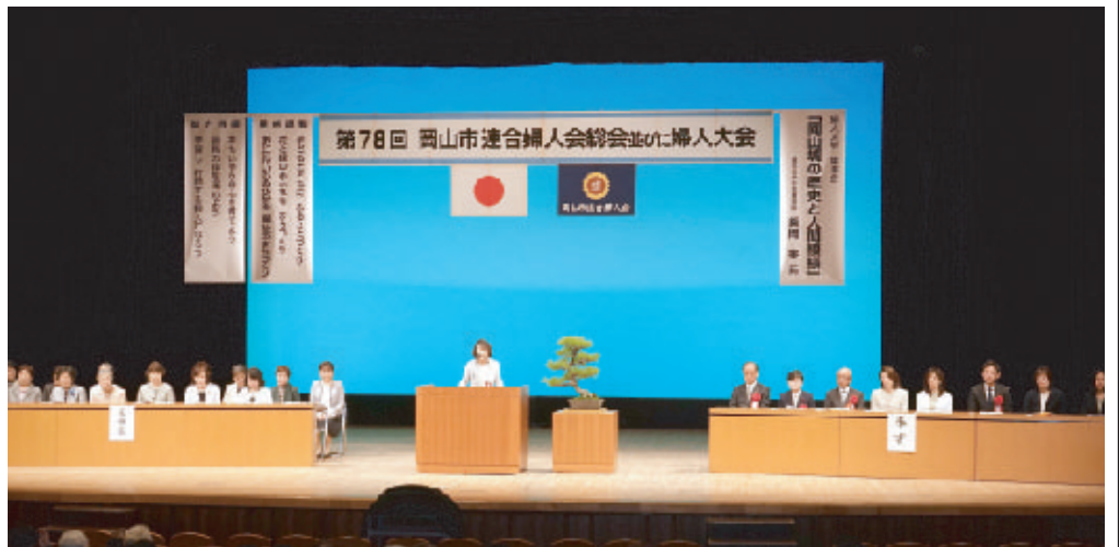
岡山市連合婦人会総会