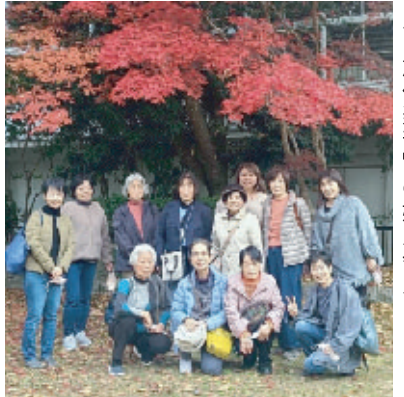
近水園などへの日帰り旅行を楽しんだ「旅倶楽部」の婦人会員

総会を無事に開催することができました。会員の高齢化が進み、コロナで休んでいた間に環境が変わってしまったりも少なくありません。今後の活動に不安を感じながら開催し