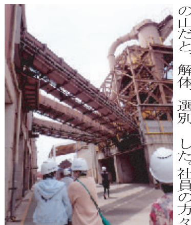
ヘルメット姿で現場を見学する婦人会員