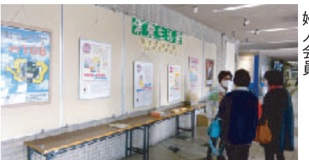
来場者の対応をするベ六人が展示物の説明と啓発グッズの配布や相談等を担当しました。

令和四年十一月十九・二十日の両日、消費生活展が岡山市役所一階市民ホールで開催されました。本来ならリサイクルバザーと併設で開催されるべきところ、コロナ感染が収まる気配もなく、やむなくバザーは中止となりました。岡山市消費生活センターの方と婦人会員延も頂きました。