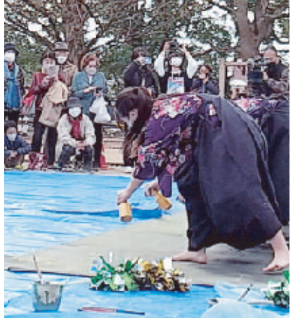
書道の実演をする高校生と見学者