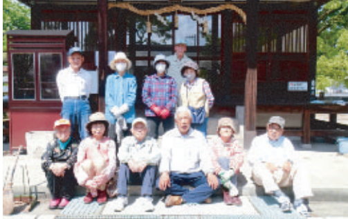
地域の方たちと白髭宮の清掃奉仕をする会員