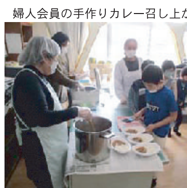
婦人会員の手作りカレー召し上がり

「ったいない精神」と「今よりもっと」という向上心を持って意見交換し協力して仕事をして