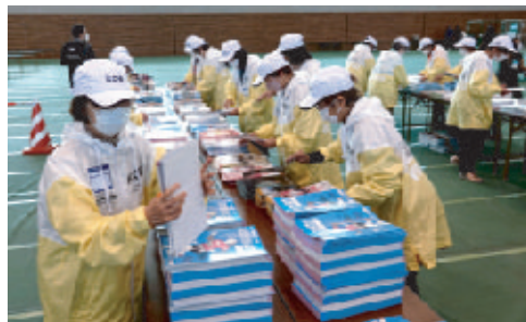
熱心に袋詰め作業する婦人会員

コロナ禍により三年ぶりに開催された「おかやまマラソン2022」は令和四年十一月十三日、「岡山」の街が