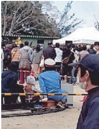
イベントの高校生の吹奏楽に見入る人々