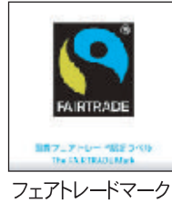
フェアトレードマーク

岡山市エシカル講演会が令和五年一月二十日(金)「エシカル消費の視点から考えよう私たちのくらしとSDGs」というテーマで、岡山市内十五の公民館に百七十五名の申込があり、オンラインで開催されました(写真は岡西公民館)。