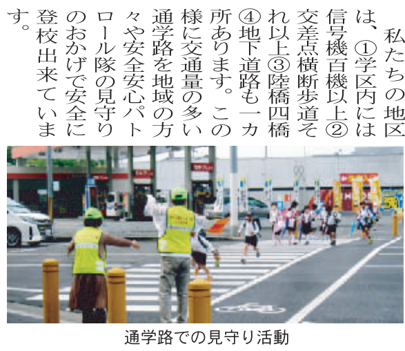
通学路での見守り活動

りですが、今年は鯉のぼりも一役買っている穏やかな光景です。以前とは変わって、子ども達は、しっかりとマスクを着用し密にならないよう間隔を空けて登校しています。 私たちの地区は、①学区内には信号機百機以上②交差点横断歩道それ以上③陸橋四橋④地下道路も一カ所あります。この様に交通量の多い通学路を地域の方々と安全安心パトロール隊の見守りのおかげで安全に登校出来ています。 あいさつ運動は、毎日「おはよう」「おかえり」のマスク越しの笑顔のあいさつです。子ども達の元気な声を聞くと私も元気をもらいます。 コロナ禍の今、人と