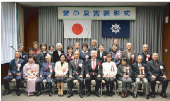
「愛の泉賞」受賞者の皆さん

令和三年二月二十二日、第三十二回岡山市愛の泉賞表彰式が市役所で行われ、大森市長より表彰状と記念品が