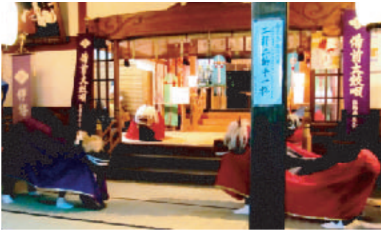
備前太鼓唄獅子舞

私達の弘西地区には伊勢神社があります。このお宮は、三重県の伊勢地方に有る伊勢神宮の本宮として祭祀を続け社歴が二千有余年 あり備前の国で最も古い神社です。池田家の僱事一切を執り仕切った時代もありました。明治初年頃から、備前太鼓唄獅子舞は五穀豊穰を願い、邪気を払う力強い舞を奉納したものが今に伝わっています。 この大切な伝統芸能が廃れては大変だという事で平成六年に弘西備前太鼓唄普及会を立ち上げ現在に至っています。 獅子の舞は勿論、独特の太鼓の打ち方、鉦