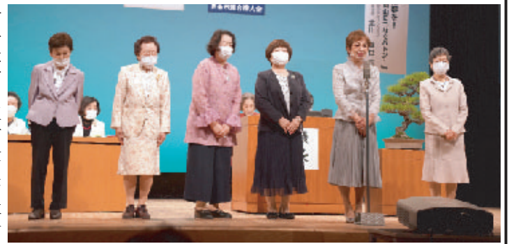
岡山市連合婦人会役員を退任された皆さん