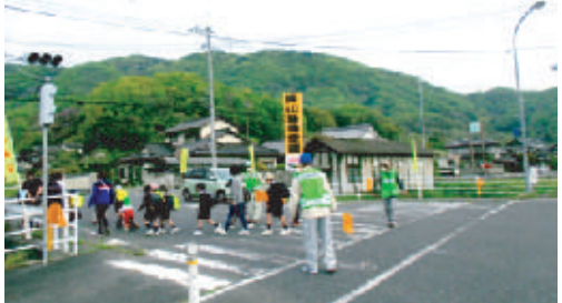
登校する小学生の見守り活動

の西北に位置し豊かな自然に囲まれています。地域の各種団体からなる福谷コミュニティ協議会があり、いろいろな行事等を行って