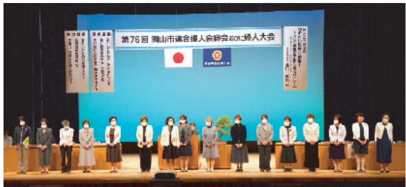
今年度、役員に就任された皆さん

第七十六回岡山市連合婦人会総会並びに婦人大会が、四月十四日（水）岡山市民会館で開催されました。新型コロナウイルス感染症防止のため、客席人数は例年の三分の一の三百六十人余りでした。「君が代」も演奏が流れるだけで、斉唱はしませんでした。ご来賓につきましても、今年度はコロナ禍のため、人数を限ってご臨席いただきました。