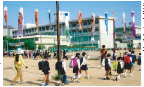
鯉のぼりに見守られながら登校する小学生ら

りですが、今年は鯉のぼりも一役買っている穏やかな光景です。以前とは変わって、子ども達は、しっかりとマスクを着用し密にならないよう間隔を空けて登校しています。 私たちの地区は、①学区内には信号機百機以上②交差点横断歩道それ以上③陸橋四橋④地下道路も一カ所あります。この様に交通量の多い通学路を地域の方々と安全安心パトロール隊の見守りのおかげで安全に登校出来ています。 あいさつ運動は、毎日「おはよう」「おかえり」のマスク越しの笑顔のあいさつです。子ども達の元気な声を聞くと私も元気をもらいます。 コロナ禍の今、人と