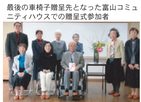
富山コミュニティハウスの贈呈式参加者

このアルミ缶のプルタブ収益活動は平成十七年度から開始し、平成十九年度から回収による収益で車椅子を購入し、市内の公民館やコミュニティハウスに贈呈してきましたが、プルタブ回収は令和二年度で終了させていただきます。長い間ご協力いただきましてありがとうございました。