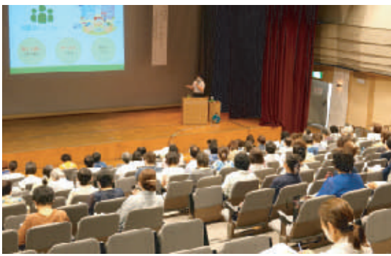
婦人リーダー養成研修会

令和二年八月三十一日、岡山ふれあいセンターに於いて、「婦人リーダー養成研修会」が行われました。コロナ禍の中ではありましたが、参加人数の制限を設け、マスク着用や消毒を徹底し、感染症対策を施しながら開催されました。 また、新型コロナウイルス感染症関連商品がたくさん出回っている中、誇大広告やお得情報に惑わされること