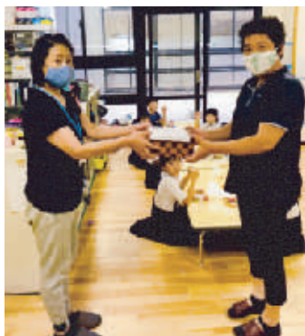
児童クラブでマスク作り

目近地区は岡山空港の西に位置し、風光明媚な山里です。令和二年になり世界的なコロナ禍により、総会の中止を余儀なくされ、役員さんに奔走して頂き、総会の書面決議を行う事が出来、賛成多数にて総会資料を決議いたしました。毎年恒例の地域行事であるホテル祭りや、