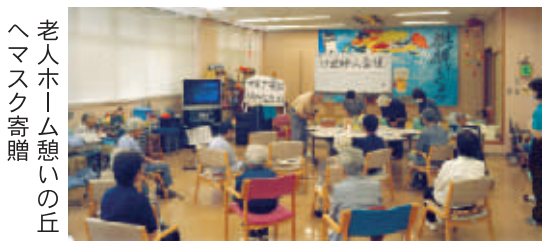
老人ホームへのマスク贈呈

必需品の手作りマスクの作成に取りかかりました。地元の老人ホーム、児童小学校児童クラブへ四十枚を贈呈しました。