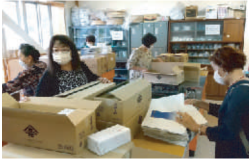
足守学区、日近・岩田・福谷・大井地区

足守地区は毎年合同で趣向をこらした敬老会を開催しますが、今年度は新型コロナウイルス感染防止のため中止と致しました。敬老会対象者のご家庭を岡山