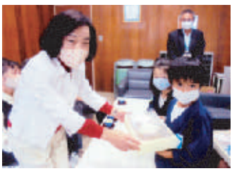
雄神幼稚園 雄神小学校

がたく思い、学んだ事柄を地域へ持ち帰り、婦人会のリーダーとして活躍の場を広げていきたいと思えます。 ク八十四枚寄贈。婦人会と有志で縫製。 ■平福学区 令和二年四月二十二日（水） 地域各町内会長、公民館の方々、婦人会員へ手作りマスク寄贈。総会中止の代替で、今不足しているマスクを作ろうと、少人数で四日間通して製作。材料の無い中ガーター浴衣などを活用するなどアイデアを出して団結。不足していた時期でしたので喜んで頂きました。 ▽四月四日（火）婦人会の呼び掛けで、各町内でも協力して頂いて雑巾百三十枚を製作。幼稚園・保育園に寄贈