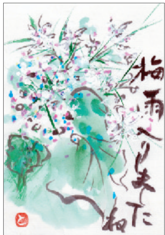
西学区・廣瀬会長作