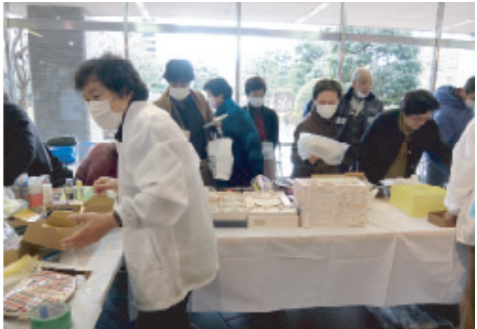
不要品の有効活用の啓発にもつながったリサイクルバザー

令和二年二月二十六日（水）岡山市消費生活研究協議会主催の「消費生活展・リサイクルバザー」を市役所一階市民ホールで開催しました。