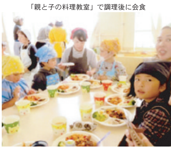
「親子の料理教室」で調理後に会食

かけても、なかなか活動の輪を広げることが難しいのが現状です。その中で人数は少ないのですが、和気あいあいとできる範囲で楽