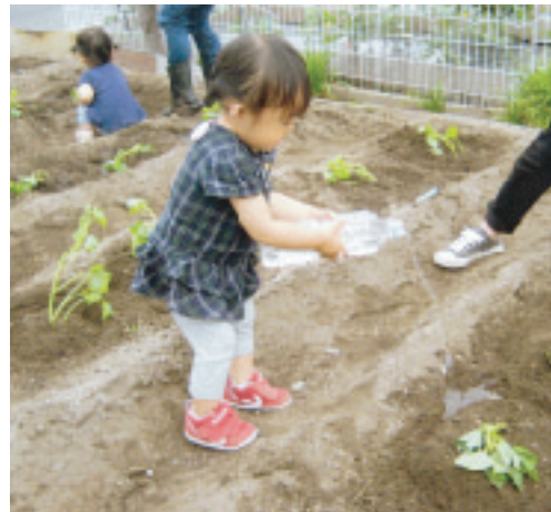
植えた芋苗に水をかける子ども

今年も新型コロナウイルスの影響で行事の中止の多い中、五月二十六日曇空のもと、食育でさつまい芋の苗植えを行いました。