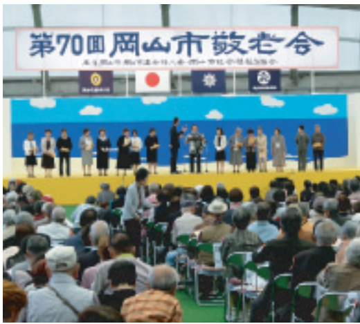
岡山市合同敬老会 (福祉部)