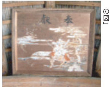
天井に架けられた絵馬「義家観鷹(かんがん)の図」

①「土田街道ウオッチング」というウェブページで古き街の姿を残すことができました。 ②「観音堂」御本尊の観音菩薩様は質素なお堂に美しい立ち姿で祀られています。今も地元の人や、土田福寿会(老人会)の手で春秋の縁日(十七日)には、お経をあげて観音堂とその周辺を護り祀っています。 ③「八幡宮」地区の山ふところにあり、集落の鎮守として氏子が守り続けた小さなお宮です。この「八幡宮」の今に伝わる歴史物語