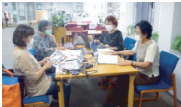
会報の編集作業（広報啓発部）

コロナ禍の節、三密を避けながらの会報の編集作業は困難と不便を伴います。これを機会にパソコン・SNSのご活用の方の皆様の協力を得て原稿収集・編集・校正作業に無理