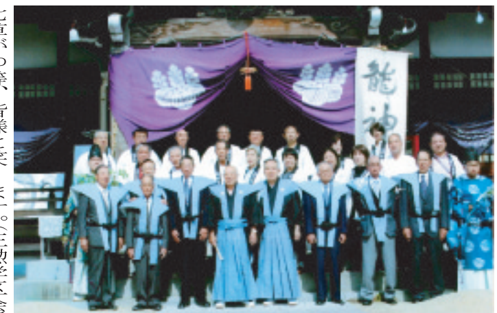
玉井宮の稚児行列のお手伝いに、地域各種団体の方々と共に