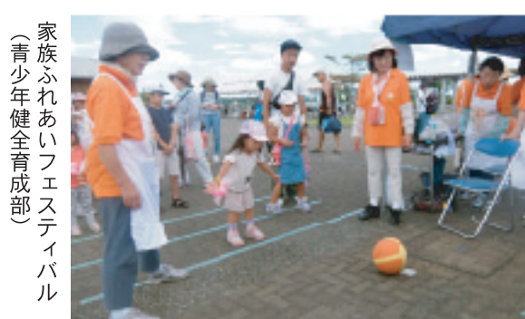
家族ふれあいフェスティバル (青少年健全育成部)