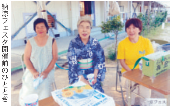
納涼フェスタ開催前のひととき

我が学区は各種団体と密に連携し様々な活動を行っています。春の四世代交流フェスタでは、婦人会は抹茶席をして皆様に楽しんでいただいています。夏には納涼フェスタで、約千人の住民の方々がお越しになりました。その他、運動会・防災キャン