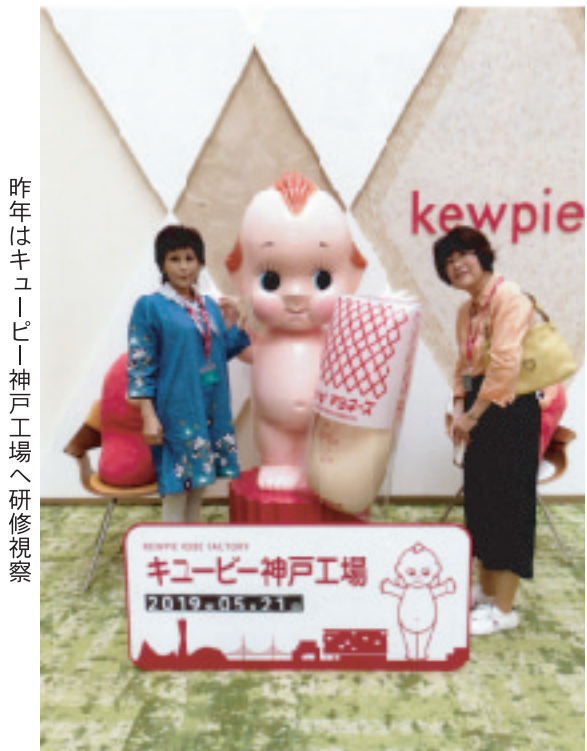
昨年はキューピー神戸工場へ研修視察

高島学区婦人会の努力目標は「会員意識を高め、連帯感を深めよう」「学習し、行動する婦人になろう」「私達の手で明るい高島にしよう」と決定しています。この目標を達成するために、毎年研修視察を計画していま