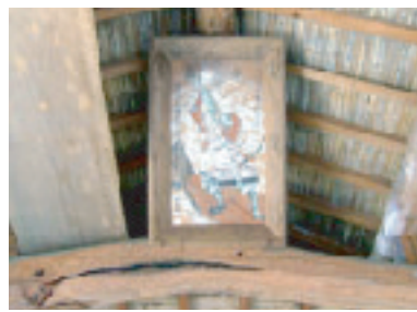
天井に架けられた絵馬「新羅退治図」

昔懐かしい町並みには、名もない石造物、小さな街角、昔の人の暮らしや信仰の記憶が詰まっているが、新しい町に変わる日も近いでしょう。