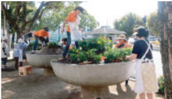
婦人の森花植え（環境浄化部）