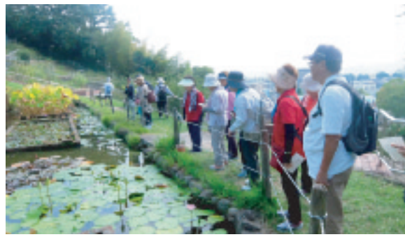
↓婦人文化祭(体育文化部)緑のハイキング↑