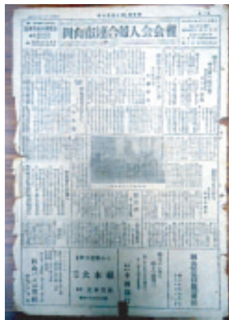
昭和24年発行の会報第1号