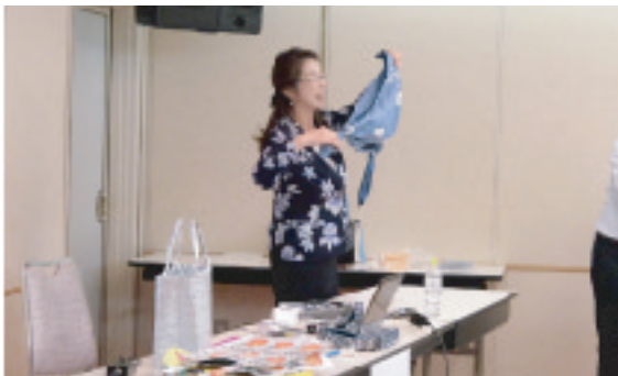
エシカル消費講演会（消費生活部）