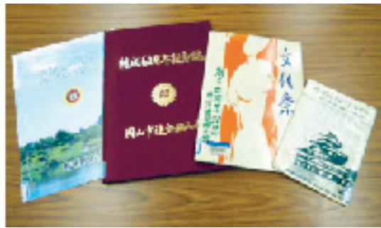
婦人会に関する資料