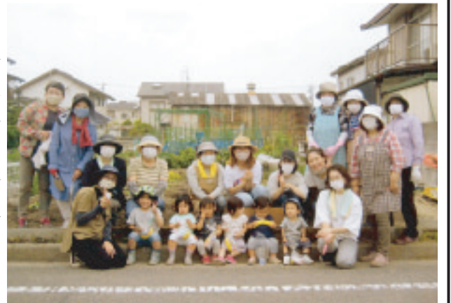
芋苗の植え付けに参加した親子と婦人会員ら地域のボランティア

後のふかし芋と牛乳は、おいしくて自然と笑顔になります。十一月はさつまい芋を使った料理を幼児も参加して作り会食。一年を通して