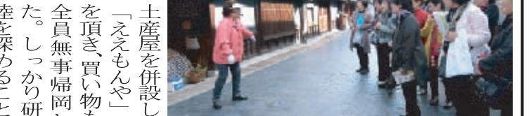
「たけはら町並み保存地区」の観光ガイドの案内を聞く会員

ました。江戸時代製塩業や酒造業で財を成した人たちが建てた立派なお屋敷、由緒あるお寺の町並みがそのまま保存されていました。 個人所有の家から成り立っていることで、町の人は町並みをずっと大切に守り続けてきたんだなと思いました。 尾道では最大級のお