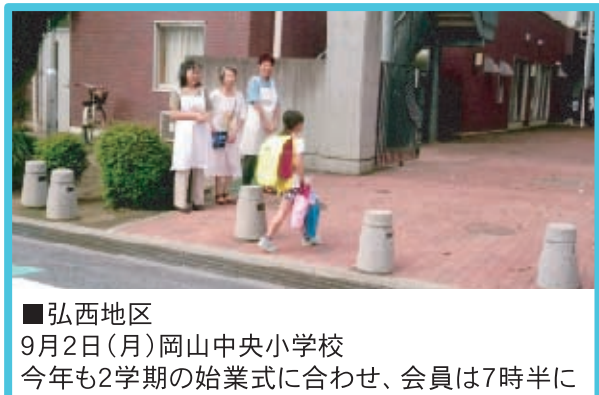
■弘西地区 9月2日(月)岡山中央小学校 今年も2学期の始業式に合わせ、会員は7時半に集合。先生方と一緒に、登校の児童を迎えました。私たちのひまわりエプロンを見ると、笑顔の子・はにかむ子。逞しく育てと、エールを送った朝のあいさつ運動でした。