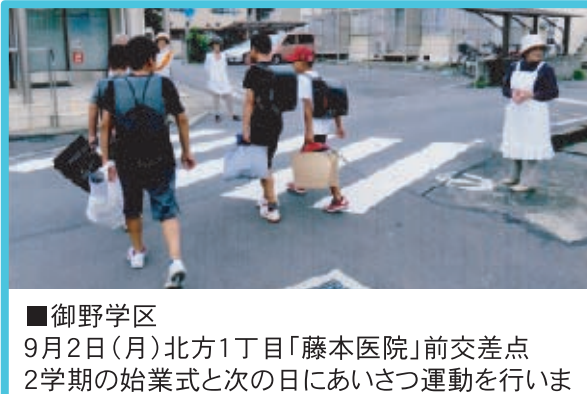
■御野学区 9月2日(月)北方1丁目「藤本医院」前交差点 2学期の始業式と次の日にあいさつ運動を行いました。夏休みの間に体験した作品を手提げ袋いっぱい詰めて、元気にあいさつを交わしながら登校していました。この場所は、狭いながらもとても交通量が多く、私たちも気配りしながら活動しました。