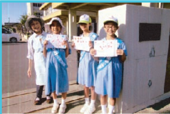
■南輝学区 9月25日(水)南輝小学校