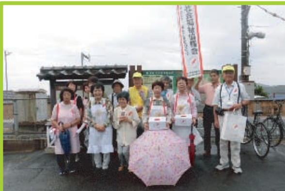
■庄内学区 10月3日(木)JR足守駅 午前7時30分から1時間。共同募金活動と共催で、婦人会員・愛育委員・民生委員・町内会長で実施。