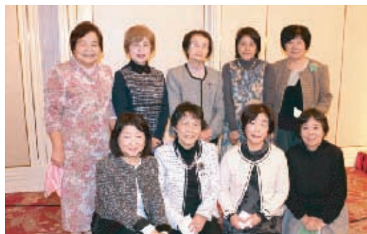
庄内・三勲・御津南学区の皆さん