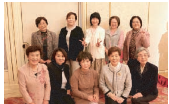
三門・大元・南輝学区の皆さん