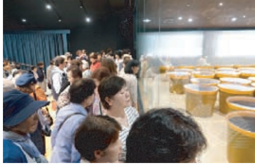
発酵のため3年以上眠る樽を見学

令和元年九月二十六日(木)天候不順の候、久しぶりにさわやかな秋晴れとなり、バス二台連ねて会員六十三名で、しまなみ海道に隣接する二施設へ産地見学に出掛けました。