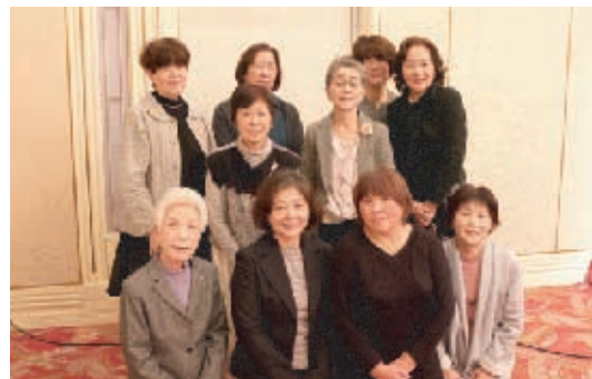
高島・富山・石井学区の皆さん