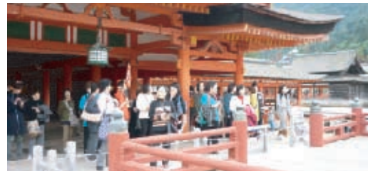
神殿の見学をする会員

いてお話をしていたいただきました。その後、たけはら観光ガイド会の方に実際に竹原の町並みを案内していただき