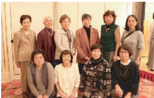
日近・岩田地区、雄神・鹿田学区の皆さん