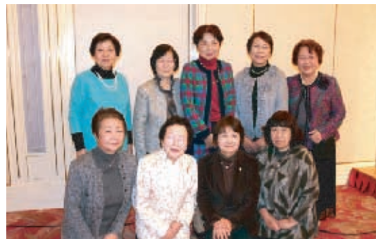
内山下地区、灘崎・御野・平福・竜之口・大野学区の皆さん