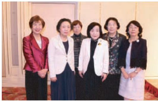
会長、副会長3名、理事2名の皆さん