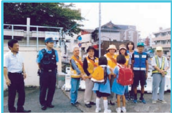
■清輝学区 9月2日(月)～6日(金)清輝小学校 5日間のべ20人参加。