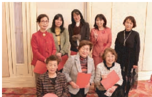
弘西地区、妹尾・御南学区の皆さん