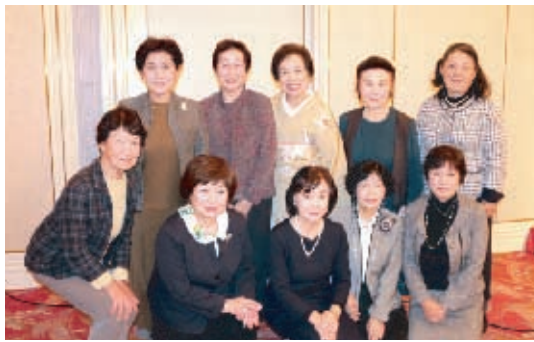
出石地区、旭操・岡南・福浜学区の皆さん