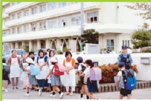
■旭操学区 9月17日(火)旭操小学校 9月24日(火)旭操幼稚園

岡山市連合婦人は、2005年岡山国体を機におもてなしのあいさつ運動を岡山駅周辺で行いました。 国体後も引き続き青少年健全育成部を中心に各地域で通年実施しています。