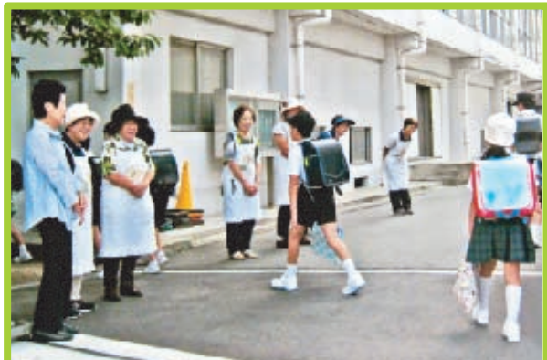
■福浜学区 9月2日(月)福浜小学校