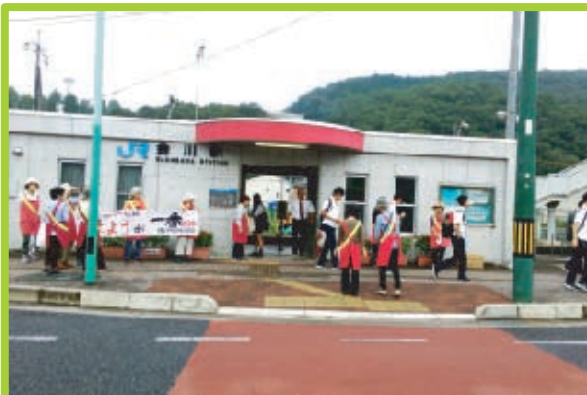
■御津学区 9月2日(月)JR金川駅 北署でいただいたポケットティッシュをあいさつをするともに配布しました。