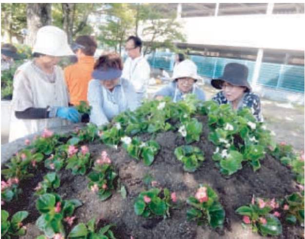
ベゴニアを丁寧に植え付けする婦人会員

一生懸命走り抜けるランナーの方から、汗と努力のエネルギーをいただきました。 今回は令和元年十月十九・二十日に開催さ