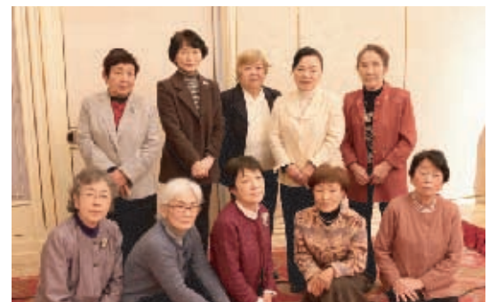
清輝・宇野・角山・御津・西学区の皆さん