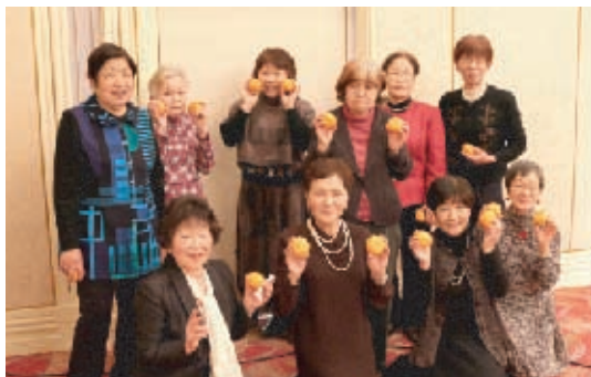
陵南・福島学区の皆さん