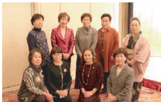
大井・福谷地区、足守学区の皆さん