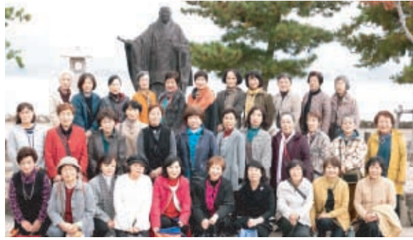
平清盛像の前で集合写真

一日目、フェリーに乗り日本三景・世界遺産の島「宮島」へ。しかし宮島のシンボルである海に浮かぶ朱色の大鳥居が見当たりません。令和の大改修で白 その後、表参道商店街を散策しました。通りの左右には宮島杓子や土産物店、牡蠣や穴子の名物料理店、旅館などがびっしりと並んでいました。焼きたての牡蠣やもみじ饅頭は最高に美味でした。 二日目は「道の駅たけはら」で竹原市役所職員の方から、たけはら町並み保存地区につ