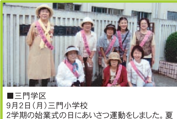
■三門学区 9月2日(月)三門小学校 2学期の始業式の日にあいさつ運動をしました。夏休みの宿題を大切に抱えて元気にあいさつしてくれました。幼稚園では、小さな子ども3人を連れて送迎をするお母さん。子育てに奮闘するお母さんの姿が頼もしかった。