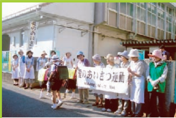
■灘崎学区 9月10日(火)灘崎小学校

岡山市連合婦人は、2005年岡山国体を機におもてなしのあいさつ運動を岡山駅周辺で行いました。 国体後も引き続き青少年健全育成部を中心に各地域で通年実施しています。