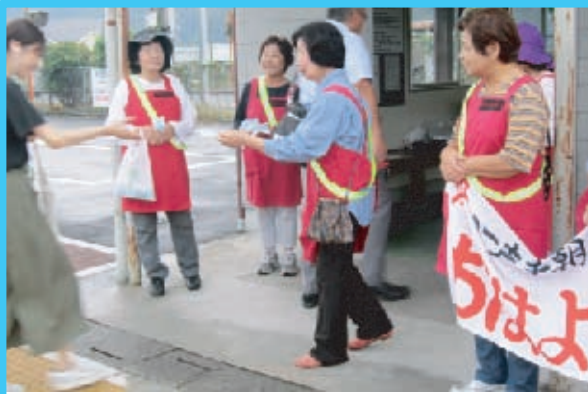
■御津南学区 9月2日(月)JR野々口駅 北署からいただいたポケットティッシュを手渡しました。