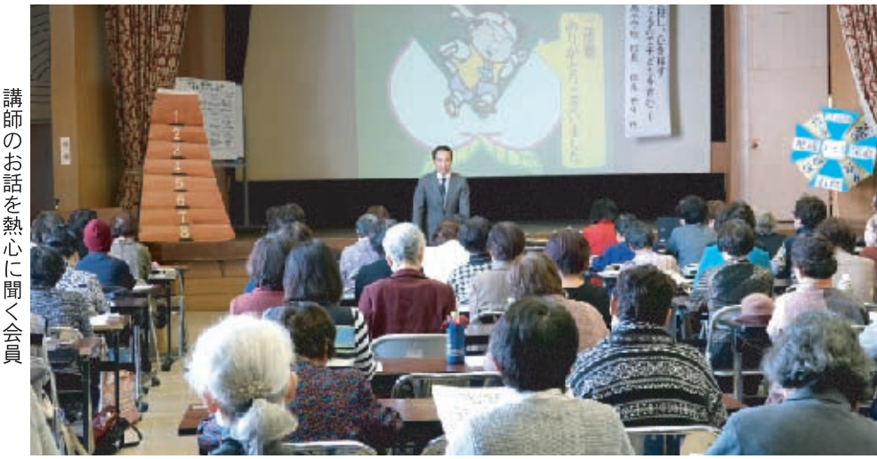
講師のお話を熱心に聞く会員