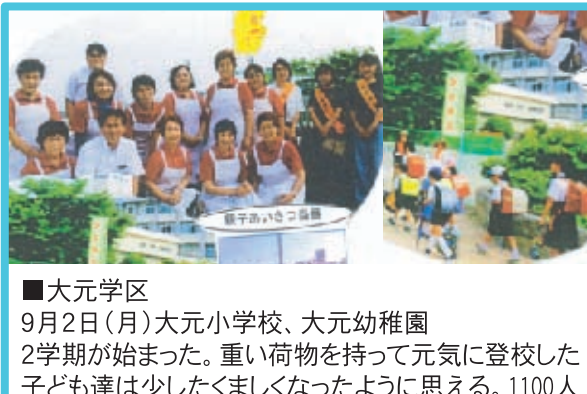
■大元学区 9月2日(月)大元小学校、大元幼稚園 2学期が始まった。重い荷物を持って元気に登校した子ども達は少しくましくなったように思える。1100人のほとんどの子どもがあいさつができ、当番で見送る父兄も、長い休みを無事過ごせた笑顔があり、私たちも自然と元気よくあいさつができました。あと、幼稚園でも園児と一緒に可愛らしいあいさつ運動ができました。