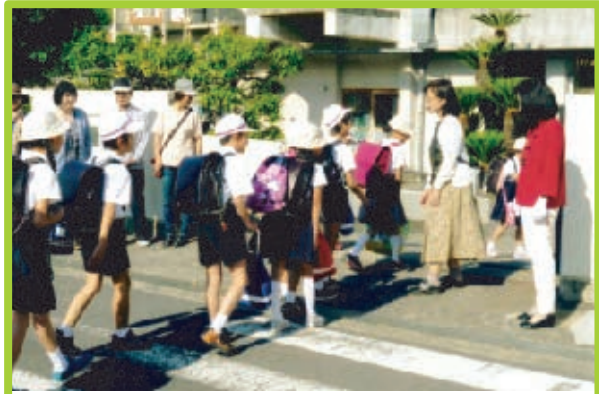
■雄神学区 6月13日(木)雄神小学校 6月6日、9月5日・12日・19日・26日、11月も2回実施。