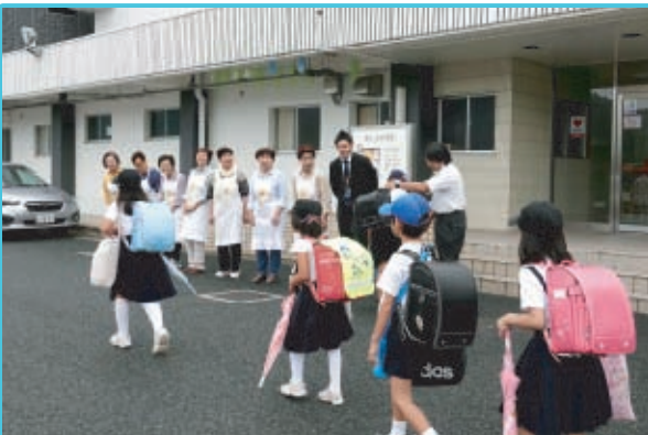
■福谷・岩田・日近・大井地区 9月2日(月)蛍明小・足守中学校 蛍明小・足守中学校体育館前で、福谷・岩田・日近・大井地区の婦人会員が実施