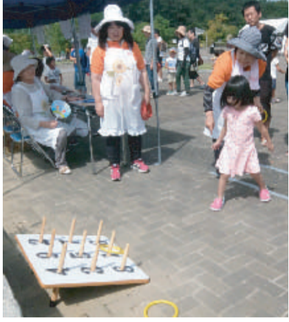
家族ふれあいフェスティバル