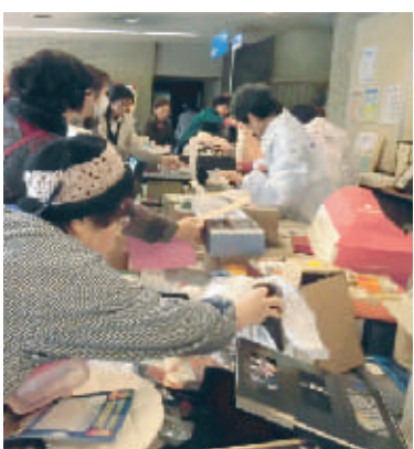
大勢の来場者でにぎわった消費生活展・リサイクルバザー(岡山市役所)

九年度の事業報告、決算報告が行われ、続いて平成三十一年度の事業計画と収支予算が承認されました。また、平成二十九年