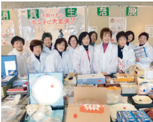
消費生活展・リサイクルバザーの当日運営に携わった会員