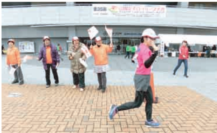
小旗を振りながら応援する婦人会員(シティライオスタジアム前)

平成二十八年十二月二十三日(金・祝)第三十五回山陽女子ロードレースがシティライオスタジアムを発着点