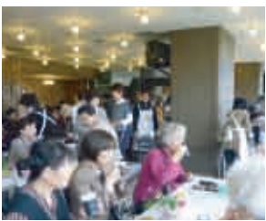
カフェコーナーでホッと一息する会員(岡山市民文化ホール)

頭)、農作業を着て踊るユニークな「いもがらぼくと」皆さんとても芸達者な人たちです。秋の一日を楽しく親睦を深め、お互いに評価しながら尚一層の活躍を誓いました。今後はより多くの一般のお客さんにも見ていただき郷土の芸能等広めていきたいものです。