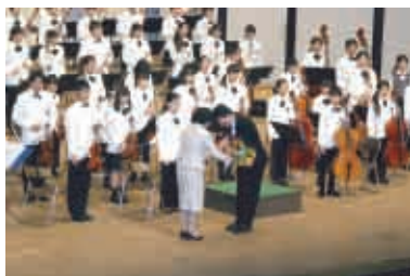
指揮者へ感謝の花束を贈呈