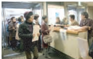
続々と入場する会員