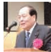
片山虎之助参議院議員