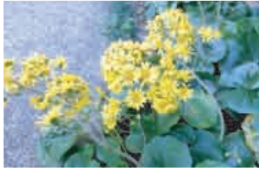
牧野植物園に咲く黄色が美しいツワブキ