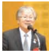
目黒宏平市連合町内会長