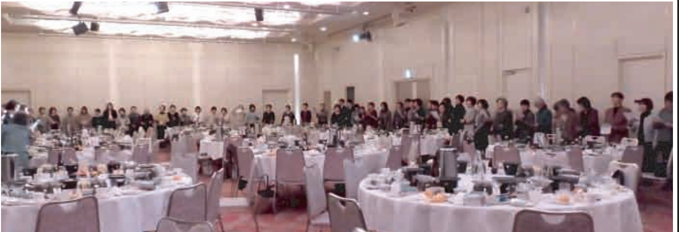
フィナーレで合唱する会員