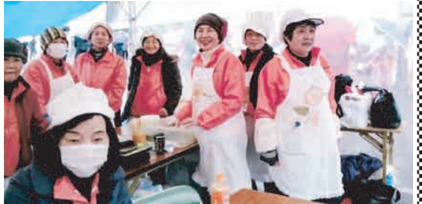
恒例のうどんでもてなす婦人会員(岡山ドーム前)