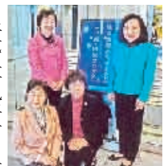
フォーラムに参加した会長、副会長

平成二十九年一月二十日(金)、かがわ国際会議場で開催された地方消費者フォーラムに参加しました。大寒の、厳しい寒波と悪天候の中でしたが約百二十名の出席者が熱心に研修しました。