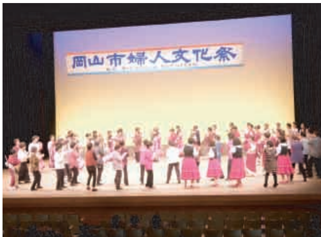
フィナーレを飾る総踊り(岡山市民文化ホール)

成人の日を前に一人の旅をしている新成人を意味しているということでした。今年も、新成人の集い実行委員会からうどんの出店をお願いされ、岡山市連合婦人会も新成人の門出に一役買いました。未来に向かって羽ばたいていくことをお祈りしています。おめでとうござ