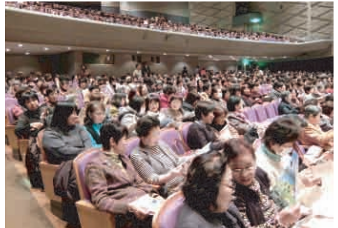
大勢の会員が出席