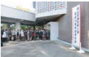
開場を待つ大勢の会員