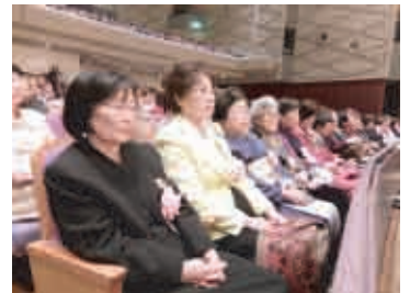
感謝状を贈られた学区地区会長の皆さん