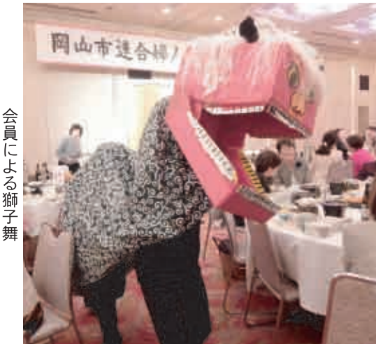
会員による獅子舞