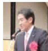
逢沢一郎衆議院議員