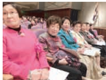
元学区地区会長の皆さん