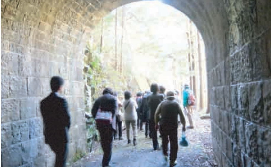
重要文化財の旧森林鉄道のトンネルを視察する会員

安らぎと温かさを感じさせたくれました。受注センターオフィスに複数台のパソコンが並んでいるのが対照的で感動すら覚えます。