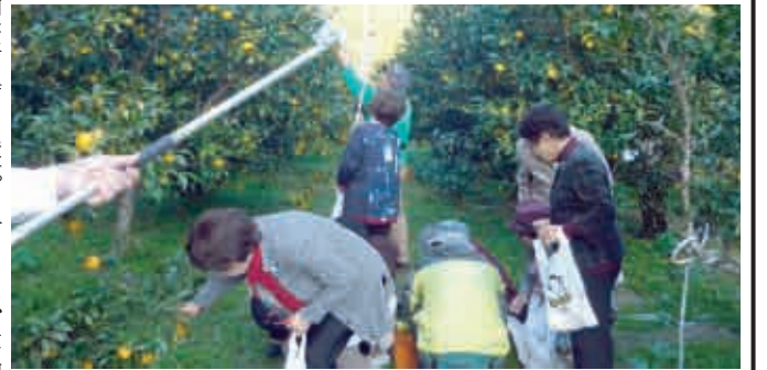
馬路村特産のゆずの収穫体験をする会員