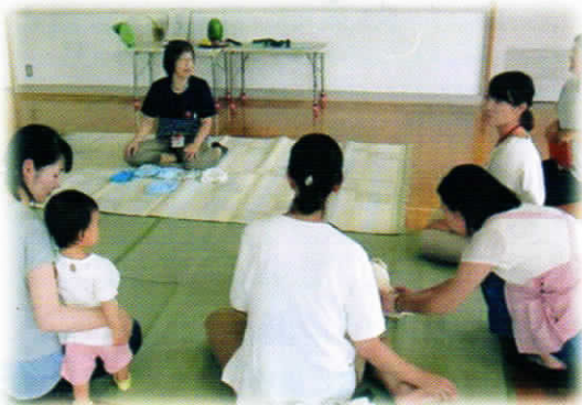
(子育て支援：トイレトレーニング)

言葉づかいや態度に反抗を感じたらどう対応し受け止めてやるべきか、またお話を聞いてみたいです。 (参加されたお母さんの声)