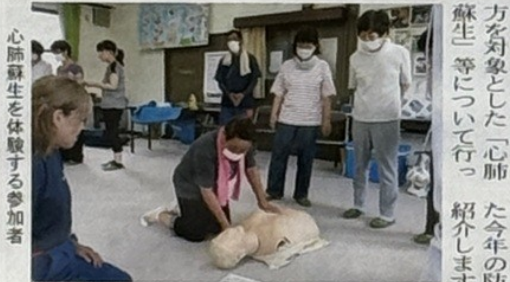
心肺蘇生を体験する参加者

から次のような活動を行っています。「ファンタジック福谷」「自主防災会の防災訓練」「福谷地区文化祭」など、「若い力が欲しい!!」と思いつきながら頑張っています。 婦人会では、自主防災会での防災訓練とは別に女性の目線から防災訓練を毎年行っています。福谷消防団のご協力のもと応急手当普及員の方をお招きし、婦人会、地域の