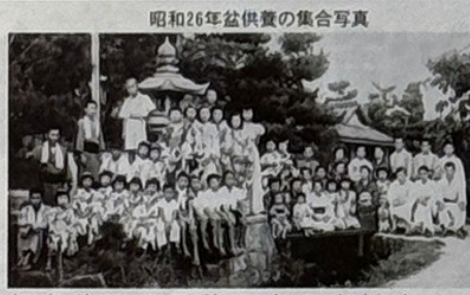
昭和26年盆供養の集合写真

私たちが庄内学区婦人会は、地内に庄内という地名がなく場所を聞かれることもありま 岡山駅から国道180号線を西へ十キロ、吉備の中山を遙か東に望み、足守川が北から南に流れる風光・人情共に穏やかで、古代吉備文化の中心であったと