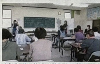
応急手当などを聴く防災訓練の婦人会員ら

岡山市の西北に位置し自然豊かで高齢化が進んでいる私達の福谷地区です。地域の各種団体の方々と協力しな