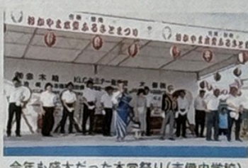
今年も盛大だった木堂祭り(吉備中学校)

七十六歳で内閣総理大臣の要職につき、憲政の神様と称されたが、5・15事件で凶弾に倒れました。 木堂先生をしのんで墓前に参拝した後に生家の門前で、地元の方々と記念撮影を行い、お祭り会場へ向かいました。婦人会では木堂婦人役として、重要な役目を果たしております。