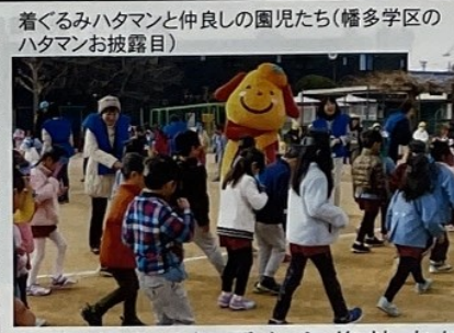
着ぐるみハタマンと仲良しの園児たち(幡多学区のハタマンお披露目)

幡多学区婦人会員四十名が参加した令和五年度連合婦人会総会で、この四年間、絆やつながりが稀薄になり地域の教育力の向上、社会生活の修復等、人と人とのつながりの重要性が示された。学区では、さっそく新たな約束事を決めて実行した。