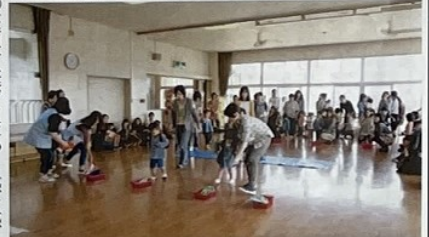
未就学親子とゲームやかけっこのごっこ遊びの一場面

「今年も楽しみに待っていたのよ」「嬉しいよ」「ありがとう」「来年も深い感謝と胸がいっぱい笑顔と対話です。」