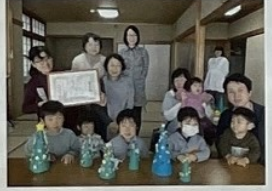
読み聞かせ活動の様子

足守公民館 読み聞かせボランティアグループ「えほんのもり」=写真=が岡山県読書推進運動協議会より表彰されました！平成11年3月に発足したこのグループは、足守公民館で月に一回の読み聞かせ会を開催しています。毎月、絵本の読み聞かせや紙芝居、工作などを行い、夏休みには小学校で出前講座を開催。「読書フェスティバル」も学校図書館司書の先生方と一緒に企画運営しています。この度、長年に渡り活動が継続し地域の読書環境の充実に貢献していることが認められ表彰されました。これからも、メンバーと公民館、地域の皆さんと共にあたたかい場を作っていきたいと思