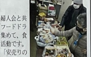
フードドライブ活動の様子

富山公民館ではとみやまエコクラブ、富山学区婦人会と共催で、1月15日(月)~28日(日)の期間に、「フードドライブ」を実施しました。家庭で余っている食品を集めて、食品を必要としている団体や福祉施設等に寄付する活動です。公民館だよりで食品の提供を呼びかけたところ、「安売りの時に買いすぎてしまった」「贈答品の食用油が余っている」など、多くの食品をお寄せいただき=写真、児童養護施設、ひとり親支援団体等に寄付させていただきました。世界的な問題となっている「食品ロス」を自分ごととして捉え、身近なところから取り組むきっかけにもなったようでした。