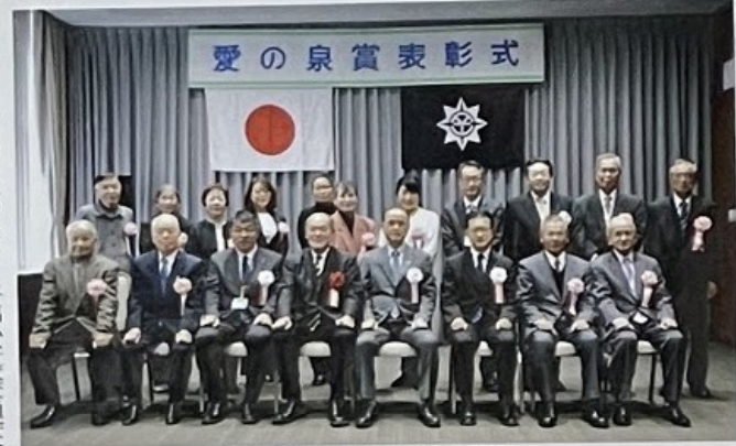
受賞者及び大森市長ら表彰式出席者