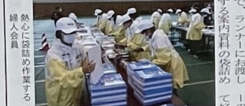
熱心に袋詰め作業する婦人会員

岡山市連合婦人会では、昭和二十七年頃から障がいのある人や子どもたちの幸せを願い「愛の泉金」活動を続けています。現在では運動の輪を広げて社会的に弱い立場にある女性・高齢者・病児等や労働者支援B型事業所、一社社団法人フリーストベンギン（児童発達支援・放課後デイサービス、御津なかよし作業所（心身障害者通所作業所）に贈呈が決定しました。 また、トルコ・シリチア地震（二月六日発生）の被災者支援として、二月二十日に「被災地緊急支援基金」から日本赤十字社岡山県支部へ義援金三十万円を寄付しました。