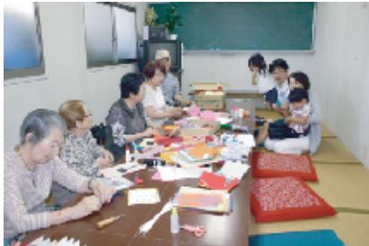
七夕まつりの事前準備の一つとして、笹飾り作りを6月18日・24日にしました。18日=写真㊦=は地域の三世代交流を兼ねて、子育て世代の親子も参加。24日=同㊦=は和サロンでの集まりで作りしました。立派な七夕飾りになりそうです