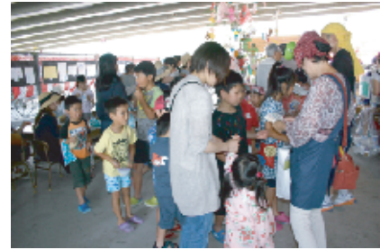
七夕まつりの告知ポスターを描いた子どもたちにお礼のプレゼント。今年は20人余りが協力してくれました