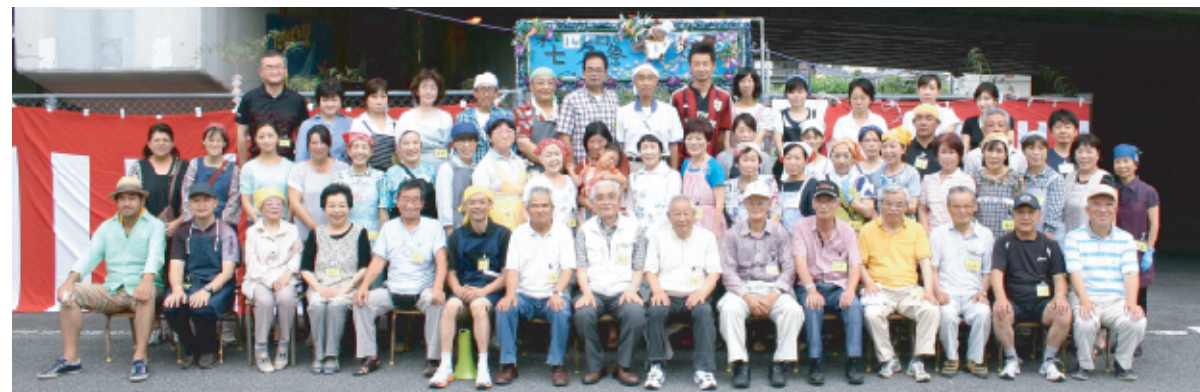
第14回七夕まつり実行委員会(実行委員長・河本町内会副会長)のメンバー。町内のベテランから若い世代の方たちまで多様な顔ぶれ