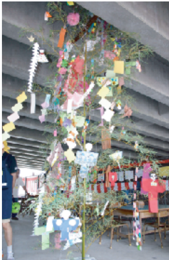
→まつり会場。ワイワイガヤガヤとにぎやかです