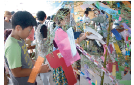
会場に用意された短冊に願い事を書いて、笹に結び付ける来場者。どんな願い事を書いたのかな?!