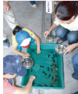
みくんな夢中になる金魚すくい。優雅に泳ぐ黒出目金とすばしっこい赤の金魚。すくえるかな?