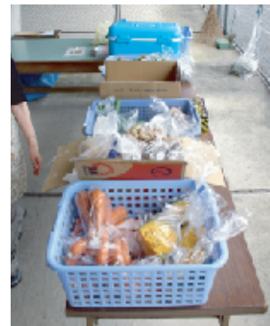
会場の一角で、町内の方々が育てた夏野菜などを販売。2袋で100円!主婦の味方です