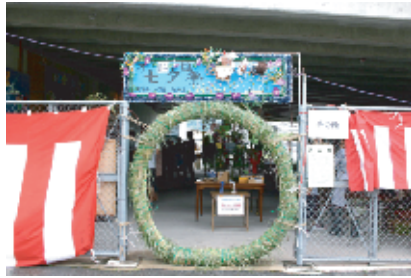
会場入り口は、毎年恒例の茅の輪と門飾り。茅の輪は前日早朝の茅刈りから製作が始まります