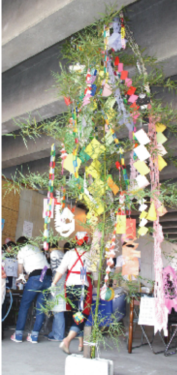
短冊に書かれた願い事。来賓の方も書いていただきました=写真右

メインの七夕飾り。いろとりどりの飾りは、事前に親子らが集まって作ったり、和サロンの方たちが用意してくれました。きれいですね