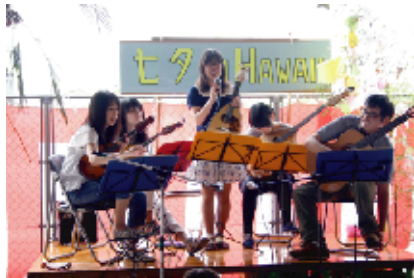
ギターマンドリンクラブのメンバーは現在44人。8月23日にサマーコンサート、12月20日に定期演奏会を開催予定