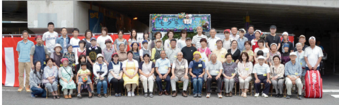
第13回七夕まつりの運営に協力してくださいました実行委員の皆さん。たくさんの方の協力のおかげです