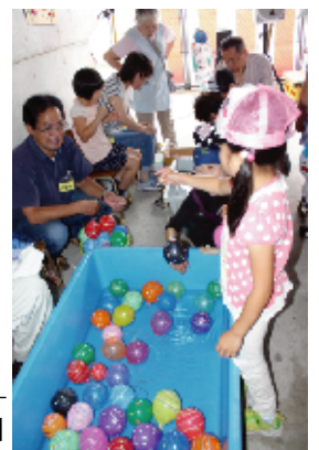
ヨーヨー釣り「つれたよ!」