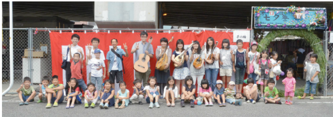
岡山大学ギターマンドリンクラブの学生さん5人と、七夕まつりに来てくれた子どもたち。将来の大和町一丁目をよろしくネ♪