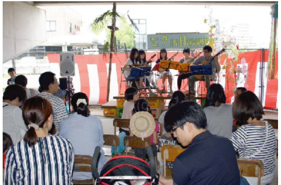
岡山大学のギターマンドリンクラブの5人が「星に願いを」「上を向いて歩こう」「銀鉄道999」など、アンコール曲を含めて7曲演奏してくれました。繊細で透き通るような音に聞き入りました。ステージ脇には“椰子の木”もお目見えしました

メインの七夕飾り。いろとりどりの飾りは、事前に親子らが集まって作ったり、和サロンの方たちが用意してくれました。きれいですね