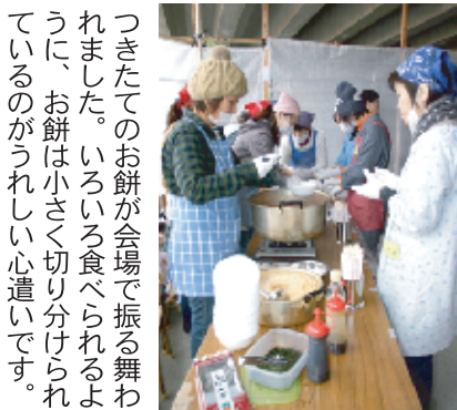
つきたてのお餅が会場で振る舞われました。いろいろ食べられるように、お餅は小さく切り分けられているのがうれしい心遣いです。