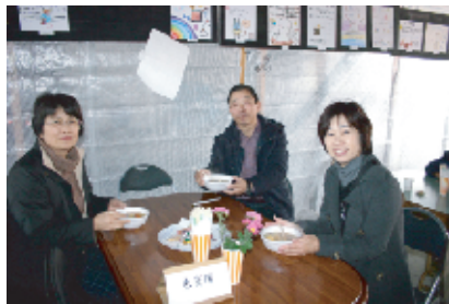
幼・小・中の園長・校長先生もご来場