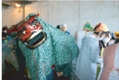
昨年に続いての獅子舞。会場の中を練り歩いて、厄を払い、福を振りまいてくれました。