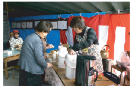
温冷の飲み物、どちらがいいですか？