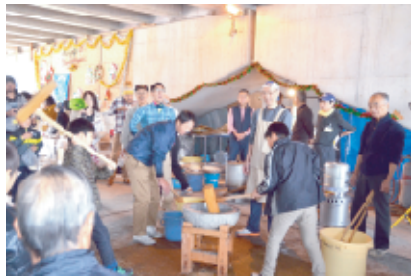
小学生も高学年になると力強いです