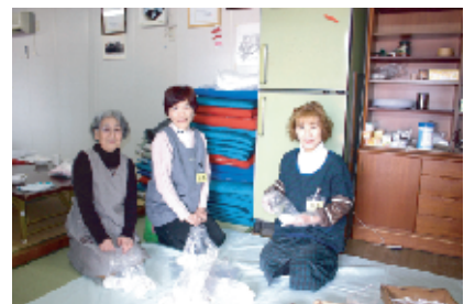
出来たての白餅4個と豆餅1個を1組にして、町内会の全戸に組幹事さんが配りました。