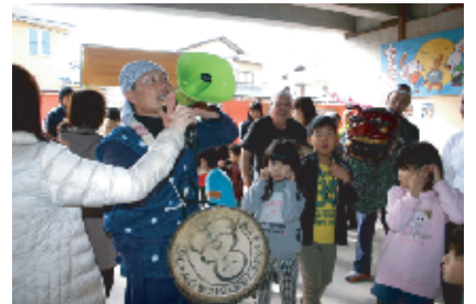
「備前笑顔の勢い神楽」の皆さん、楽しい獅子舞をありがとうございました。良い新年が迎えられそうですね。