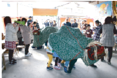
雄獅子と雌獅子のそろい踏み。子どもたちも獅子の中に入って、一緒に獅子舞。にぎやかな声があふれました。