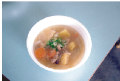
今年の豚汁は大きなサツマイモ入り