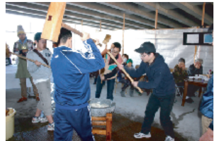
中高生男子4人はもはやベテランの域