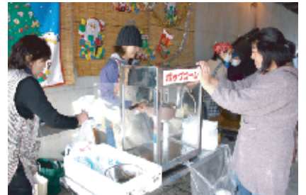
毎回人気のポップコーン。今年は早々になくなってしまいました。食べそねた人、ごめんなさい…(涙)