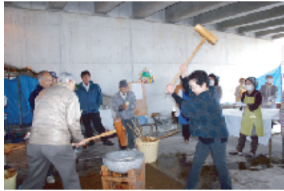
締めは横田会長ご夫妻。息はバッチリ