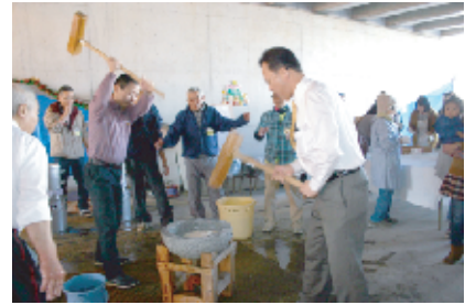
来賓の方々も参加してくださいました