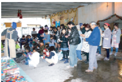
最後の楽しみは、恒例のビンゴゲーム。景品はどれをもらおうかな～