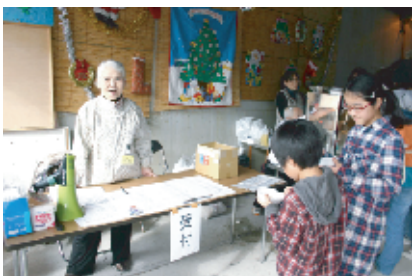
いらっしゃい♪受付はこちらです。組とお名前を覚えてね。手指の消毒も忘れずに。スタッフは名札を着けてね。