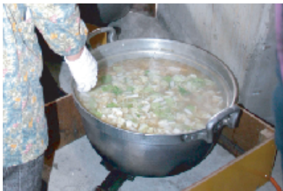
大きな鍋2つで作る豚汁