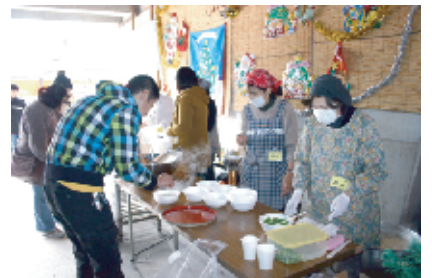
温かい豚汁をどうぞ！