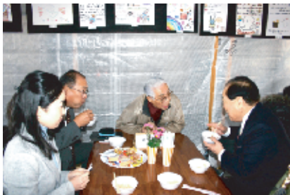
地元選出の国会議員も来場されました