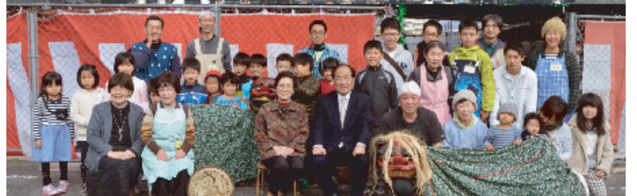
スタッフ、ゲスト、来賓、子どもたちで記念写真をパチリ