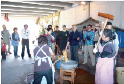
きねを振るう女性3人。輝いてます♪