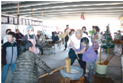
きねが重い～。小さい子には助っ人参上