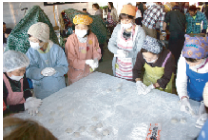
つき上がった餅はすぐに女性陣の手に渡り、冷めないうちに丸められて小餅に。今年は大勢の方がお手伝いに参加。