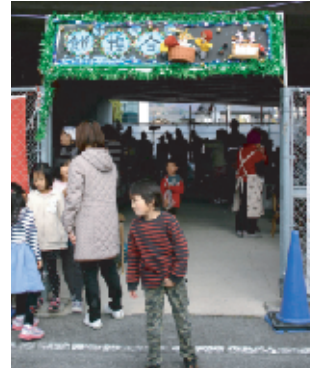
恒例の入場門。かわいい人形たちがペットタンペットタン餅つき。会場には大勢の人が集っています。