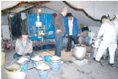
前々日の午後に洗って水に浸けておいたもち米を蒸します。程よい蒸し加減を見極めるのは、難しそう。