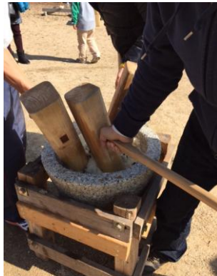
お父さんのチカラ!

岡山市区づくり推進事業の助成を受けおもちつきを行いました。今年も近隣の方々のご協力をいただき、6臼のお餅をつきました。初めて杵を持つ子どもたちもたくさん! 息をあわせて、ペタン、ペタン。最初と仕上げは、慣れた手つきのお父さん。気持ちの良いお天気に恵まれ、たくさんの人でにぎわいました。今年も、元気で楽しい一年でありますように!