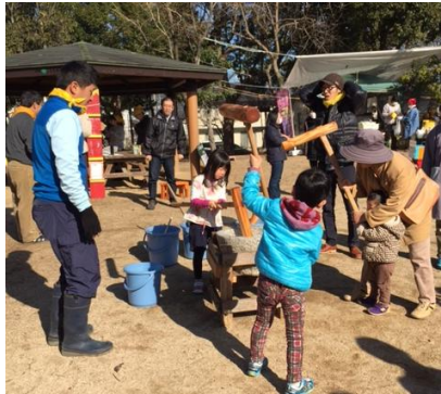
おばあちゃんと一緒に