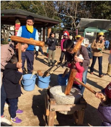
お父さんと一緒に