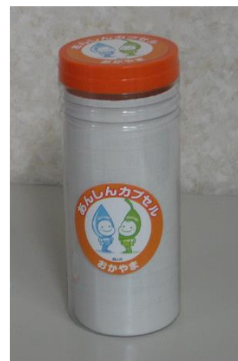
あんしんカプセルおかやま

ご本人様が病気やケガで倒れて、会話が出来ない状態になっていても、救急隊員や第一発見者がカプセルの情報を確認し、医療機関へ引き継いだり、緊急連絡先にある親族等との連絡がスムーズに行えます。