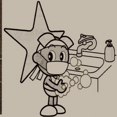
「岡山県マスコット ももっち」