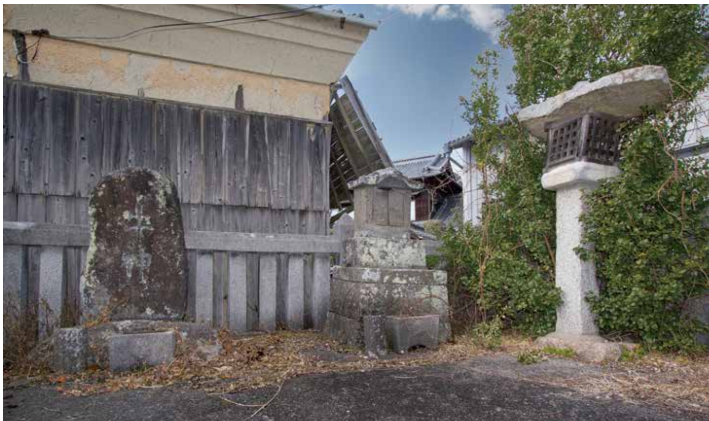
石灯笼の上部は倒壊している。平成23年1月撮影