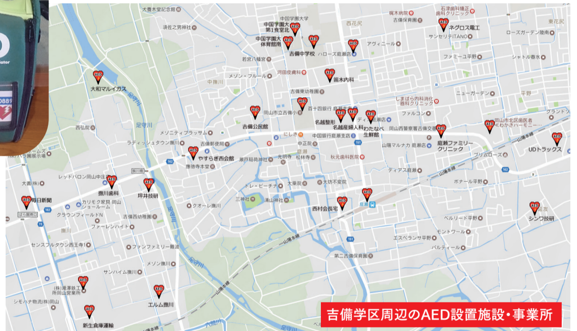
吉備学区周辺のAED設置施設・事業所