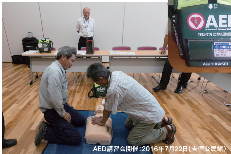
AED講習会開催:2016年7月22日(吉備公民館)