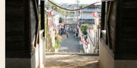
お宮さんからのカット。ここにたくさんの方が集まります。