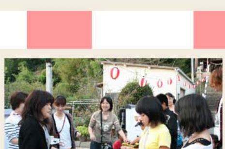
お目当ての物はあったかな？