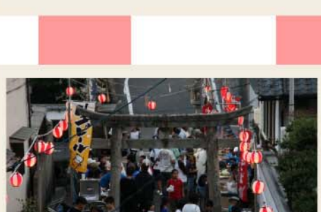
陽がくれ始めお祭りも終盤へと向かいます。