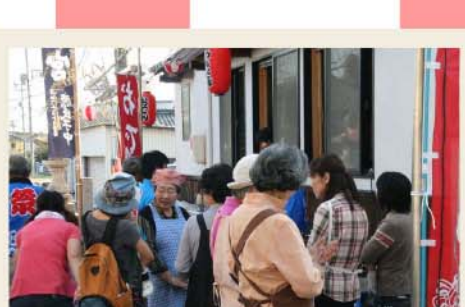
たくさんの方が手伝っていただきました。