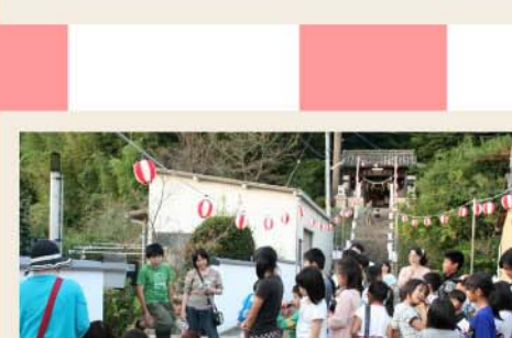
一番人気のくじです。