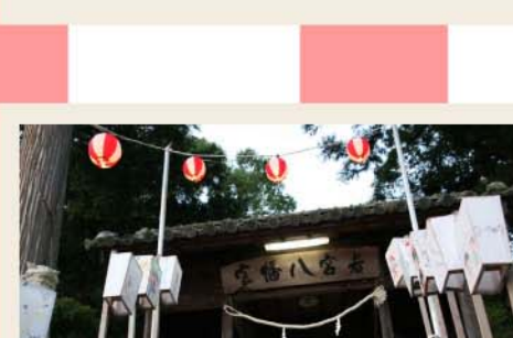
灯りがともりはじめました。