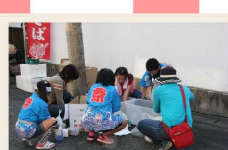
戻ってきた子ども達も手伝います。