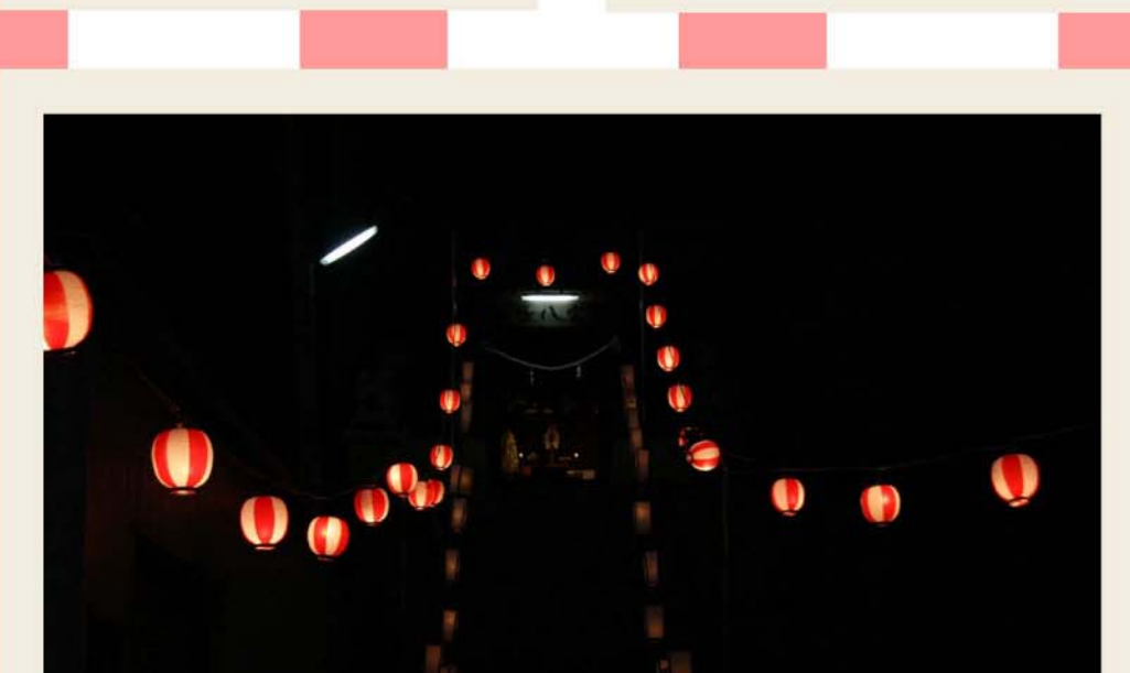
暗闇に浮かぶ提灯の灯りが、祭りの後を照らしています。来年もまたこの場所で、みんなであいましょう。