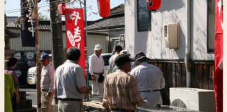
だんじりが戻ってくる間にお店の準備です。