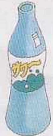
その他繰り返し 使えない飲料水 用のびん等