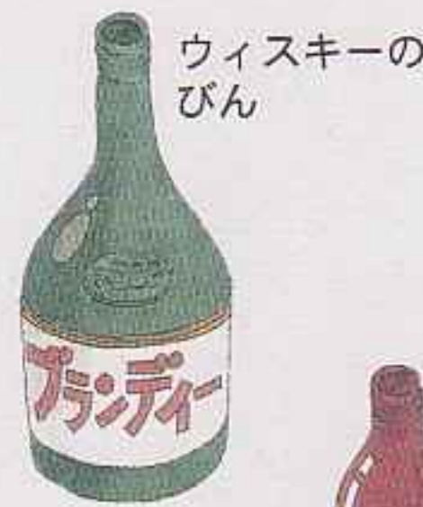
ウィスキーのびん