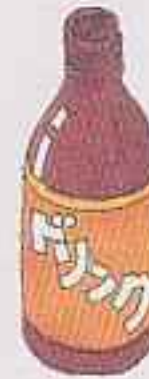
ドリンク剤 のびん