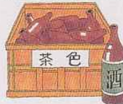
茶色のびんだけ 入れてください。