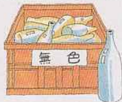
無色透明のびんだけ 入れてください。