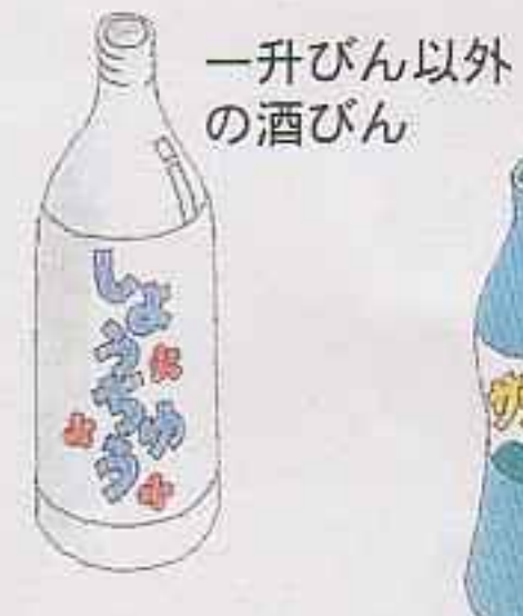
一升びん以外の酒びん