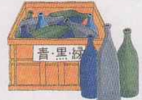
青・黒・緑等のびんを 入れてください。