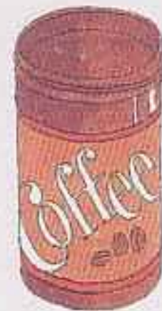
インスタント コーヒーのびん