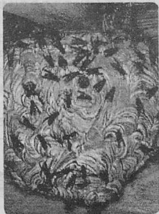
キイロスズメバチの巣

スズメバチは一年性のハチです。越冬した女王バチは初夏までに巣づくりし、働きバチを育てます。8月頃から巣は急速に大きくなり、人目につくようになります。晩夏から秋にかけては餌が不足し、攻撃的になります。秋に交尾が済んだ後、新しい女王バチは巣立って朽木の中などで越冬します。11月中頃以降になると、雄や働きバチは寒さのためすべて死亡し、冬には巣の中は空になります。