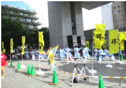
さん太ホールで行われたうらじゃ

夏の風物詩として定着していた「うらじゃ」は、コロナ禍の中、3年ぶりになる8月20・21日の2日間、うらじゃ踊り連や来場者の協力のもと、感染対策を徹底した中で、うらじゃ踊りが開催されました。