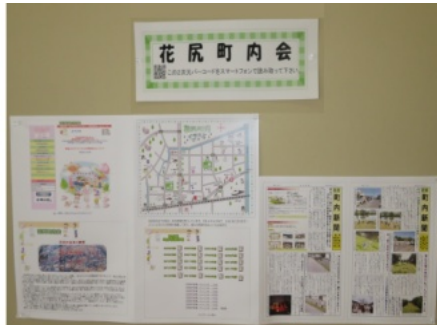
市役所ロビーに展示された花尻町内会のホームページの紹介