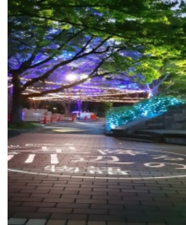
石山公園のイルミネーション