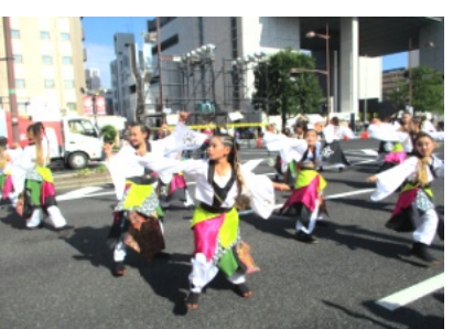
市役所筋のうらじゃ踊り

参加した踊り連や来場者は例年の半分程度でしたが、最後の総踊りでは多くの方が踊りを楽しんでいました。参加者からは「最高の思い出になった」との声だったとのこと。また、市役所筋の車道の