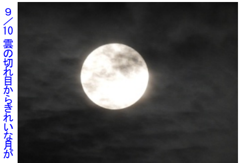
9/10 雲の切れ目がきれいな月が