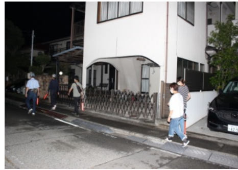
9/17 防犯パトロールの参加者