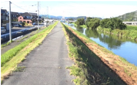
きれいに草が刈られた堤防の両側

9月4日(日)、午前7時30分より役員を始め有志の方々が35人が参加して笹ヶ瀬川堤防