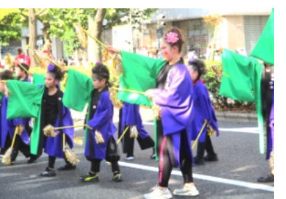
市役所筋のうらじゃ踊り

一部を観客ゾーンにするなどして、密を避け安全面を重視していました。8月20日の午後4時頃にさん太ホールで見学し、次に、市役所筋でうらじゃを見学し写真撮影をしました。3年ぶりということもあり、うらじゃ連の皆さんも楽しく踊っていました。