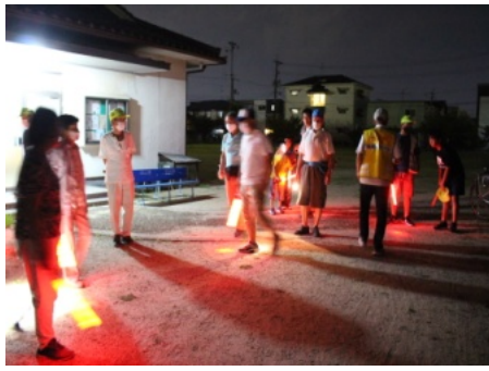
8/27 防犯パトロールの参加者

8月27日、担当はききょう町と編集委員会の17人が参加して9月17日は、みどり町と育成会の5人が参加