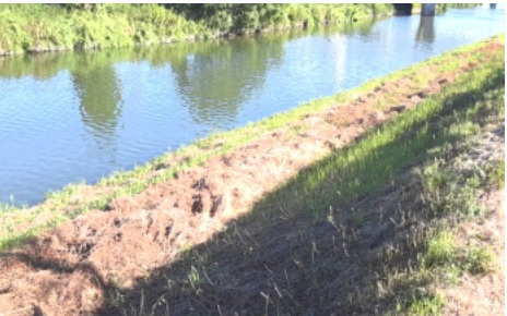
刈り取った草はそのままにして後日片付けます

参加された皆さん、早朝からご苦労様でした。10月16日(日)にも草刈りを行いますので、ご参加をよろしく願います。