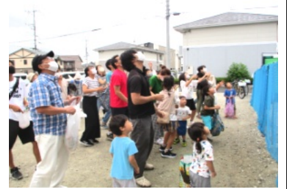
参加した人は拾うのに一生懸命

そもそも餅まきは、家になりにかかる災いを払うために行われていた儀式だと伝えられてきました。今も昔も、家を建てる・購入することは富の象徴です。ただその象徴には厄災がふりかかると考えられており、餅まきは、神様にお供之物(餅やお