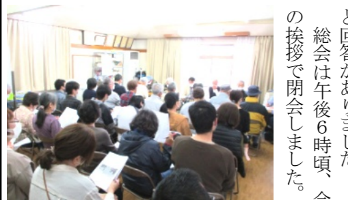
総会に参加した理事、各団体役員

【予備日6月25日(土)と11月12日(土)】【予備日11月26日(土)にした】「笹ヶ瀬川堤防の草刈りには班長にも声を掛ける」「町内新聞は経費削減から回覧にしたら」等々の意見や質問がありました。それに対し、町内会三役より「コピー機については新たに購入しない。必要なのは用紙を持って公民館でして欲しい」「町内新聞の回覧化については考えていない、今まで通りとしたい」と回答がありました。総会は午後6時頃、会長の挨拶で閉会しました。