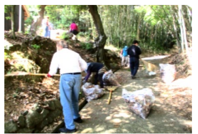
道路や溝に溜まった枯れ葉やごみを集めボランティアに入れる参加者

がありました。早速清掃に取り掛かり、お宮の境内や道路や側溝に溜まった枯葉やゴミを箒や熊手で寄せ集めて、ボラントイア袋に詰めていきました。また、付近の竹藪には枯れた竹も多くあり、鋸で切り取り、道の隅に片付けました。