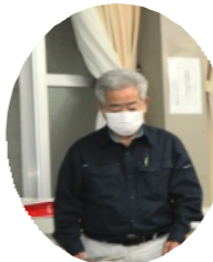
挨拶を行う河本コミュニティ協議会会長

学区コミュニティ協議会総会は4月22日(金)、午後7時よりコミュニティハウスにて約40人が参加して開催されました。