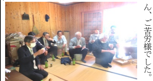
神事終了後、車座になり懇談を行う