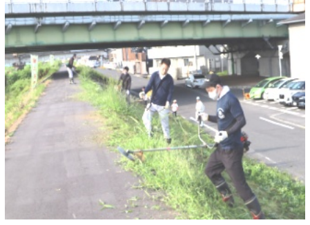
草刈りを行う参加者の皆さん

刈り取った草はポランティア袋に入れて軽トラに積み込み、ゴミステーションに運びました。