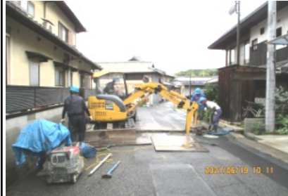
工事が進む配水管敷設現場

この度の工事は、今までの鉄管を強度が強く長持ちする配水管に取り替える工事です。これからの工事日程は、