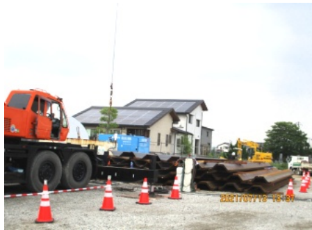
白石地区のポンプ場工事現場

量を想定して、「床上浸水」は「床下浸水」に、「床下浸水」は浸水被害がなくなると想定されています。2カ所のポンプ場は完成・共用開始を令和5年度(令和6年3月)として建設工事が行われています。今年の梅雨では、岡山市も大雨警報が発令されたものの大きな被害はありませんでしたが、これから台風シーズンを迎えます。豪雨災害から住民の命と