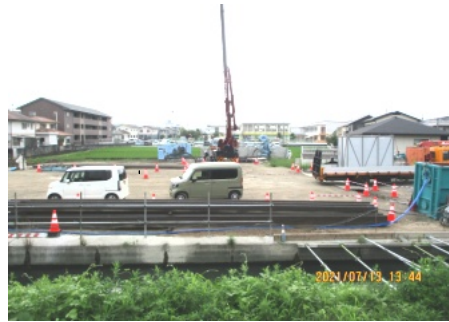
今保地区のポンプ場工事現場