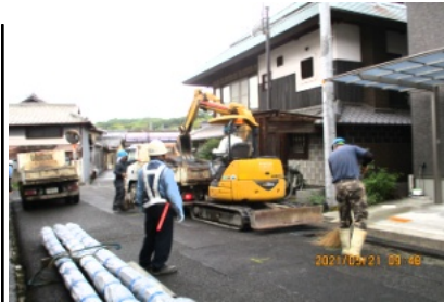
水道管理設の工事現場 左の管は埋設する管

4月から始まった配水管敷設工事(本町中・西、東花尻エリア)は4カ月が経ち、大詰めを迎えています。