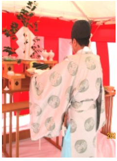
5月19日に行われた地鎮祭

この地区には尾上や白石、今保にポンプ場があるものの、排水量が少なく、内水氾濫が生じたものです。現在、建設中のポンプ場が完成すれば、3年前の雨