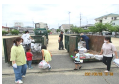
コンテナに積み込む参加者の皆さん

午前10時頃から育成会の役員の方が車で次々と資源化物をききよう公園に運び、新聞紙や雑誌は2台のコン