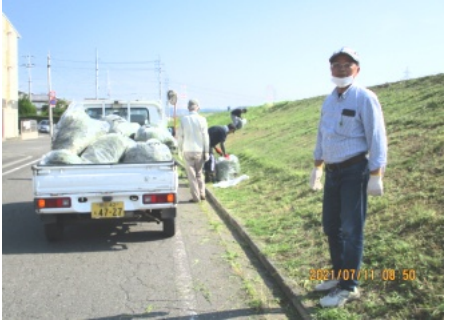
刈った草は軽トラに積みました

参加された皆さん、蒸し暑い中をご苦労様でした。作業は約2時間ほどで終了しました。