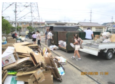
多くの資源化物が持ち込まれていました