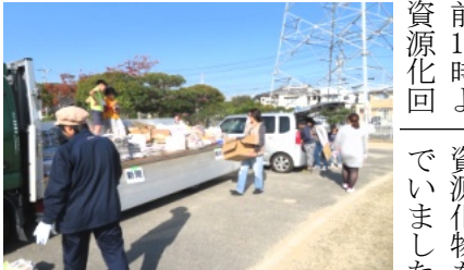
集められた資源化物はトラックへ

川堤防の刈った草やゴミ等を90リットのポランテイヤ袋に入れ、車に次々と積み込み、ききょう公園に運びました。この数はざっと350袋でいただいた皆さん、ご苦労様でした。また、用水にはゴミや藻が溜まっており、水の流れが悪くなり、この度も用水路に入り、藻を鋤簾や四つ目で掬い上げ、