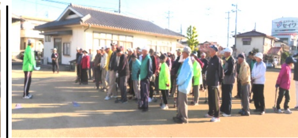
76人が参加したグラウンドゴルフ花尻大会(開会式)

11月6日(水)、陵南老クラブ主催のグラウンドゴルフ花尻大会が花尻ききよう公園で行われました。「ナイス」「おしい」と参加者76名が白熱の戦いが繰り広げられました。花尻大会は花尻親和会が、