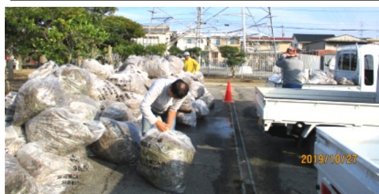
ききょう公園に次々とゴミが運び込まれました

川堤防の刈った草やゴミ等を90リットのポランテイヤ袋に入れ、車に次々と積み込み、ききょう公園に運びました。この数はざっと350袋でいただいた皆さん、ご苦労様でした。また、用水にはゴミや藻が溜まっており、水の流れが悪くなり、この度も用水路に入り、藻を鋤簾や四つ目で掬い上げ、