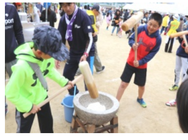
子ども達も元気に餅つき

きれいな音色の大正琴を皮切りに華やかな傘踊り、幼稚園児の鼓笛隊の演奏、児童クラブのけん玉競演、ドジョウすくい等が行われていました。