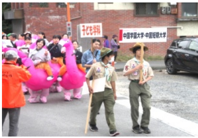
中国学園・短期大学の仮装パレード

吉備地区一帯をA〜Gまでの、7ゾーンに分けて開催され、大勢の人が訪れ大変な賑わいでした。午前10時に庭瀬駅を出発した吉備中学校の吹奏楽部や、仮装をした中国学園・中国短期大学の学生などの行進でオープンとなりました。民家やお寺、公民館、空き地、城趾、お堀、広場等々を利用して多くのイベントが行