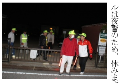
パトロールに出発する皆さん

子ども会育成会が今年度3回目の資源化回収物を行うつり今年度3回目の資源化回収を行いました。 朝9時頃から廃品回収の協力を町民に呼びかけ回りました。 10時頃にはトラックが公園に横付けされ、新聞紙や雑誌等の