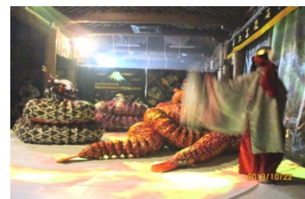
迫力満点だった八岐大蛇の神楽

執り行われました。 神社内では夜店やプロジェクションマッピングが大燈籠や随神門周辺に撮され、幻想的な景色でした。また、拜殿では午後7時より「即位礼を祝って祭祀」、続いて、日本遺産である「石見神楽」が演じられました。 約2時間程「岩戸」や「大蛇」「恵比須」の神楽が演じられ、迫力満点の演