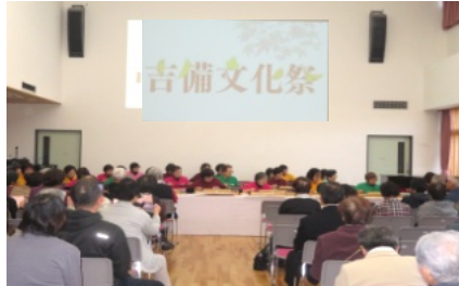
文化祭の会場 踊っているのは大正琴

11月16日(土)・17日(日)の両日、吉備公民館において「第51回吉備文化祭」が多くの来場者のもと、盛大に開催されました。 舞台発表では16講座(大正琴やうたごえ、詩吟、太極拳、謡曲など)の舞台発表が行われました。 また、公民館の廊下や1階と2階の部屋などには、撫川うちわやパッチワーク水墨画、書道、絵手紙、生