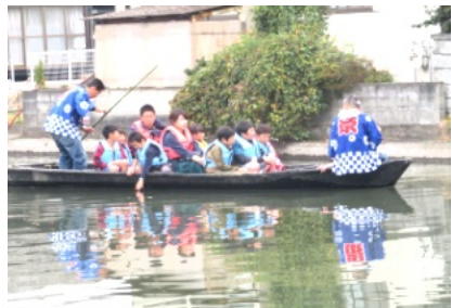
庭瀬城趾の堀では川舟乗りを楽しむ