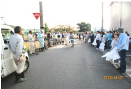
土木委員の説明を聞く清掃参加者

10月27日(日)、町民約750人が参加して「町内一斉清掃」を行いました。 一斉清掃の前日の夕方から土木委員の皆さん方で、清掃用具の割り振りなどの準備が行われました。 当日は、それぞれの集合場所が集まり、参加者の出欠確認を町内会役員の方が行い、土木委員の方から清掃について清掃方法の説明を聞き、早速清掃作業に取りかかりました。 また、1週間前に笹ヶ瀬