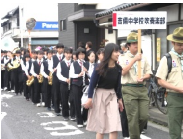
吉備中吹奏楽のオープニングパレード

晴天に恵まれた11月3日(日)、吉備・陵南まちかど博物館が、陣屋町として栄えた、