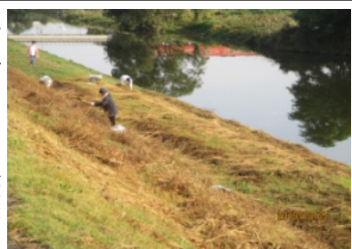
堤防の草を片付ける皆さん

土嚢袋に詰めていきました。 また、用排水路や道路、公園のごみや草なども袋に入れていきました。 ききょう公園に運び込ま