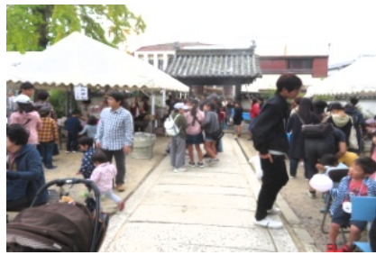
お寺の境内にも多くの屋台が並ぶ