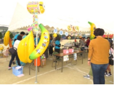
陵南小PTAのくじ引きが大人気

また、会場には、各団体や施設等々のテントが並び、新鮮な野菜や果物、つきたての餅のぜんざい、うどん、豚汁、揚げ物、餅やお米の販売、バルーンアート、くじ引き等々が並んでおり、訪れた皆さんは楽しみながら買い物や飲食を楽しんでいました。また、いきいき健康21も健康相談コーナーを設け、相談を行っていました。