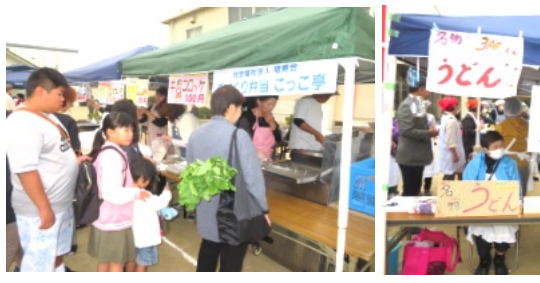
賑わった福祉団体の揚げ物店