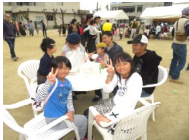
休憩所は多くの人で賑わう

また、会場には、各団体や施設等々のテントが並び、新鮮な野菜や果物、つきたての餅のぜんざい、うどん、豚汁、揚げ物、餅やお米の販売、バルーンアート、くじ引き等々が並んでおり、訪れた皆さんは楽しみながら買い物や飲食を楽しんでいました。また、いきいき健康21も健康相談コーナーを設け、相談を行っていました。