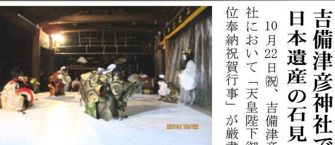
激しい動きの天の岩戸の神楽