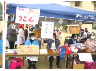
婦人会のうどんは盛況でした