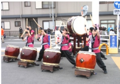
勇壮な太鼓の演奏も催しを盛り上げる