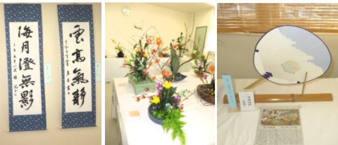
書道や生け花、撫川うちわを始め、多くの展示物が飾られていました

け花、折紙・手芸・作品等々が廊下や各冷やに展示されており、多くの方が訪れていました。