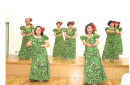
華麗な衣装で踊るフラダンス

11月16日(土)・17日(日)の両日、吉備公民館において「第51回吉備文化祭」が多くの来場者のもと、盛大に開催されました。 舞台発表では16講座(大正琴やうたごえ、詩吟、太極拳、謡曲など)の舞台発表が行われました。 また、公民館の廊下や1階と2階の部屋などには、撫川うちわやパッチワーク水墨画、書道、絵手紙、生