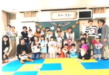
参加者全員での修王写真

10月21日(月)につぼみ会の活動を行いました。今回のテーマは、ハロウィンパーティー。お子さんたちは可愛らしく仮装して来てくれました。紙皿にオバケやこもり・かぼちゃのパールを貼ったり、絵を描いたりして個性豊かなリースが出来上がりました。次は、新聞紙で作ったキャンディ投げ。かぼちゃの箱に1つずつ投げたり、両手いっぱい抱えて一度に沢山投げたりと、とても楽しそうでした。最後はお待ちかねのお土産タイム。順番に並んで「トリック・オア・トリート」を宣言にお菓子が入った袋を貰って、みんなニコニコ笑顔で活動を終える事が出来ました。 【文章 山本百世会長】