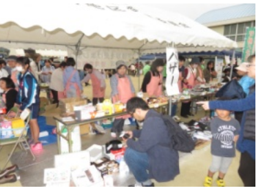
愛育委員会のバザーにも人集り

好天に恵まれた11月3日(日)、陵南小学校において、陵南フェスタ2019が盛大に開催されました。午前10時の開場前から多くの人が訪れ、開場を待っていました。開会式は、午前10時より行われました。引き続き、舞台では、