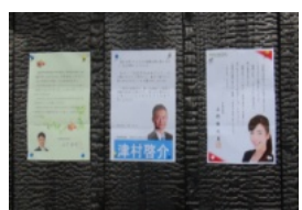
祝電・メッセージをお寄せいただいた方々