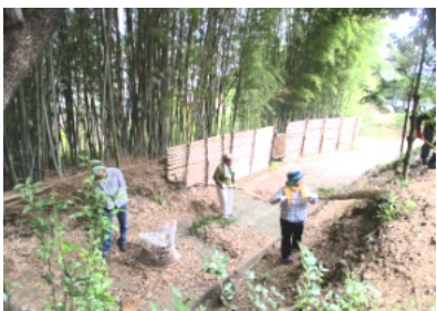
道路には枯れ葉や枯れ笹が一杯

午後2時頃には全ての作業が終わり、宮総代、町内会長からお礼の言葉があり、解散しました。