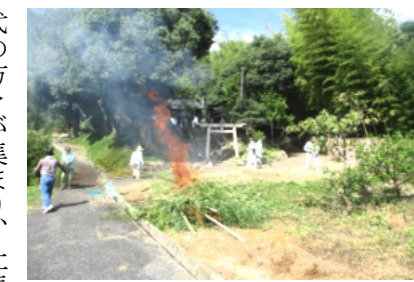
切った竹や樹木は焼却

また、道路や溝、境内の枯れ葉やゴミ、草などをほうきや熊手で集め、ボランテニア袋に詰めていき、ゴミ収集場へと運びました。