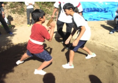
高学年男子はの相撲は迫力満点