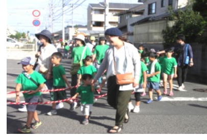
元気にだんじりを引く子ども達

台風19号の影響で、秋まつりの日程を変更。1日目の12日は神事のみとし、12日の行事を13日に行いました。その為、13日は朝からお宮で子ども相撲、綿菓子などの屋台も行いました。午後3時からはだんじり・みこしの行進、抽選会、その後、映画会を行い、夜店も大繁盛で、賑やかな一日でした。