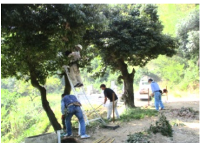
樹木の剪定をする宮総代の方々

花尻町内会ホームページ【 http://townweb.e-okayamacity.jp/hanajiri/ 】