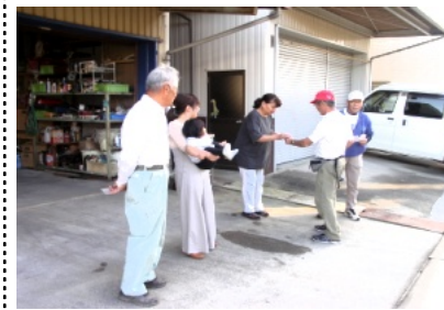
途中では多くの方の出迎え(みどり町)

約150人の参加のもと、出発しました。途中では多くの皆様にお出迎えと奉納金をいただき、その方には「富くじ券」、「饅頭」、「御神酒」を振る舞いました。