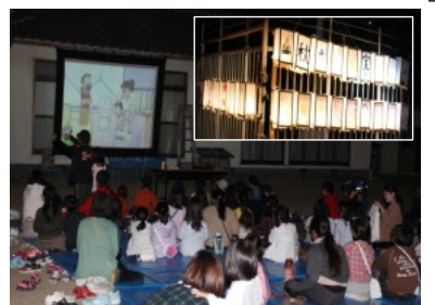
映画も好評! 会場に飾られた行灯

約25分で休憩場所のあかね公園に到着しました。公園では参加者にジュースが配られました。しばらく休憩したあと、午後3時40分頃に出発し、あかね町、ききよう町、み