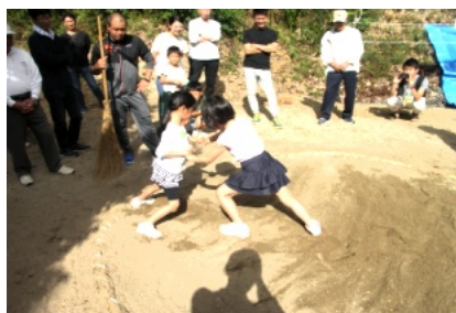
低学年の女の子も元気一杯

秋まつり2日目の10月13日(日)は台風一過の秋晴れの中、お宮で子ども相撲と綿菓子等の屋台(無料)を行いました。