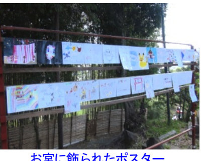
お宮に飾られたポスター