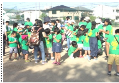
あかね公園で小休止を行う子ども達

約150人の参加のもと、出発しました。途中では多くの皆様にお出迎えと奉納金をいただき、その方には「富くじ券」、「饅頭」、「御神酒」を振る舞いました。