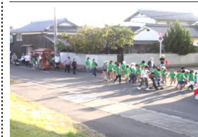
みどり町を行進するだんじり・みこし

どり町と周り、この地区でも多くの方のお出迎えがありました。午後5時頃にききよう公園に全員無事に到着し片付けと映画会の準備をし、その後、富くじの抽選会を行いました。