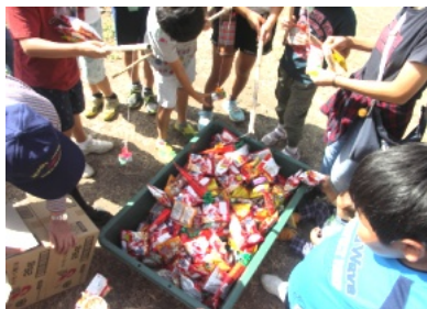
お菓子釣りは大人気、好きなお菓子は？

9月末とは思えない暑い日だった9月28日(土)、40人近い参加者でお宮の清掃を行いました。