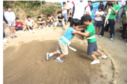
低学年男子の相撲に多くの声援