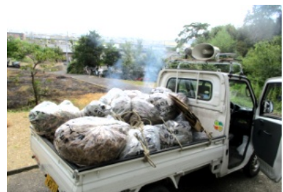
集まったゴミは90%ゴミ袋に15袋

午後2時頃には全ての作業が終わり、宮総代、町内会長からお礼の言葉があり、解散しました。