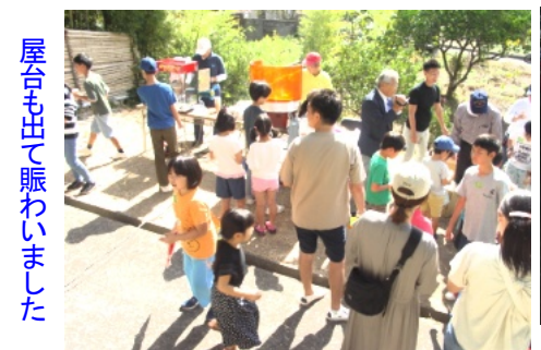
屋台も出て賑わいました