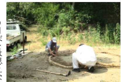
土俵作りを行う宮総代

9月末とは思えない暑い日だった9月28日(土)、40人近い参加者でお宮の清掃を行いました。