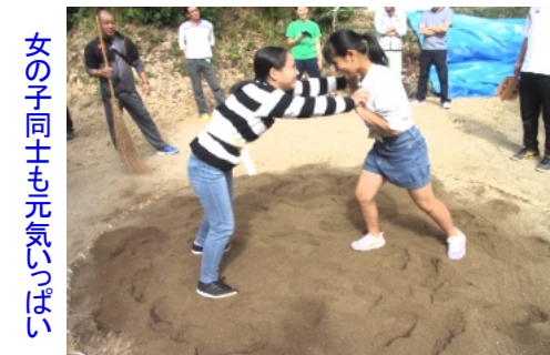
女の子同士も元気いっぱい