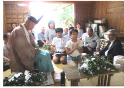
玉串奉納を行う子ども達

花尻町内会ホームページ【 http://townweb.e-okayamacity.jp/hanajiri/ 】