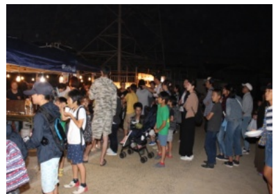
育成会、ソフトボール部の夜店は大繁盛!

きよう公園に集まり、だんじりやみこしの組み立て・飾り付けや夜店のためのテントの設置、椅子や机等の配置準備を行いました。