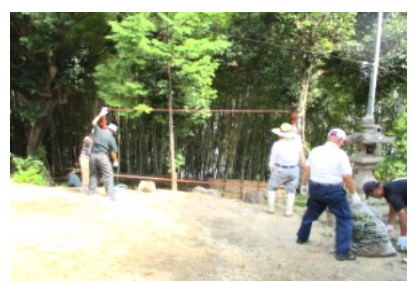
ポスター展示用枠の組み立て

また、道路や溝、境内の枯れ葉やゴミ、草などをほうきや熊手で集め、ボランテニア袋に詰めていき、ゴミ収集場へと運びました。