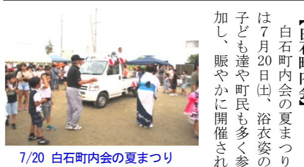
7/20 白石町内会の夏まつり