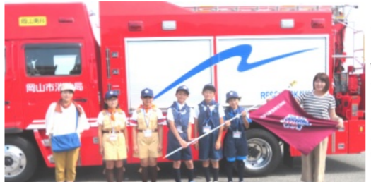
消防一日体験に参加した子ども5人と保護者2人

ラジオ体操が始まる6時30分前には、子ども達や保護者が次々と集まり、ラジオの声に合わせて、ラジオ体操第1・第2を行っていました。町内会としても子ども達と一緒に一時的に、老若男女が公園でラジオ体操を行っていました。