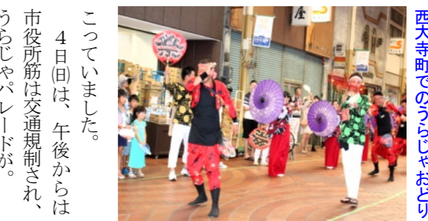
西大寺町でのうらじゃおどり