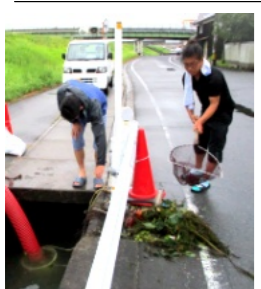
吸水管のゴミの除去作業

午後5時からポンプ設置の呼び掛けに、26人の方の参加があり、7月28日の試運転の要領で設置場所に運び、約1時間で設置は完了。試運転を行い、いつでも動かせるようにしました。