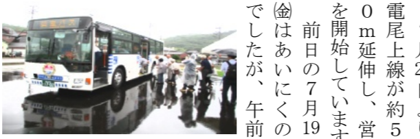
試乗を行う尾上町内会の皆さん

7月20日より岡電尾上線が約500m延伸し、営業を開始しています。前日の7月19日(金)はあいにくの雨でしたが、午前10時より新しく完成した新設バス停(回転場所)に於いて延伸記念セレモニーが会社関係者、地元住民、岡山市、議員などが参加して行われました。