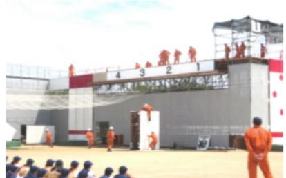
全国大会出場のレスキュー隊の訓練見学

花尻町内会ホームページ【 http://townweb.e-okayamacity.jp/hanajiri/ 】