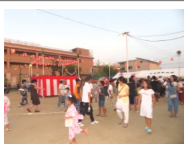
8/3 白石西町内会の夏まつり

また、夜店も多く出店されており、繁盛していました。白石西町内会【白石西町内会】白石西町内会の夏まつりは8月3日(日)、午後6時30分より白石西公園で開催されました。