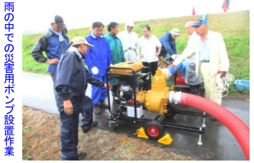
雨の中での災害用ポンプ設置作業