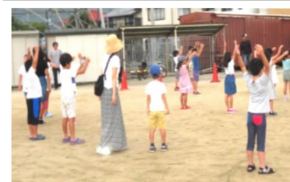
ききょう公園でラジオ体操を行う子ども達と保護者

その後は、8月25日に岡山で行われる全国消防救助技術大会に出場する救助隊の訓練の様子を見学させて行いました。