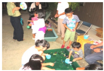
ヨーヨーやスーパーボールは大人気

午後7時過ぎからは「傳三郎太鼓」の演奏、勇壮なバチさばきや太鼓を叩きながらの機敏な踊りを披露し、大きな拍手が送られていました。