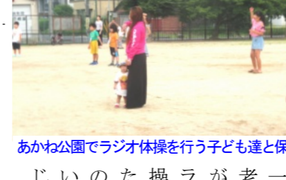
あかね公園でラジオ体操を行う子ども達と保護者

夏休み前・後半 子ども達は元気にラジオ体操 花尻子ども会は夏休みに入ってから1週間と夏休みの終わりの1週間、花尻ききょう公園とあかね公園でラジオ体操を行いました。