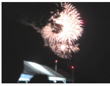
打ち上げ花火はきれいでした

天候に恵まれた8月2日(金)、備前一宮の吉備津彦神社に平安時代から伝わる県指定の重要無形民俗文化財の「御田植え祭(通称 お田植え)」が行われました。