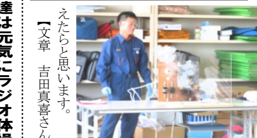
電気の火花で火災発生の実験

もらい、規律訓練や火災の原因を考えるカードゲームをしたり、起震車による地震体験、水の入った消火器を使った消火訓練、煙体験や心肺蘇生法を学びました。普段体験できないことばかりで、子どもたちも貴重な体験をたくさんさせてもらいました。学んだことを、毎日の生活にいかしてもらえたらと思います。