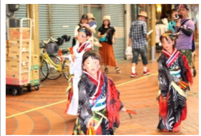
暑い中、子ども達も元気にうらじゃおどり

境内では「ヨーヨー釣り」「スーパーボールすくい」「かき氷」「フランクフルト」「飲み物」などの夜店もあり、多くの人で賑わっていました。