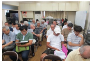
第2回合同役員会に43名の町内会・各団体役員が参加しました