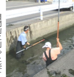
用水に入っでの清掃

1週間前に刈った笹ヶ瀬川堤防の草の回収作業に約50人が参加して行いました。その量は90リットルのボランテニア袋約400袋ありました。また、用水路の中に入って藻を掬い上げたり、岸から長い鉈で掬い上げ、その藻は土嚢袋に入れてトラックでききょう公園に運びました。また、公園にはその他にも