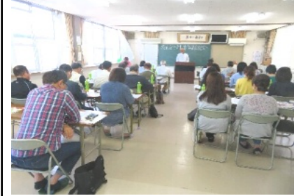
40名が参加した交対協総会

花尻町内会ホームページ http://townweb.e-okayamacity.jp/hanajiri/