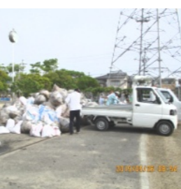
次々に軽トラで運び込まれるゴミ

瓦礫やヘッドロ、草や剪定した樹木などのごみが次々と運ばれました。集まったごみは、テキパキと土木委員さんの手で分別がされました。清掃作業は、約1時間半で終わりました。