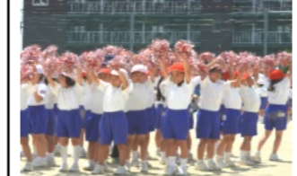
1・2年生による表現