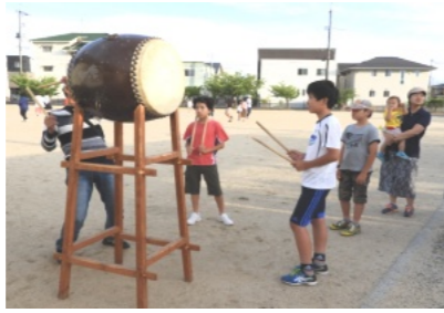
太鼓の練習を行う5人の男子児童

夏まつりまで後わずかととなりました。6月8日(土)より「銭太鼓」「うらじゃ踊り」「盆踊り」「太鼓」の練習を行う予定でしたが、「銭太鼓」は子どもの参加者が少なく、「うらじゃ踊り」は指導者の都合がつかず、「盆踊り」と「太鼓」のみの練習を行いました。6月15日(土)はあいにくの雨で練習は中止となりました。