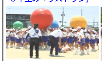
全員による大玉送り