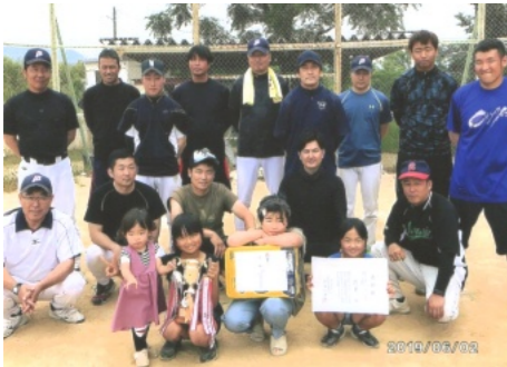
優勝を飾った花尻チーム

6月2日(日)、撫川グラウンドに於いて、第77回学区体協主催のソフトボール大会が行われました。花尻チームはAリーグ2チームと対戦しました。1回戦、グリーンハイツチームに4対3で勝ち、2回戦では東花尻チームに14対0で勝ち、優勝しました。