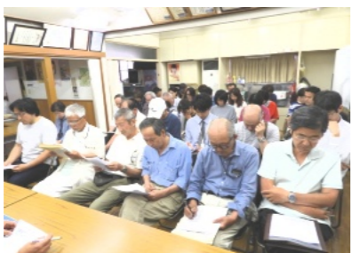
55人が出席した夏まつり実行委員会

第2回夏まつり実行委員会は6月8日(土)、午後7時より55人が出席して行われました。