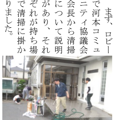
コミュニティハウス内外を清掃

6月16日(日)、10時より7町内会から24人が参加(花尻からは会長・副会長5人が参加)してコミュニティハウスの清掃を行いました。