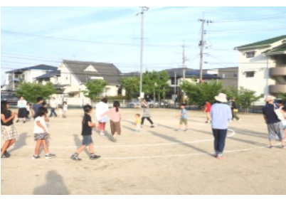
婦人部の指導で盆踊りの練習