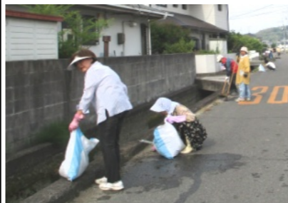
溝や道路を清掃する皆さん

合場所です土木委員や町内役員から清掃に関しての説明を聞き、出席確認を行い、早速、道路や用排水路、公園などの清掃に取りかかりました。