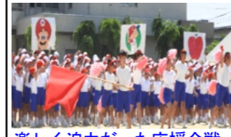
楽しく迫力だった応援合戦

たり組み体操したりで観客を楽しませました。 午後は2年生の競遊『いきピツタリ！やるぞ！大玉ころがし！』悪戦苦闘しながら3人で大玉を転がしていました。 次は3年生による競遊『台風の日』3人一組で棒を持ちコーンを回って、自分のチーム全員の下を通し、次の組にタッチするゲーム、コーンを回ると下を通過すのに苦労していました。 次は4年生の競争『一歩前進！挑戦者たち』力一杯の走りを見せていました。最後は5・6年生による表現『祝・我らの陵南小学校』素晴らしい踊りや組み