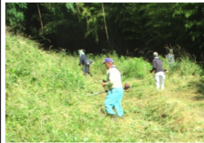
暑い中での草刈り作業 ご苦労様でした

尾上車山古墳は膝を超える夏草がびっしりと生い茂っており、参加者はエンジン音をとどろかせながら前方の平らな所から草刈りを始めました。途中休憩を行い、一息入られて再び草刈りを始めました。円墳部分は傾斜も多く大変な作業でしたが、約1