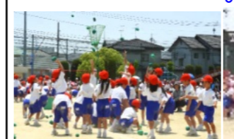
1年生による玉入れ