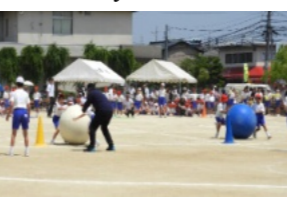
2年生による大玉転がし