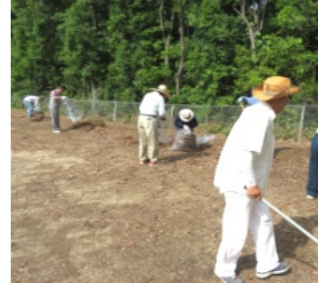
スポーツ広場を清掃する参加者の皆さん

6月9日(日)、午前9時より神道山スポーツ広場の清掃を行いました。この清掃は、学区の町内会・老人クラブ、そして尾上車山古墳の草刈りに参加された皆さん、お疲れ様でした。