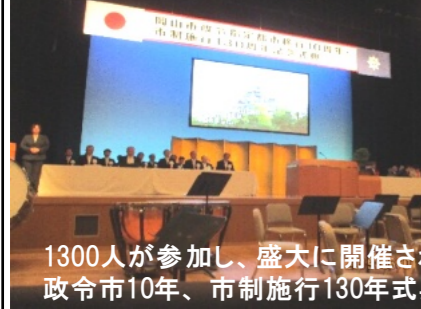
1300人が参加し、盛大に開催された政令市10年、市制施行130年式典

「ふるさと」を合奏し、会場を盛り上げたジュニアオーケストラの演奏と歌声は終わりました。