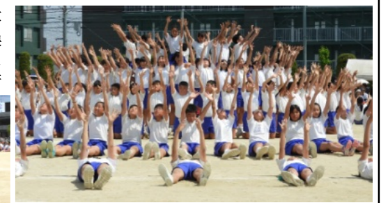
田植えの後に手足を洗う児童

夏間近を感じさせる暑さや日差しの中、陵南小5年生が田植え体験に挑戦しました。 はじめに、農業授業協力会の方から、作業の手順を教わりました。1回に植える苗の数は5〜6本ずつであることや、苗は土に丁寧に植え込むこと、引つ張っている田植え綱の赤い目印の手に植えること、次の苗を植えるために後ろに下がるときには、足跡を手でなぐらすことなど、それぞれの作業の意味も合わせて教わりました。 今回は靴下を履いての田植え体験でしたが、田んぼに足を踏み入れた子どもたちは、その感触に歓声をあげたり、なかなか足が抜けなくて苦労したりするなど、いろいろな表情を見せていました。 協力会の皆さんをはじめ、婦人会・交通安全母の会など地域各団体の皆さん、5年生保護者やPTA本部役員の皆さんからたくさんのご参加とご協力いただいたことにより、子どもたちにとって貴重な体験活動が今年も引き継がれたことに心より感謝いたします。 【文章 大森雅信校長先生】