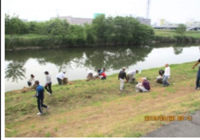
笹ヶ瀬川堤防の草の片付け

で、「一斉清掃参加のお願い」を広報車で約30分間、町内一円で参加の呼びかけを行って回りました。朝8時には、それぞれの集