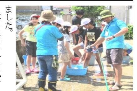
田植えの後に手足を洗う児童

夏間近を感じさせる暑さや日差しの中、陵南小5年生が田植え体験に挑戦しました。 はじめに、農業授業協力会の方から、作業の手順を教わりました。1回に植える苗の数は5〜6本ずつであることや、苗は土に丁寧に植え込むこと、引つ張っている田植え綱の赤い目印の手に植えること、次の苗を植えるために後ろに下がるときには、足跡を手でなぐらすことなど、それぞれの作業の意味も合わせて教わりました。 今回は靴下を履いての田植え体験でしたが、田んぼに足を踏み入れた子どもたちは、その感触に歓声をあげたり、なかなか足が抜けなくて苦労したりするなど、いろいろな表情を見せていました。 協力会の皆さんをはじめ、婦人会・交通安全母の会など地域各団体の皆さん、5年生保護者やPTA本部役員の皆さんからたくさんのご参加とご協力いただいたことにより、子どもたちにとって貴重な体験活動が今年も引き継がれたことに心より感謝いたします。 【文章 大森雅信校長先生】