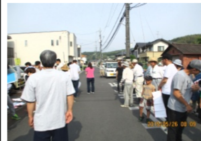
土木委員から作業の説明を聞く参加者

5月26日(日)町民約780人が参加して、町内一斉清掃を行いました。それに先立ち、朝7時20分頃から町内会長・副会長と