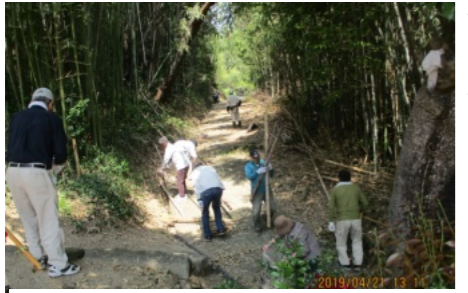
道路や側溝の掃除をする参加者

お宮にお参りいただいた皆さん、ご苦勞様でした。また、春まつりでは、宮総代の皆さんに、のぼり旗やお供えの準備、後片づけまで行っていたいただき、ありがとうございます。