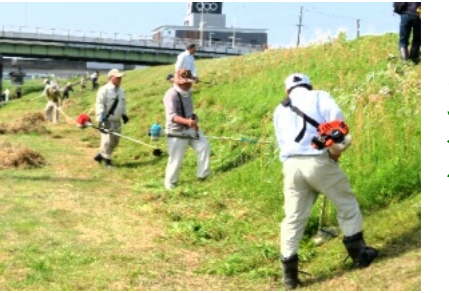
堤防斜面の草刈作業をする人(上)と刈った草を集め袋に入れる人(下)

5月19日(日)午前8時より町内会各団体役員約40人が参加し、笹ヶ瀬川堤防の草刈を行いました。午前8時前から次々と野花大橋高架下に集まりました。8時から参加された皆さんに専門会長より挨拶があり、それぞれ草刈りの作業に取りかかりました。