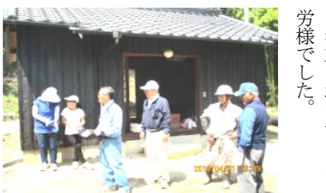
作業終了後、お礼を述べる普門会長