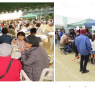
休憩所は多くの人で賑わう

や施設等々のテントが並び、新鮮な野菜や果物、つきたての餅のぜんざい、うどん、豚汁、揚げ物、餅や米、バルーンアート、くじ引き等々が並んでおり、訪れた皆さんは楽しみながら買い物や飲食を楽しんでいました。