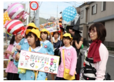
中国学園・短期大学の仮装パレード

晴天に恵まれた11月4日(日)、吉備・陵南まちかど博物館が、陣屋町として栄えた、吉備地区一帯をA〜Gまでの7ゾーンに分けて開催され、大勢の人が訪れ大変な賑わいでした。 午前10時に庭瀬駅を出発した吉備中学校の吹奏楽部や、仮装をした中国学園・中国短期大学の学生などの行進でオープンとなりました。