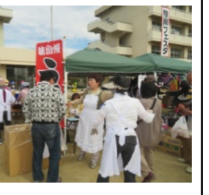
婦人会の皆さんによるうどんの販売

また、いきいき健康21も健康相談コーナーを設け、相談を行っていました。午後2時には全ての日程が終わりました。準備から片付けまで参加された関係団体の皆さん、お疲れ様でした。