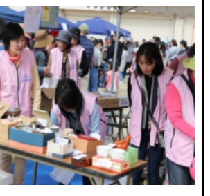
愛育委員会のバザー

や施設等々のテントが並び、新鮮な野菜や果物、つきたての餅のぜんざい、うどん、豚汁、揚げ物、餅や米、バルーンアート、くじ引き等々が並んでおり、訪れた皆さんは楽しみながら買い物や飲食を楽しんでいました。