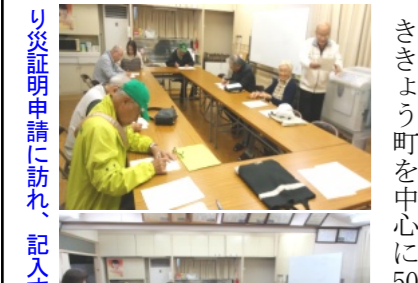
り災証明申請に訪れ、記入する皆さん

床下浸水「り災証明申請」を107人が行う 11月10日(土)と11月11日(日)の二日間、午後5時から午後8時まで町内集会所で「り災証明申請」の受付を行い、述べ107人が書類に記入しました。一日目は、あかね町、さきよう町を中心に50人