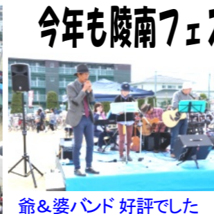
爺&婆バンド 好評でした