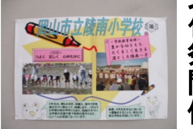
陵南小学校の展示物

今回の文化祭は、50回目の節目であり、舞台発表では16講座(大正琴やうたこえ、詩吟、太極拳、謡曲などの)の舞台発表が行われました。