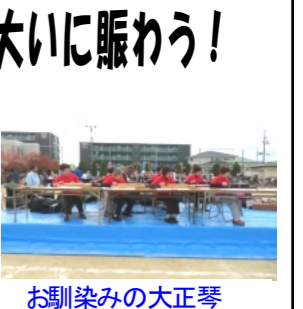
お馴染みの大正琴

好天に恵まれた11月4日(日)、陵南小学校において、陵南フェスタ2018が盛大に開催されました。午前10時の開場前から多くの人が訪れ、開場を待っていました。開場の合図に来場者が殺到しました。開会式は、午前10時より行われました。引き続き、舞台では、きれいな音色の大正琴を皮切りに華やかな傘踊り、幼稚園児の鼓笛隊の演奏、児童クラブのけん玉競演、陵南バンド爺&婆による演奏等が行われました。また、会場には、各団体