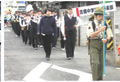
吉備吹奏楽によるオープニングパレード