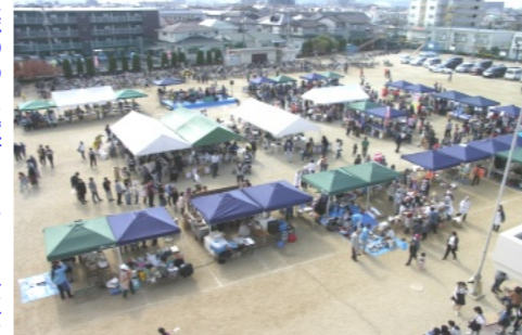
賑わった陵南フェスタ全景