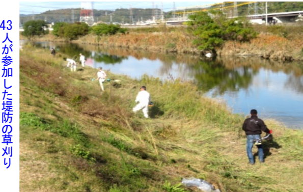
43人が参加した堤防の草刈り

43人が参加し、笹ヶ瀬川堤防の草刈りを行う 笹ヶ瀬川堤防の草刈りを10月21日(日)、午前8時より町内会・団体役員43人が参加して行いました。参加者は午前8時に、