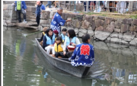
庭瀬城址の堀では川舟乗りを楽しむ