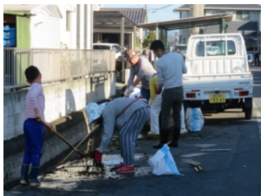
用水も丁寧に清掃を行いました