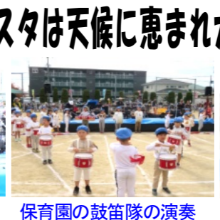
保育園の鼓笛隊の演奏