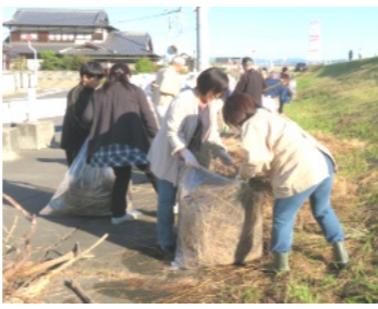
堤防の草を片付ける皆さん

1週間前に笹ヶ瀬川堤防で刈った草やゴミ、流木等を90リットル容量の袋に入れて車に次々と積み込み、ききょう公園に運びました。この数ざつと400袋でした。この作業に携わっていただいた皆さん、ご苦労様でした。また、用水にはゴミや藻が繁殖し水の流れが