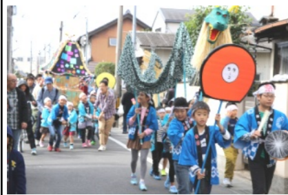
賑やかな子ども達のみこしの行進

晴天に恵まれた11月4日(日)、吉備・陵南まちかど博物館が、陣屋町として栄えた、吉備地区一帯をA〜Gまでの7ゾーンに分けて開催され、大勢の人が訪れ大変な賑わいでした。 午前10時に庭瀬駅を出発した吉備中学校の吹奏楽部や、仮装をした中国学園・中国短期大学の学生などの行進でオープンとなりました。