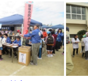
いきいき21の健康コーナー