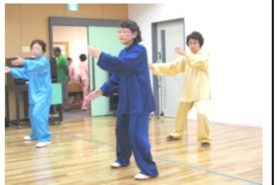
華麗な太極拳の演技

また、公民館の廊下や1・2階の部屋などには撫川うちわやパッチワーク、水墨画、絵手紙、生け花、折紙・手芸・工作品等々と今年度は