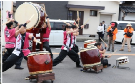
勇壮な太鼓の演奏も催しを盛り上げる