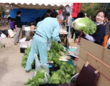
新鮮な野菜の販売 好評でした