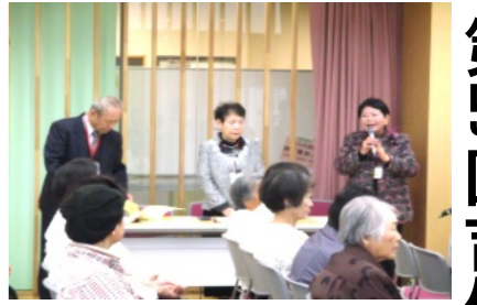
功績のあった3名の方に感謝状授与

11月17日(土)・18日(日)の両日、吉備公民館において「第50回吉備文化祭」が多くの来場者のもと、盛大に開催されました。