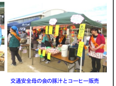
交通安全母の会の豚汁とコーヒー販売