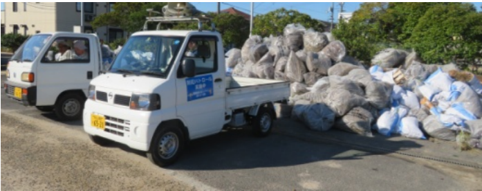
ききょう公園には軽トラで次々とゴミが運び込まれました