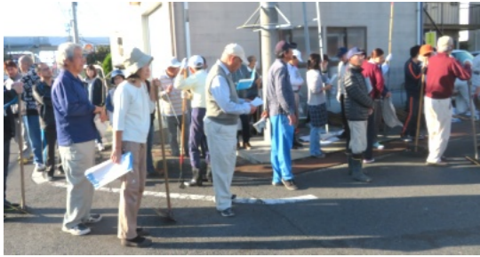
土木委員の説明を聞く一斉清掃参加者の皆さん

当日は、それぞれの集合場所が集まり、参加者の出欠確認を町内会役員の方が行い、土木委員の方から清掃についての説明を聞いた後、早速清掃作業に取りかかりました。