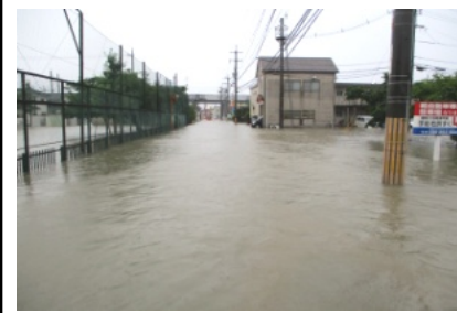
完全に冠水した道路(あかね町)