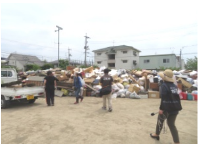
オニビジョンも取材に訪れる

7月9日(月)よりききょう公園に災害ゴミの搬入が始まる。町内会として7月9日(月)より岡山市と協議して花尻町内の災害ゴミの集積場としてききょう公園を決め、搬入を開始しました。