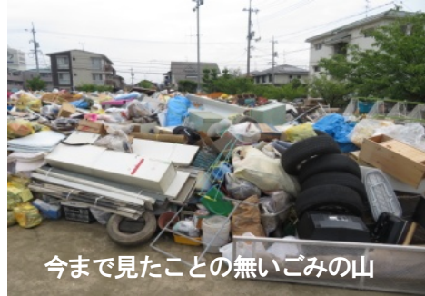
今まで見たことの無いごみの山

また、町内会有志で災害ゴミの回収班を設け、連日午後3時頃から町内を回り、多くのごみを回収し、町民から大変喜ばれました。