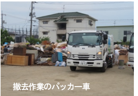
撤去作業のパッカー車