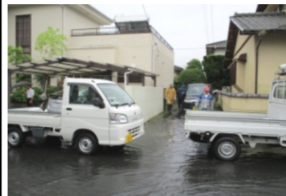
土嚢を配る皆さん(みどり町)