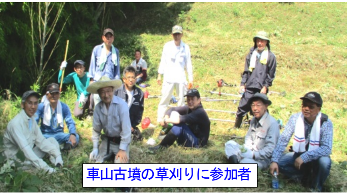
車山古墳の草刈りに参加者

かせ草刈りを始めました。草はかなり伸びており、蔓も絡んで刈りにくい所が多くありました。約40分ぐらいで後円墳の部分がおぼろけになりました。少し休憩を行い、円墳と北側面を始めました。特に円墳部分は背丈ぐらいに草が伸びていました。通路もきれいに刈り、約2時間で作業は終了しました。参加された皆さん暑い中ご苦労様でした。