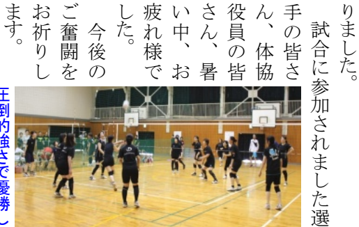
圧倒的強さで優勝した花尻チーム(手前)

7月1日(日)、陵南小学校体育館において8チームが参加し、体協主催のバレーボール大会(9人制)が開かれました。花尻チームはAブロックで出場して、1回戦は、白石西チームと対戦し、接戦になったものの2対0で勝ち、続く平野ハイツチームと対戦し、この試合も2対0で1セットも落とさず、他チームを寄せ付けない圧倒的な強さで連続優勝を飾りました。