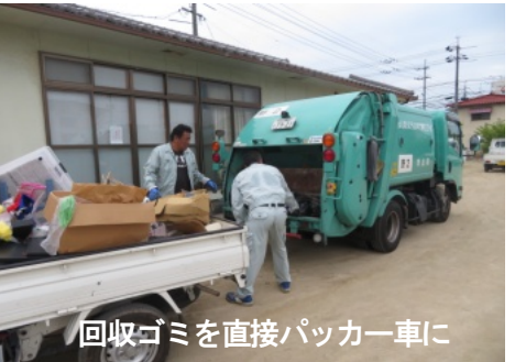
回収ゴミを直接パッカー車に

岡山市の災害ゴミの撤去作業は9月12日(木)から始まり、多い日には15台ものパッカー車が来て、次々と車に積み込んでいきました。さすが、ゴミ収集のプロで手際よく積み込み、ゴミの山も少なくなってきました。7月21日(土)には搬入、撤去作業は終了しました。暑い中、お疲れ様でした。