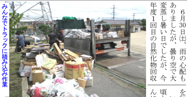
みんなでトラックに積み込み作業

6月30日(出)、雨の心配もありましたが、曇り空で大変蒸し暑い日でしたが、今年度1回目の自然化物回収を行いました。