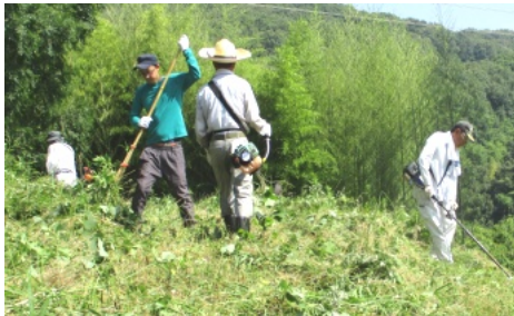
草刈りを行う参加者の皆さん

6月24日(日)、大変蒸し暑い日でしたが、午前8時過ぎより13名が参加し、車山古墳の草刈りを行いました。それぞれが午前8時にお宮に集合し、参加者にお茶が配られ、草刈り機を担ぎ、燃料を持ち車山古墳に登りました。早速、エンジン音を響