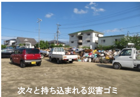
次々と持ち込まれる災害ゴミ

7月9日(月)よりききょう公園に災害ゴミの搬入が始まる。町内会として7月9日(月)より岡山市と協議して花尻町内の災害ゴミの集積場としてききょう公園を決め、搬入を開始しました。