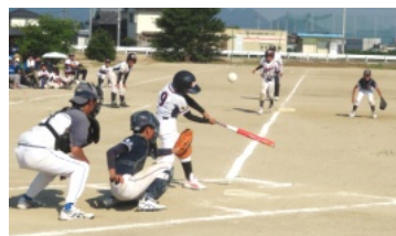
熱戦を制した白石A・Bチーム