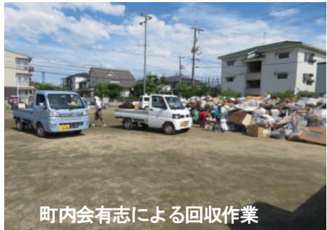
町内会有志による回収作業