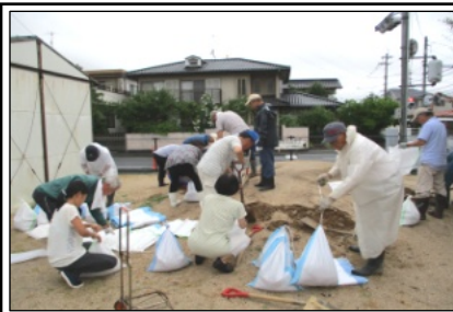
土嚢作りを行う皆さん(ききょう町)

町内会としては、7日の午後3時頃から土嚢を作ることを決め、広報車で土嚢作りへの参加を呼びかけました。土嚢作りには約30人の参加がありました。