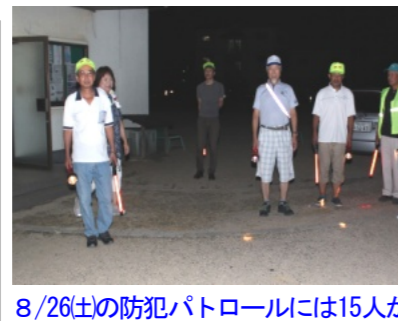
8/26(土)の防犯パトロールには15人が参加

ききょう町・編集委員会15人が参加し防犯パトロールを行いました 8月26日(土)、ききょう町・編集委員会15人参加して防犯パトロールを行いました。(9月16日(土)は雨のため中止しました) 8月26日は蒸し暑い夜約30分程で町内を一巡しました。 皆さんの中で、不審者や不審な車を見た場合は西警察署に通報をお願いします。また、火災も増えています。火の始末は必ずして下さい。なお、今回は10月21日(土)、担当は本町役員と育成会役員の皆さんです。よろしくお願ひします。