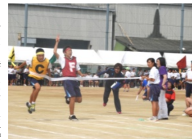
迫力があつたスエーデンリレー

いました。15番、最後の種目は3年によるダンス、「うらじゃ」奇抜な衣装で踊り、アンコールに応え、全学年で踊りました。