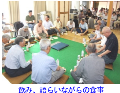
飲み、語らいながらの食事