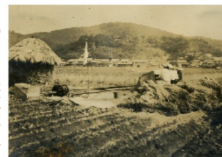
昭和30年代の脱穀風景。現在の白石西新町4-1-104付近から花尻方面を撮影したものです。