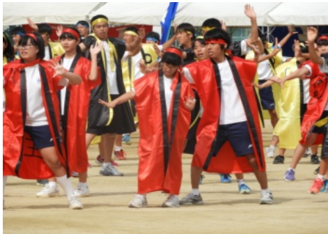
奇抜な衣装でうらじゃを踊る3年