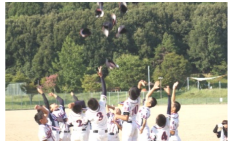
県大会2位となり帽子を投げて喜ぶ選手達