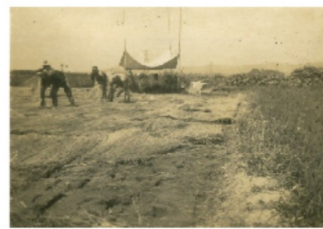
昭和30年代前半のイ草刈りの風景。場所は白石鉄工南付近で、まだ市道はありません。