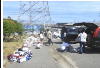
次々と持ち込まれる資源化物

9月9日(日)、花尻子ども会が今年度2回目の資源化物の回収を行いました。 いつものように、午前9時頃から広報車で町民に協力をお願いして回りました。 午前10時頃から車や自転車、次々と資源化物が、ききよう公園に持ち込まれ、新聞紙や雑誌・空き缶・古布・ダンボール等に分けられました。 10時10分頃には大型トラックが到着し、トラックに、