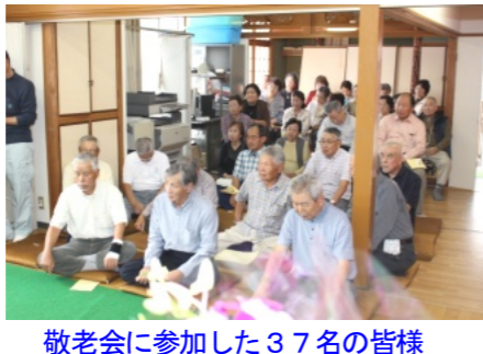
敬老会に参加した37名の皆様