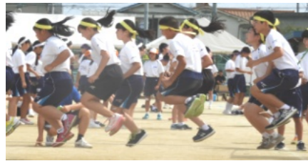
長縄飛び 最高は161回でした(3分間)

グラウンドコンディショニングのため一日順延となった9月14日(木)、吉備中学校体育祭は開催されました。午前9時寄りの開会式に続き、演技に移りました。演技2番の「頭の体操」では吉備・陵南小学校長、吉田吉備中学校長より問題が出され、それぞれのクラスが〇×出心していました。3番と4番は1・2・3学年による100mと200m競争、力強い走りを見せていました。5番は2学年種目、4人一組で騎馬組んでのリレー、6番目は1学年による長縄跳び、3分間の跳んだ回数で争われ、最高は87回でした。7番目