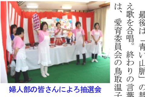
婦人部の皆さんによる抽選会