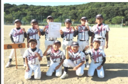
賞状を持ちメダルを掛けて記念撮影

予選はリーグ戦にて行われ、白石0対0馬屋下一乗寺、白石8対0宗蓮寺という結果にて、1位通過で決勝トーナメントへ。くじ引きで、準決勝は陵南平野と対戦。打てば守られ、打たれば守りと、お互い譲らない試合を展開。しかし少しのミスで、白石1対2陵南平野で敗れ、3位決定戦