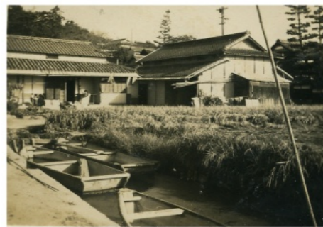
昭和20年代の境目川。その頃は多くの川舟があり、川では洗い物などもしていました。

花尻町内の40年ぐらゐ前は山沿い（本町）に民家が約60戸ぐらゐと一所（現在のみどり町）に10戸ぐらゐでありました。現在の花尻町内の戸数は1000軒を超え、40年前には考えられないような発展をしています。