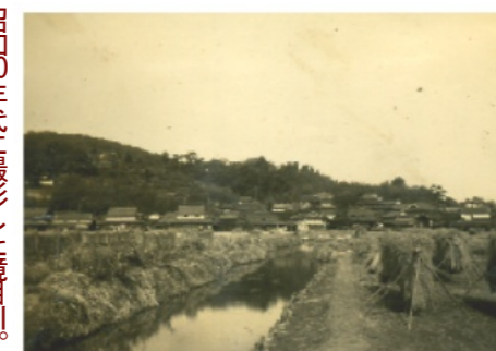
昭和10年代に撮影した境目川。現在の白石西新町の「みステーション」あたりからの写真