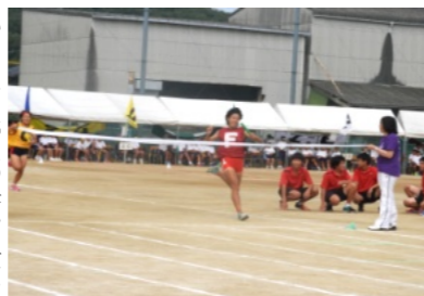
部対抗リレー 陸上部が強さ発揮(女子)

でも吹奏楽部の演奏をしながらの行進は素晴らしいものでした。続いては運動部による本気リレー、女子陸上部は圧倒しました、男子は1位となれませんでした。13番は1年全員による玉入れが行われました。14番は男女混合スエーデンリレー、2・1・3年の順で行われ、クラス代表が走り、迫力あると共に大声援が起こって