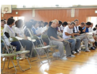
防災教室に参加された皆さん

自分の命は自分で守れ。誰も助けてくれない。二つ目は自分の命を守るためには何をしなければならぬか。南海トラフ地震は必ずやってくる。地震保険には入っていた方が良い。家の中の安全チェックをしる。部屋には家具を置くな。家具が凶器となる。家族との連絡方法を打ち合わせておく。安全装具を備えておく。特に断水に備え水を備えておく。学校は防災訓練を行っている。避難するには『押さない。走るな。戻すな』が必要。ガスボンベを準備しておく。自主防災組織をつくる。防災のキーワード