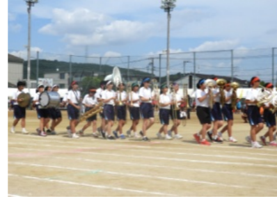
部対抗リレーで演奏する吹奏楽部

新聞や雑誌等を子ども達も手伝い積み込みを行いました。次にパッカー車が到着し、ダンボールが積み込まれました。続いて、3台目のトラックが到着し、空き缶や古布が積み込まれて、11時頃には、全ての積み込みが終わりました。 参加された保護者の皆さん、ご協力を頂いた皆様、ありがとうございました。