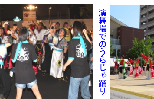
演舞場でのうらじゃ踊り