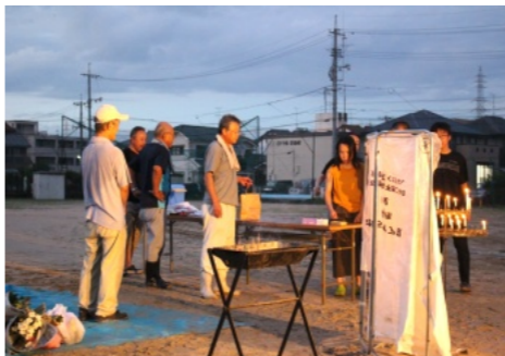
精霊送りに訪れた方々

受付で受け取ったお供え物は町内会役員の皆さんで次々とポランティオ袋に入れられ、シートに並べていきました。 午後8時にはあかね公園に岡山市のごみ収集車のパッカー車が到着し、積み込みを始めました。 午後8時過ぎには精霊送りの片付けは終わりました。ご苦労様でした。