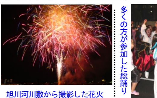
旭川河川敷から撮影した花火