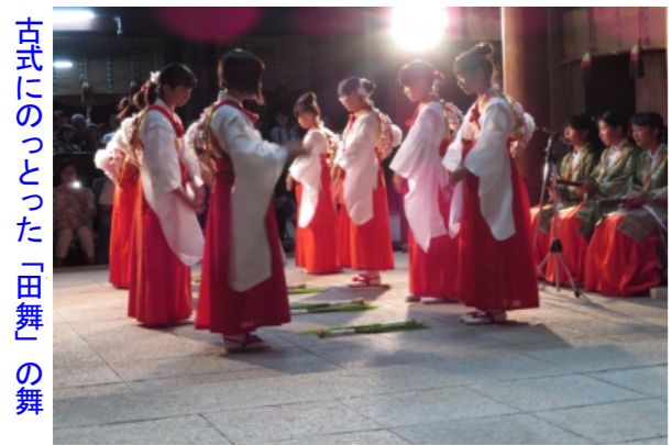
古式にのっとった「田舞」の舞

の皆さんが出席し、拝殿で厳かに儀式が約1時間行われました。その中で、小学校の女子生徒による古式にのっとった「田舞」(田植えの様子現した舞)が奉納されました。古式豊かな舞に参拝に訪れた方々もじっと見入りました。続いて、「御斗代」神事では、地元の中学生や氏子