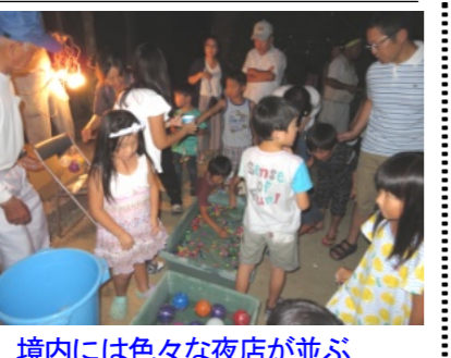
境内には色々な夜店が並び

午後7時半過ぎからは「早島町 い草太鼓」の演奏、勇壮なバチさばきや太鼓を叩きながらの機敏な踊りを披露し、大きな拍手が送られていました。続いての銭太鼓は、揃いの衣装で素晴らしい演技を披露していました。また、子ども達の作った