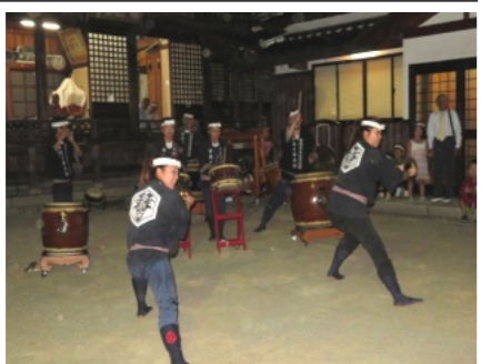
早島い草太鼓も祭りを盛り上げ