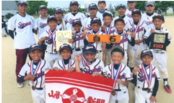
3位入賞を成し遂げた白石・花尻チームの選手と指導者

う快挙を成し遂げ、次の8月27日(日)に行われる県大会出場権を獲得しました。 暑さの中、子ども達の粘り、強い気持ちがこの結果を生んでくれました。とても誇らしい子ども達でした。