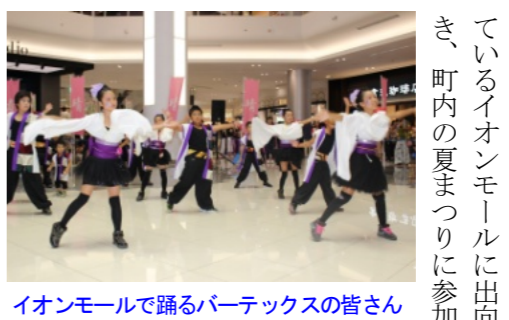
イオンモールで踊るパーテックスの皆さん

「おかやま桃太郎まつり」「うらじゃ踊り」に6500人暑さにも負けず 華麗な踊りを披露した「パーテックス」を見に、6日は市内の演舞場にいきました。大変暑い中でしたが、踊る人も見る人も大きな歓声を上げながら楽しんでいました。中でもメイン会場の市役所筋には次々と大音響の車と踊り連が通り、沿道を埋めた多くの見物人が大きな歓声と拍手が起こっていました。午後8時より市役所筋で総踊りが行われました。一般参加者も踊り連の輪に入り、一緒に踊り、踊りの輪は熱気に包まれ、夏の夜を楽しんでいました。