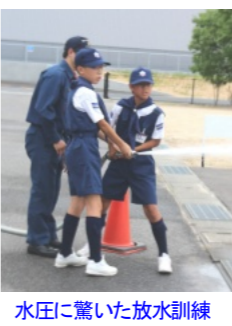
水田に驚いた放水訓練