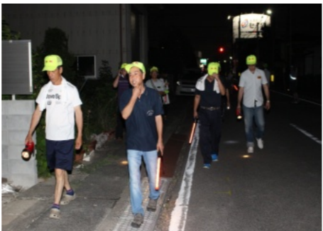
7/30の防犯パトロール

7・8月の防犯パトロールは、7月22日(土)は雨のため中止、7月29日(土)はききよう町役員と編集委員会20人が参加、8月5