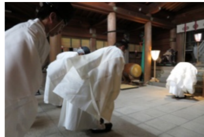
厳粛に執り行われた神事

8月2日(水)備前一宮の吉備津彦神社に平安時代から伝わる県指定の重要無形民俗文化財の「御田植祭(おたうえまつり)」が行われました。南北の道路や境内には多くの夜店が並び、大変な賑