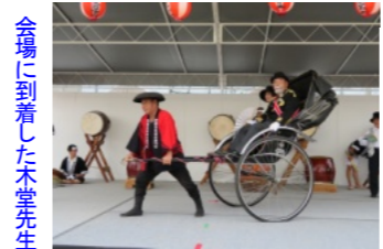
会場に到着した木堂先生