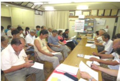
45人が出席した第2回合同役員会

☆日時 9月18日(祝) 10時30分 受付 11時 開会式 ☆場所 町内集会所 ☆主催 町内会 ☆共催 婦人部・親和会 ☆参加資格年齢