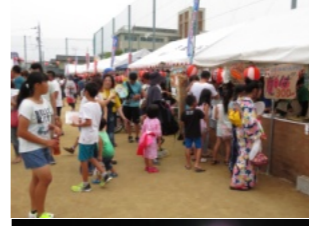
夜店も大変な賑わい 多くの人が踊りの輪に