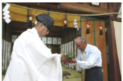
田井宮司より玉串を受け取る上田総代

の皆さんが出席し、拝殿で厳かに儀式が約1時間行われました。その中で、小学校の女子生徒による古式にのっとった「田舞」(田植えの様子現した舞)が奉納されました。古式豊かな舞に参拝に訪れた方々もじっと見入りました。続いて、「御斗代」神事では、地元の中学生や氏子