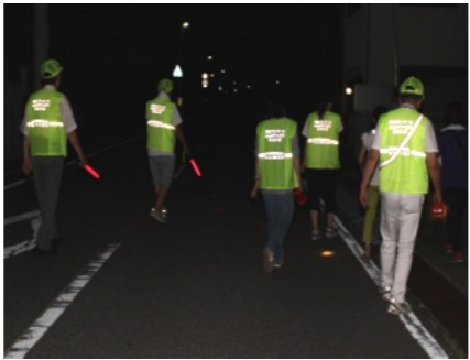
8/19の防犯パトロール

日(土)はみどり町役員と消防、体協7人が参加、8月12日(土)は本町役員と育成会10人が参加、8月19日(土)はあかね町役員とソフ指導者で8人が参加し、7・8月の延べ参加人数は45人でした。 いずれの日も大変暑い日でしたが、参加された皆さんは元気に町内を回りました。特に公園や高架下などは念入りに見て回りましたが、別に何もありませんでした。 もし、不審者や不審な車、公園などで迷惑行為を見かけた場合は西警察署(254-0110)まで通報して下さい。 なお、次回は9月16日(土)、担当はみどり町と体協、消防の皆様です。よろしくお願いいたします。