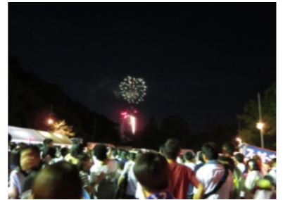
大勢の参拝者で賑わう御田植え祭

8月2日(水)備前一宮の吉備津彦神社に平安時代から伝わる県指定の重要無形民俗文化財の「御田植祭(おたうえまつり)」が行われました。南北の道路や境内には多くの夜店が並び、大変な賑