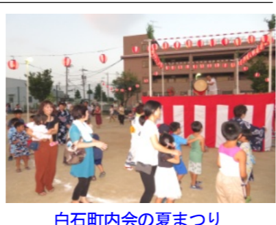
白石町内会の夏まつり