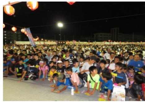
富くじ抽選会には多くの人波が

夜店も多数出店され、大いに賑わっていました。午後8時過ぎより抽選会が始まり、会場は人で埋まり、当選番号を読み上げられる毎に盛り上がりました。