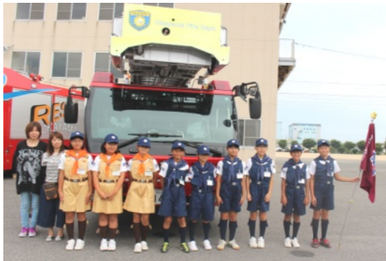
消防一日体験に参加した子ども達

暑い中でしたが、有意義な時間を過ごす7月27日(木)、少年消防クラブ消防一日体験が桑野の消防訓練センターで、6団体、約33人が参加(花尻は