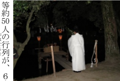
鶴島における「御斗代」神事

わいをみせていました。また、今年も午後8時頃から西辛川地内(線路の南)から約500発の花火が打ち上げられ、お田植えに訪れた人たちもきれいな花火に見入っていました。午後9時から守安宮司