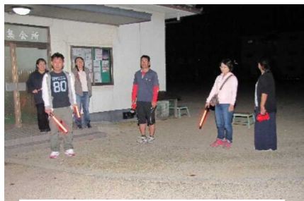
7人が参加した10月の防犯パトロール

防犯パトロールに7人が参加しました 10月17日、あかね町役員とソフト指導者7人が参加して防犯パトロールを行いました。 夜はめっき肌寒くなりましたが、いつものように午後8時より一組で 町内を回り、町民に防犯を訴えて回りました。約40分で二巡しました。ご苦労様でした。 来月は11月19日の第3土曜日、担当はききょう町役員と編集委員会の皆さんです。お願いします。