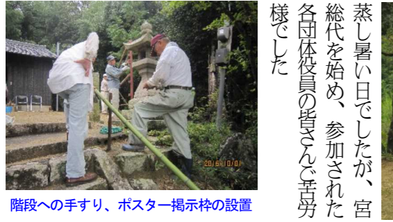
階段への手すり、ポスター掲示枠の設置

ここで一区切りし、普門町内会長より、お礼の挨拶があり参加者にはお茶が配られました。引き続き、土俵作り、ポスター掲示用の枠の組み立て、石段へ手すりの設置等を宮総代、町内会役員で行いました。当日は雨模様で、