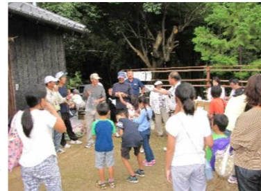
お宮の行事 盛会だった抽選会

午後5時半頃には夜店目当ての子も選がききょう公園に次々と訪れ、公園で遊んだり、子ども会やソフトボール指導者、