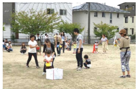
親子で楽しんだつぼみ会のうんどうかい

10月4日、つぼみ会が、アンパンマンのサンサンうんどうかいを開催しました。お天気にも恵まれ、予定通り花尻ききょう町公園で行うことができ、たくさんのお供達が参加しました。 親子で準備体操を行い、玉入れ、かけっこ、ハイハイトンネルやフラフープを使った障害物競走、最後には子供達お待ちかねのお菓子取り競走など、親子で「運動の秋」を楽しみました。 お手伝いをしてくださった愛育委員 民生委員の皆様、ありがとうございました。 【文章 高田郁里会長】