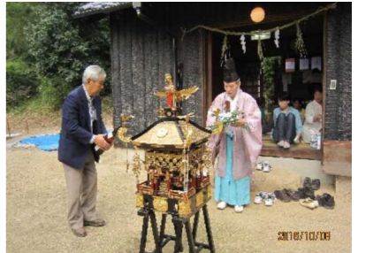
御輿のお祓いを行う宮司さん