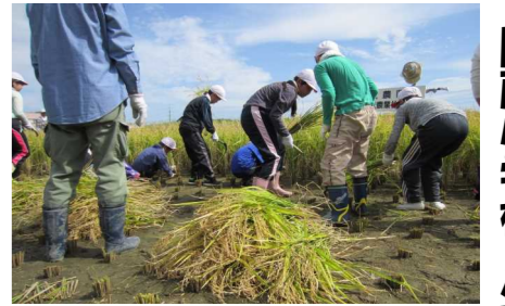
地元やPTAの方の指導で稲刈りを行う