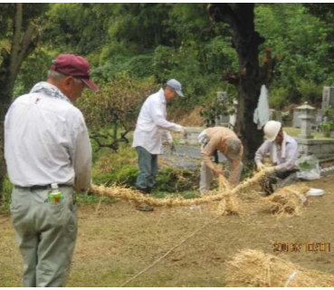
蒸し暑い日でしたが、宮総代を始め、参加された各団体役員の方々がご苦労様でした

その後、道路や側溝、境内に溜まった枯れ葉や草、ごみ等を集めてポラントニア袋に入れていきました。また、拜殿・本殿の拭き掃除も行いました。お宮の清掃は午後7時頃には終わり、樹木やゴミはききょう公園のごみステーションに運びました。