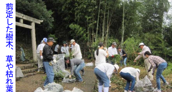
剪定した樹木、草や枯れ葉は袋に

ここで一区切りし、普門町内会長より、お礼の挨拶があり参加者にはお茶が配られました。引き続き、土俵作り、ポスター掲示用の枠の組み立て、石段へ手すりの設置等を宮総代、町内会役員で行いました。当日は雨模様で、