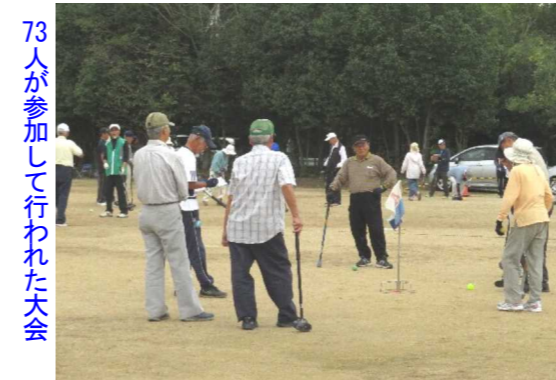
73人が参加して行われた大会

親子で楽しんだつぼみ会のうんどうかい 親子で「運動の秋」を楽しみました。お手伝いをしてくださった愛育委員 民生委員の皆様、ありがとうございました。 【文章 高田郁里会長】