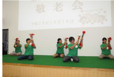
銭太鼓を披露した花尻の子ども達

防犯パトロールに7人が参加しました 10月17日、あかね町役員とソフト指導者7人が参加して防犯パトロールを行いました。 夜はめっき肌寒くなりましたが、いつものように午後8時より一組で 町内を回り、町民に防犯を訴えて回りました。約40分で二巡しました。ご苦労様でした。 来月は11月19日の第3土曜日、担当はききょう町役員と編集委員会の皆さんです。お願いします。