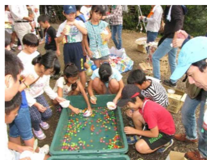
お宮では出店が好評

また、お宮下の空き地には所狭しとポップコーンやお菓子釣り、ボールすくいなどが全て無料で、子ども達は大喜びでした。子ども相撲が終わってからは富くじの抽選会に入りました。町内会役員がくじを引き、当たり番号が読み上げられ、次々と賞品が当たっていきま