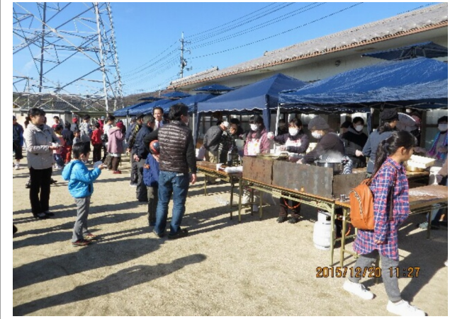
天候にも恵まれ260人が参加した花尻フェスタ会場

餅つきを体験 ぜんざいやたい焼きの味は格別でした 花尻フェスタ(餅つき大会)は好天に恵まれた12月20日(日)、花尻ききょう公園で開催しました。午前9時頃より編集委員会と各団体役員でガスコンロや風よけの設置、機の配置、集会所内部や屋外の机では餅もみの台を設置しました。 また、ぜんざいやきな粉餅(お代わり自由 無料)の他にも、たい焼きさわらび苑に依頼 一個50円