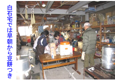
白石宅では早朝から豆餅つき

11月22日(日)に第33回山陽新聞社杯学区対抗6年生選抜ソフトボール大会が行われ、今年は吉備の子どもを迎えて『陵南・吉備チーム』として14名で参加しました。 予選リーグVS高島・竜之口、宇野三敷と2戦2勝し、決勝トーナメントへと駒を進めました。 負けたら終わりの決勝トーナメント。まず、平福と戦い、両者守備が固く、点が入らなかったが、最終回表で、陵南・吉備チームは1打席目にホームランを打ち、その流れで4点を奪い準決勝へ。 準決勝は興隆と戦い、こちらも点が入らず、厳しい試合。しかし、運はこちらに傾いてく