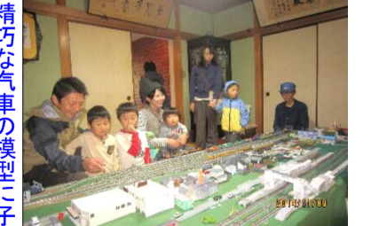
精巧な汽車の模型に子ども達も興味津々(右川船での遊覧を行う予定だった庭瀬城の堀