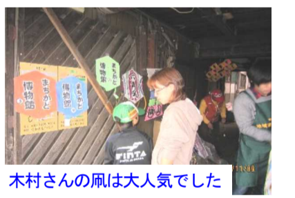
木村さんの風は大人気でした