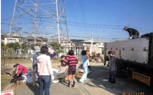
トラックの積み込みを手伝う子ども達

花尻子ども会は晴天に恵まれた11月22日(土)、3回目の資源回収を行いました。 いつものように、午前9時頃から広報車で町民に「資源化物」の協力をお願いして回りました。