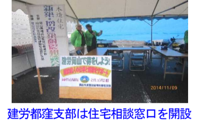
建勞都窪支部は住宅相談窓口を開設