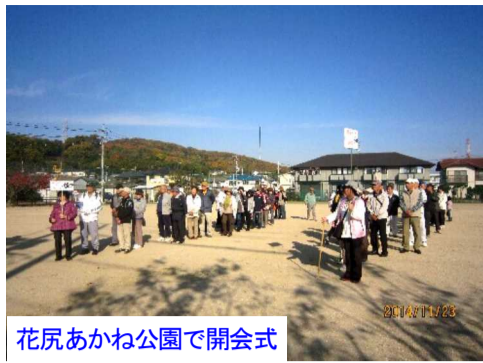
花尻あかね公園で開会式