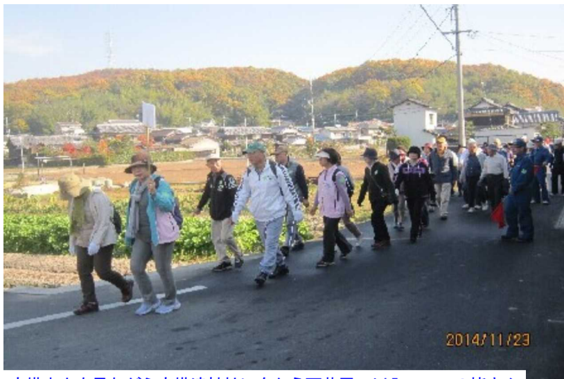
吉備中山を見ながら吉備津神社に向かう西花尻・川入コースの皆さん

好天に恵まれた11月23日(日)、陵南区愛育委員会主催の「健康ウォーク」が開催され、約1500人の参加がありました。