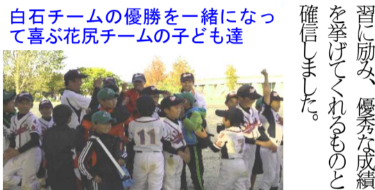
白石チームの優勝を一緒に喜んで花尻チームの子ども達

追いつけられ、結果、引き分けとなりました。予選リーグは1勝1分けて決勝トーナメントに進出し、準決勝の相手は吉備学区の中田チームとの対戦。終盤まで1対1の同点、最終回に1点を入れ劇的なサヨナラゲームでした。 決勝の相手は強豪の陵南平野チームとの対戦。連投の疲れか、前半から得点を許し、その後も得点を加えられ、惜しくも敗れましたが、堂々の準優勝でした。