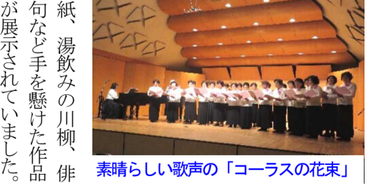
素晴らしい歌声の「コーラスの花束」 湯飲みにかかれた川柳(右)とハワイアンキルト