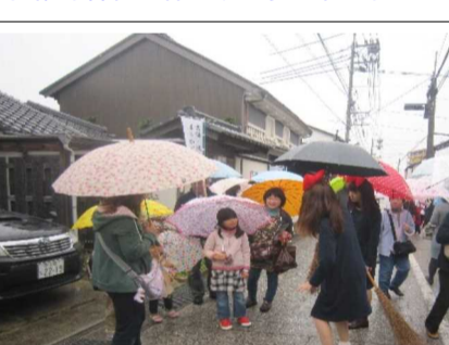
吉備津神社で休憩する参加者の皆さん

吉備津神社では愛育委員会下のお茶とパンが用意されており、一人ひとりに手渡していました。