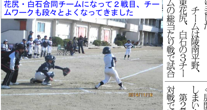
花尻・白石合同チームになって2戦目、チームワークも段々とよくなりました

11月6日(日)、陵南小学校においてオータムカップ(学区新人戦)が行われました。花尻チームは白石チームと合同チームとなり第2戦目の公式戦となりました。 チームは陵南平野、東花尻、白石の3チームの総当たり戦で試合