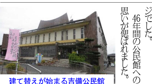
建て替えが始まる吉備公民館