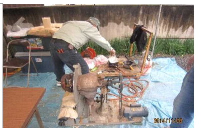
歴史が漂うパン菓子機(右)と多くの人で賑わう雑貨を扱う店