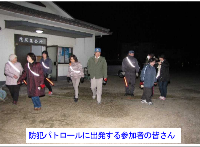
防犯パトロールに出発する参加者の皆さん

11月15日(土)、午後8時よりみどり町・消防・体協役員10人が参加し、防犯パトロールを行いました。 参加者を2つの班に分け、みどり町役員を中心としたグループはみどり町方面に、体協・消防の方は本町・あかね方面を回りました。 途中、コンビニや公園などは念入りに巡視しました。また、不審な車なども見回りましたが、別に異常はありませんでした。 約40分で町内を一巡しました。