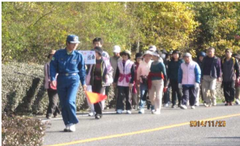
御陵に向かう神道山・御陵コースの皆さん

当日は、11月下旬とは思えない汗ばむほどの温かい陽気の中をお互いにしゃべり、色づいた紅葉を見ながら歩きました。