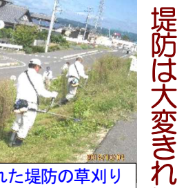
暑い中、行われた堤防の草刈り

10月19日(日)、午前8時より雨の中、秋の「町内一斉清掃」を町民約800人が参加して行いました。 それぞれの集合場所が集まり、参加者の出欠確認や土木委員から清掃についての説明を聞いた後、早速清掃に取りかかりました。 笹ヶ瀬川堤防の刈った草、用水路のヘドロやゴミ、川の藻、道路や公園の草やゴミ、公園の剪定した樹木等をまとめて袋詰めしたり、直接車に積み込み集積場のききょう公園に運びました。 ききょう公園に運び込まれた色んなゴミは、土木委員の指示で次々と指定された場所に降ろされました。 約2時間で作業は終わりました。