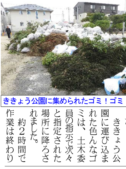
堤防の草の後片付けは大変でした