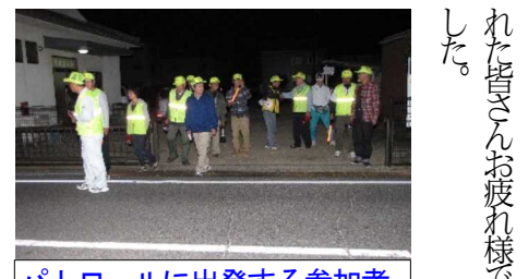
パトロールに出発する参加者

いつものようにハンドマイクで町民に「戸締まりや不審者情報」等を町民に訴えながらのパトロールでしたが、この度も変わったことはありません。 防犯パトロールに14人が参加 10月の防犯パトロールは18日(土)にききょう公園に運びました。約40分防犯パトロールは終わりました。肌寒い中、参加された皆さんお疲れ様でした。