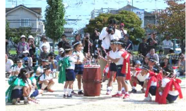
素晴らしい祭りだワッショイ

晴天に恵まれた10月10日(金)午前10時より陵南幼稚園の第32回運動会が賑やかに開催されました。 今年の合い言葉「笑顔いっぱい 元気よく がんばりなで力を合わせて がんばるぞ」を全員で元気よく言い、演技に入りました。 演技の最初は「ももっ ちたいそう」。手や足を伸ばす柔軟体操を行いました。 競技やリズムの演技を一生懸命頑張っている園児に拍手と声援が送られていました。 中でも年長児の「オーエス！ タイヤ引き」の力強さや「祭りだワッショイ」の演技の素晴らしさには会場の皆さんも感心していました。 また、「帽子をねらふや」や「ワッショイ コラッコ」は親子の絆、お友達との助け合い、園児の力強さなどと併せて、先生方の指導のご苦労を観客の皆さんが感じていました。 屋前には演技は終わり、閉会式に移り、馬場PTA会長さんより記念品が全員に贈られました。