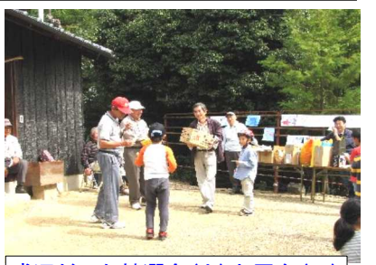
盛況だった抽選会(上)と屋台(下)

子ども相撲には約60人が参加し、力の入った相撲となりました。子ども相撲の対戦は、小学生以下の幼児から始めました。向き合ったまま、泣く子など可愛い対戦に笑いと拍手が起こっていました。対戦が進むにつれ、迫力のある対戦が展開され、大きな声援と拍手が起こっていました。また、境内には、子ども相撲のポスターが張られていました。