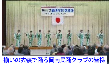
揃いの衣装で踊る岡南民踊クラブの皆様