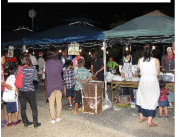
大いに賑わった色々な夜店

この度の秋まつりには、お宮の子ども相撲とだんじり行進の際、多くの方より奉納金を賜り感謝申し上げます。この度の奉納金は延べ125人の方より20万500円を賜りました。この奉納金は子ども相撲の景品やお菓子等に使用させて頂きました。皆様のご協力を感謝し、お礼のご挨拶とさせていただきます。