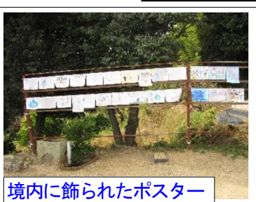
境内に飾られたポスター

子ども相撲には約60人が参加し、力の入った相撲となりました。子ども相撲の対戦は、小学生以下の幼児から始めました。向き合ったまま、泣く子など可愛い対戦に笑いと拍手が起こっていました。対戦が進むにつれ、迫力のある対戦が展開され、大きな声援と拍手が起こっていました。また、境内には、子ども相撲のポスターが張られていました。