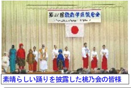
素晴らしい踊りを披露した桃乃会の皆様