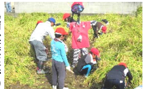
刈った稲はコンバインで脱穀

今年も豊作でした。天候にも左右され病気が害虫にも気がつけなければいけない稲作の苦労の一部分を子どもたちは感じ取ったようです。 農業体験を支えてくださる方々への感謝の気持ちを忘れず、学習のまとめをしていきたいと思っています。 10月の防犯パトロールは18日(土)にききょう公園に運びました。約40分防犯パトロールは終わりました。肌寒い中、参加された皆さんお疲れ様でした。