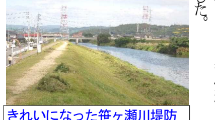
きれいになった笹ヶ瀬川堤防