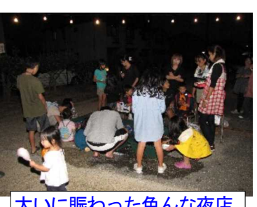
大いに賑わった色々な夜店

5時過ぎから行い、5時半頃には全ての準備が整いました。その頃には夜店も開き、町内や近隣の町内から多くの人が訪れていました。暗くなった午後6時からアニメ映画の上映が始まりました。子ども達はブルーシートに座り、食べながら、飲みながら映画を楽しんでいました。一方、各団体の夜店も大変な繁盛ぶり、長い列ができています。また、お忙しい中、高