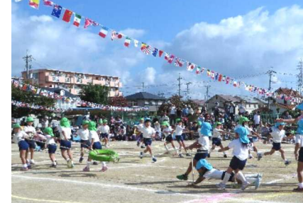
競技 タイヤ引きは迫力満点でした

中でも年長児の「オーエス！ タイヤ引き」の力強さや「祭りだワッショイ」の演技の素晴らしさには会場の皆さんも感心していました。