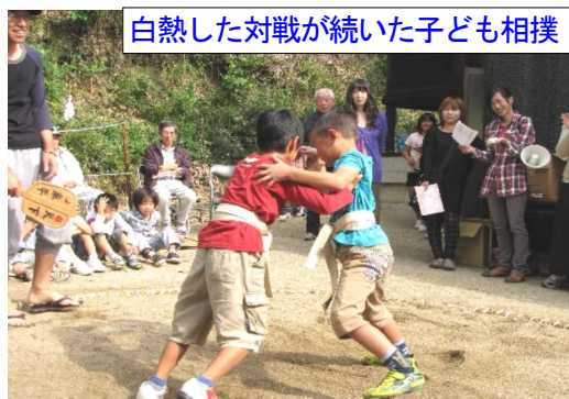
白熱した対戦が続いた子ども相撲

10月4日(土)午後1時より、親和会、宮総代を始め、各団体役員約50人が参加し、お宮周辺の清掃や土俵作り、ポスター掛け等秋まつりの準備を行いました。開始時間の午後1時には作業に取りかかっている方もおられました。作業は境内や道路、側溝の枯れ葉や草を集めてごみ袋に詰め、ポスターを掲げる人、藁で土俵を作る人、拝殿の拭き掃除をする人、樹木の剪定をする人、それぞれが持ち場を分担して作業を行いました。