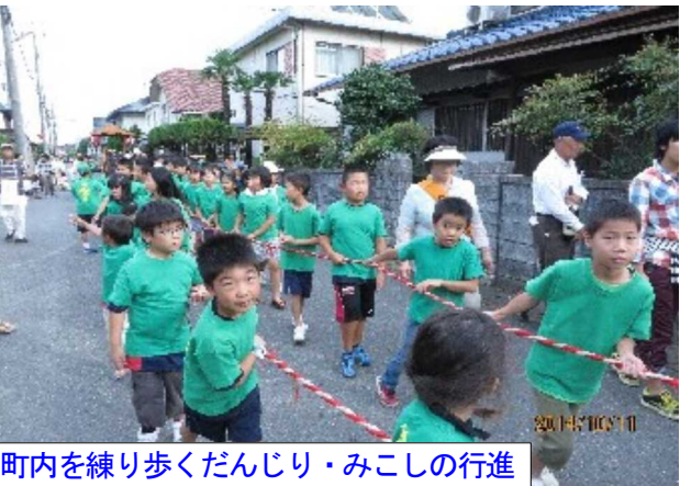
町内を練り歩くだんじり・みこしの行進

祝詞奏上、各団体代表者による玉串奉奠を行いました。子ども達も宮司さんに教えられて行っていました。そして、御輿と土俵、お宮の境内、ご神木、ポスターかけのお祓いをしました。約40分で神事は終わりました。神事にご出席いただいた皆さん、ご苦労様でした。