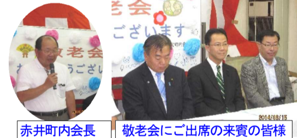
敬老会にご出席の来賓の皆様

9月15日(祝)、午前11時より町内集会所において、町内会主催の敬老会が敬老者42名が参加し盛大に開催されました。