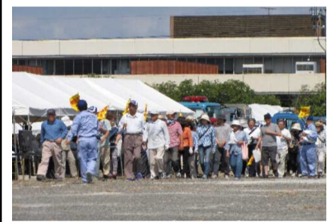
地元住民参加による避難訓練

「被災者救出・応急対応訓練」として、自衛隊や県警によるバイクでの被害状況の調査と防災関係各機関緊急車両による情報収集。被害現地への進出。空路から陸上自衛隊災害派遣要員の被災現地に降下。自衛隊ヘリコプターによる県災害対策本部と連絡員の派遣。緊急災害対策派遣隊による災害対策機械・排水ポンプ、照明車両