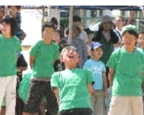
応援合戦 大きな声で!

第34回陵南学区民体育大会は、晴天に恵まれた9月28日(日)、8時45分より陵南小学校にて開催されました。開会式にあたり、早速プログラムに入り、小学生低学年の50m競争、高学年の100m競争、一般男女のパン食い競争、小学生男女の1輪車競争と続きました。得点種目の最初はジャンボ縄跳び、この種目は今まで不得意種目、しかし、この度は練習の成果が表れ、見事1位となりました。