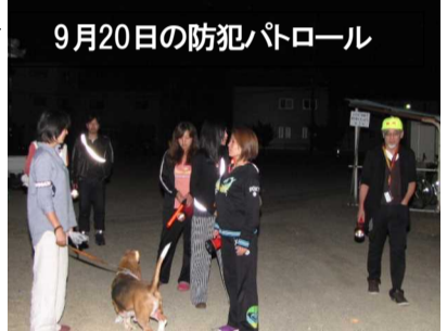
9月20日の防犯パトロール

8月最後の土曜日の30日、本町と育成会11名(子ども4名)で行いました。蒸し暑い日でしたが、全員無事に巡回しました。9月に入り第3土曜日の20日(土)、前回の防犯パトロールとはうって変わって肌寒い日でしたが、あかね町の役員とソフトボール保護者会の皆さん7名と犬1匹で元気