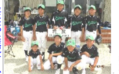
3位になった花尻チーム

好天に恵まれた9月21日(日)、4チームが参加し、陸園小学校に於いて学区親善球技大会が開催されました。花尻チームのメンバーは9名、全員が全力で試合に臨みま