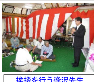
挨拶を行う逢沢先生