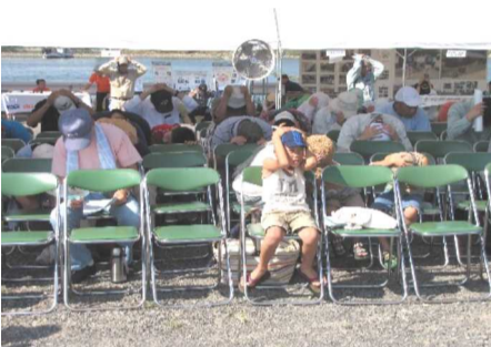
個人の安全確認訓練(頭を抱え身を低くする)