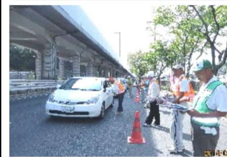
ドライバーに交通安全を呼びかける皆さん