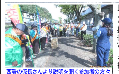
西署の係長さんより説明を聞く参加者の方々

秋の交通安全運動 区交通委員会の方々(9月21日(日)～9月30日(火)の一環として9月29日(月)午後2時より川入地内において、陸園学区交通安全協会が長より挨拶が