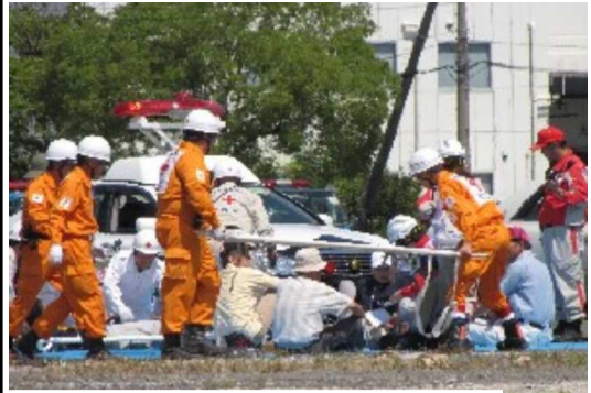
埋没車両からの被災者救出訓練・搬送訓練

道路の交通規制等...の想定で行われました。まず、緊急地震速報が流され、「個人の安全確認訓練」から始められました。次に「避難訓練」、道路パトロールカーや海上から避難の呼びかけに住民の避難訓練が行われました。