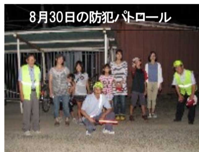
8月30日の防犯パトロール

8月最後の土曜日の30日、本町と育成会11名(子ども4名)で行いました。蒸し暑い日でしたが、全員無事に巡回しました。9月に入り第3土曜日の20日(土)、前回の防犯パトロールとはうって変わって肌寒い日でしたが、あかね町の役員とソフトボール保護者会の皆さん7名と犬1匹で元気