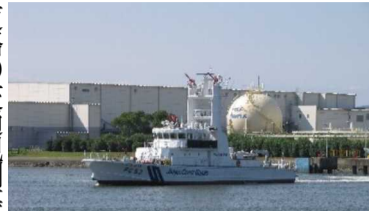
海上保安部巡視艇による救出訓練