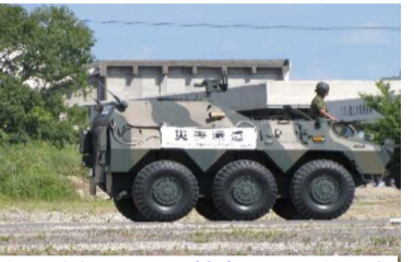
自衛隊車両による被害状況調査訓練

総合防災訓練は、防災週間の始まった8月31日(日)午前9時より岡山市南区岡山港において、警察、消防、自衛隊、地元学区民、医師会、婦人会、福祉団体など95機関、約1950人が訓練に参加して開催されました。