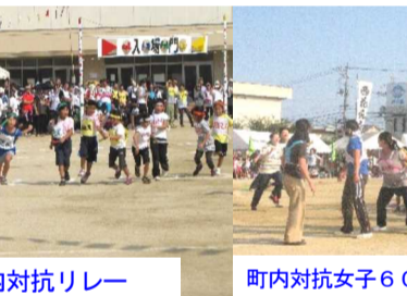
小学生町内対抗リレー