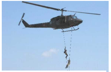
自衛隊ヘリコプターによる救出訓練