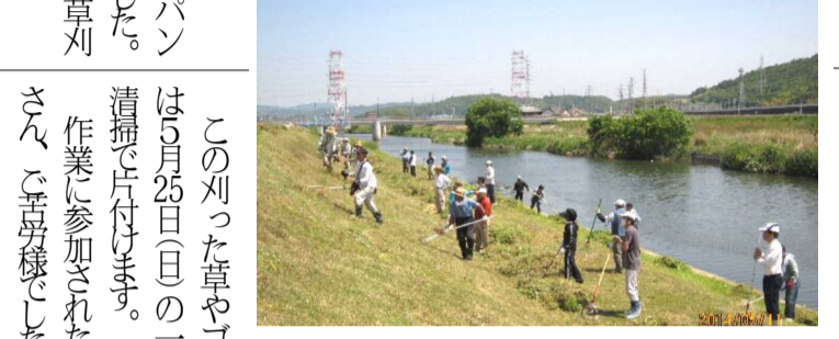
41名が参加して行った笹ヶ瀬川堤防の草刈り

この刈った草やゴミは5月25日（日）の一斉清掃で片付けます。作業に参加された皆さん、ご苦労様でした。