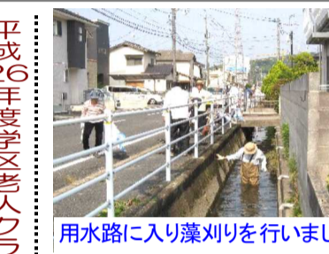
用水路に入り藻刈りを行いました

の剪定作業に取りかかりました。 また、この度も特別班を組み、先日刈った笹ヶ瀬川堤防の草の回収作業を行いました。 笹ヶ瀬川堤防の刈った草は5・6台の軽四トラックで集積場のききょう公園に運びましたが、その量は軽トラ50台分はありました。 また、公園にはその他にも自転車（5台）や川藻、瓦礫等色々なゴミが次々と運び込まれました。 集まったごみは、テキパキと土木委員さんの手で分別がされていました。 清掃作業は約1時間半で終わりました。 一斉清掃に参加された皆さん、準備から片付けまで担っていただいた土木委員の皆さん、お疲れ様でした。