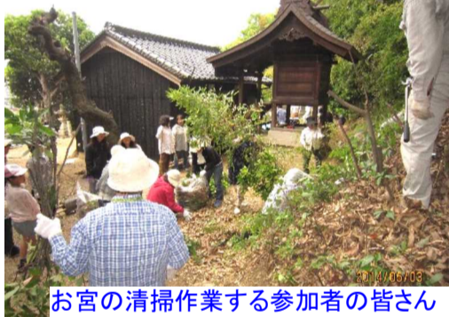
お宮の清掃作業する参加者の皆さん

昨年の10月以来の掃除で、境内や付近の道路、溝には枯れ葉が溜まり、竹や樹木が生い茂っていました。太い樹木や竹はチェーンソーやノコギリで、細いものはカッターや剪定ばさみで伐採しました。また、枯れ葉や小枝、竹の葉などはポランティア袋に詰め、大きなものは竹藪の中に処分しました。また、道路や境内の枯れ落ち葉を溝にたまったゴミなどはポランティア袋に入れ、車に積み込みました。また、本殿・拝殿の掃除も行いました。