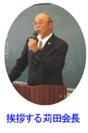
挨拶する町内会長

集まったごみは、テキパキと土木委員さんの手で分別がされていました。 清掃作業は約1時間半で終わりました。 一斉清掃に参加された皆さん、準備から片付けまで担っていただいた土木委員の皆さん、お疲れ様でした。