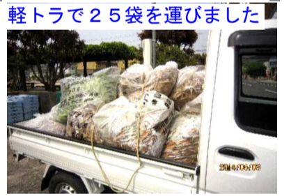
軽トラで25袋を運びました

雨のため延期となっていたお宮の清掃は5月3日(祝)、午前9時より宮総代を始め各団体役員約60名が参加して行いました。