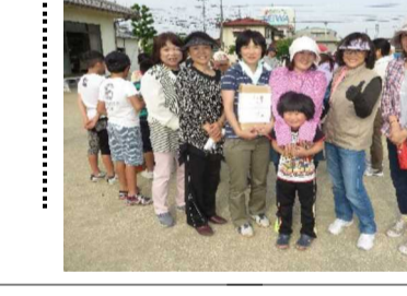
多くの子ども達も参加し、楽しんでプレーしました

また、競技進行や事前のグラウンド整備等準備から後片付けまで尽力くださった親和会の方々、お茶やジュース等お世話下さった婦人部の方々、本場ありがとうございます。