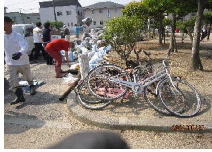
集積場のききょう公園には枯れ草やゴミ、自転車まで運び込まれました

集まったごみは、テキパキと土木委員さんの手で分別がされていました。 清掃作業は約1時間半で終わりました。 一斉清掃に参加された皆さん、準備から片付けまで担っていただいた土木委員の皆さん、お疲れ様でした。