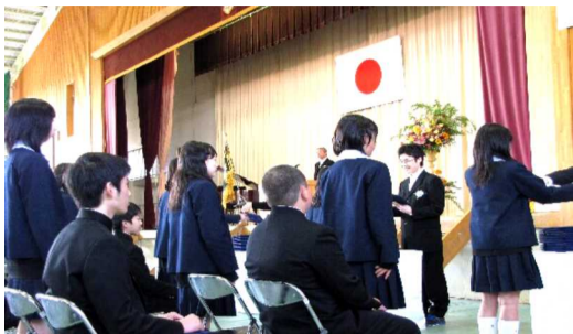
担任の先生から卒業証書を受け取る卒業生

続いて、原康之校長先生より「チャチャチャの法則についてお話しします。チャチャチャとはチェンジ、チャージ、チャレンジのことです。チェンジとは意識を変える。気持ちを変える。視点を変えるなど意識改革からです。次にチャージです。チャージとは何処にでもあると言われている。それを広げるために自ら変わる必要が大切。これを活かすためにチャレンジが必要となります。