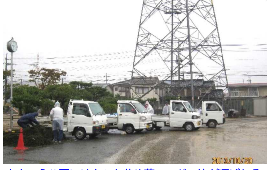
ききょう公園には次々と草や藻、ヘドロ等が運ばれる

10月20日(日)、午前8時より雨の中、秋の「町内一斉清掃」を町民約850人が参加して行いました。 それぞれの集い場所に集合し、参加者の出欠確認や土木委員から清掃についての説明を聞いた後、早速清掃に