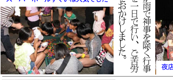
たくさんの子どもたちが集まり賑わう映画会でした

対戦が進むにつれ、迫力も増し「ガンバレ」「押し押し」「○○ちゃん負けな」等々の声援、激励があり、勝負が決まることに大きな歓声と拍手が起っていました。