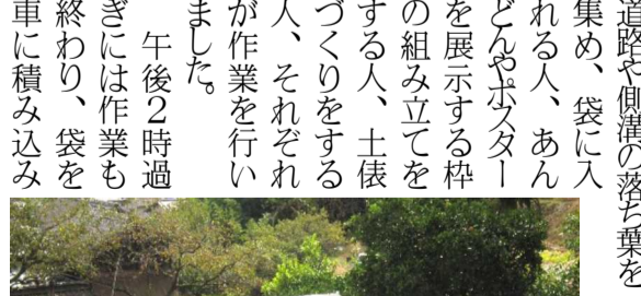
長蛇の列で町内を練り歩くだんじり行進

約1時間子ども相撲は終わりました。また、お宮の境内に設置されたあんどん掛け、ポスターを貼る掲示板には子ども達の作品が飾られました。子ども相撲に参加しあんどん、ポスターを持参してきた子どもには夜店で使える整理券が配られました。