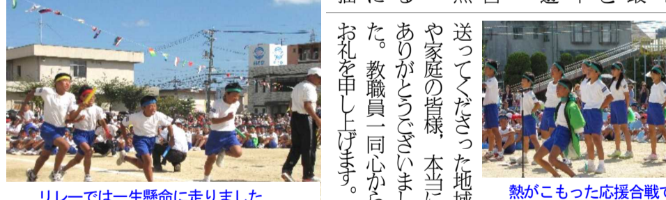
リレーでは一生懸命に走りました

見ている人の心を揺さぶるような笑顔と迫りに満ちた5・6年の組み体操 見ている人の心を揺さぶるような笑顔と迫りに満ちた5・6年の組み体操