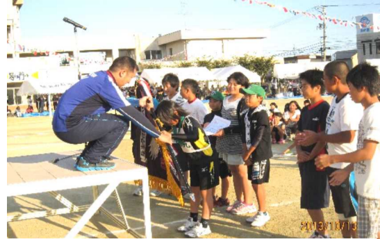
競技の部で優勝した花尻チームに優勝旗が授与

第33回陵南学区民体育大会は、秋晴れの中、10月13日(日)、陵南小学校において開催されました。 開会式の後、早速ラジカセを皮切りにプロクラムに入り、小