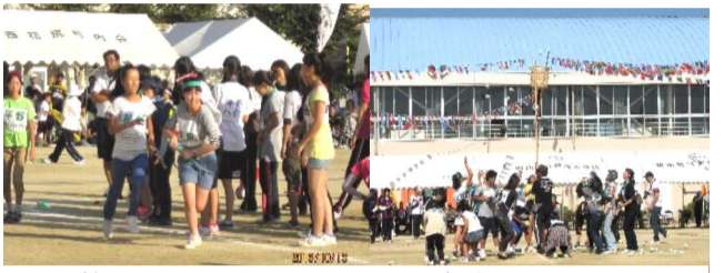
女子対抗600mリレー(左)とみんなの力が発揮された玉入れ(右)

は昨年同様振るいませんでした。次は「応援合戦」でグリーンのTシャツにポンポンを持ち、太鼓を叩き、元気よく「うらじゃ踊り」を披露する予定でしたが、思わぬ