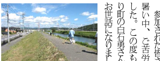
きれいに刈られた笹ヶ瀬川堤防

9月29日(日)朝8時より約30人が参加し、笹ヶ瀬川堤防の草刈りを行いました。 参加者は、野花大橋高架下に集合し、持ち寄った草刈り機で堤防の草刈りに取りかかりました。 草を刈る人、熊手で集める人、それぞれが作業に精を出し、約3時間は、堤防は見違えるようにきれいになりました。刈り取った堤防の草は、