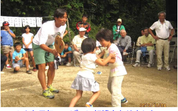
みんな元気いっぱい相撲をとりました

前日は雨で変わって秋晴れとなった10月6日(日)午前9時30分よりお宮で子ども相撲を行いました。