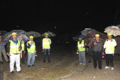
雨の中傘をさしての防犯パトロールでした

10月19日(土)、雨模様でしたが、ききょう町役員、編集委員会のメンバー13名が参加して行いました。 二組に分け、編集委員が本町・あかね方面へ、ききょう町役員がききょう公園・みどり町方面を回りました。 雨も降り肌寒い夜でしたが、元気にマイクで家の戸締まり等を訴えましたが、別に異常はありませんでした。約40分で集会所に到着しました。参加された皆さん雨の中、ご苦労様でした。 今回は、11月16日(土)午後8時から、担当はみどり町、体協、消防です。