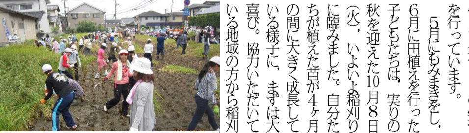
りっぱに育った稲をみんなで刈り取りです

陵南小学校の5年生は、学校の近くに田を借りて米づくりの学習を行っています。 5月にもみきをし、6月に田植えを行った子どもたちは、実りの秋を迎えた10月8日(火)、いよいよ稲刈りに臨みました。 自分が植えた苗が4ヶ月の間大きく成長している様子に、まずは大喜び。協力いただいた地域の皆さんから稲刈り鎌の使い方について教えていただき、子どもたちは順番に黄金色の稲穂の中に歓声を上げながら入っていました。 初めて使う鎌に慣れない手つきの子もたくさん。徐々に慣れ、次々に刈り取っていきます。今年も、例年と比べて少し早作で、その分、時間もかかりました。 米づくりには、多くの世話や手間を掛けなければいけません。その世話の多くは地域の方々や保護者の方々の手によるものです。支えてくださる方々への感謝の気持ちを忘れず、米づくりの学習のまとめをしていきたいと思っています。