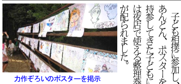
力作ぞろいのポスターを掲示

前日は雨で変わって秋晴れとなった10月6日(日)午前9時30分よりお宮で子ども相撲を行いました。