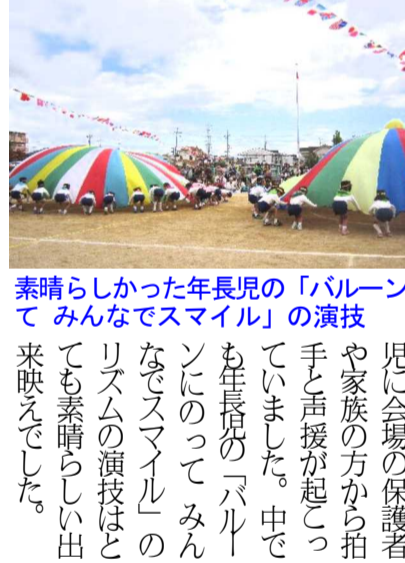
素晴らしい演技の「バルーン」の演技