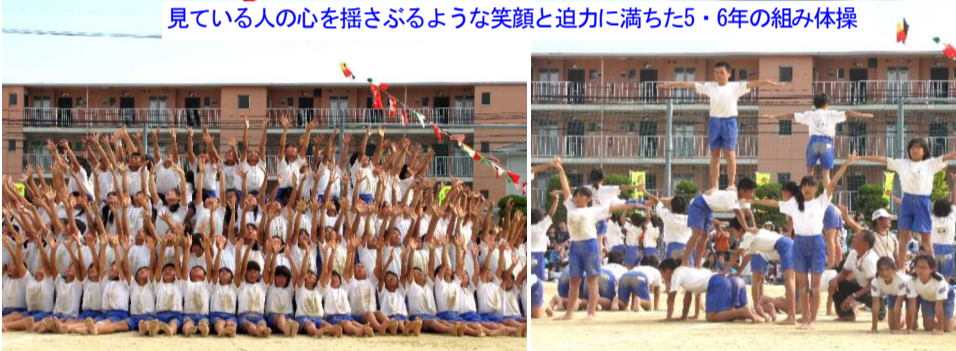
見ている人の心を揺さぶるような笑顔と迫りに満ちた5・6年の組み体操

9月29日(日)、晴れ渡る青空のもと、平成25年度の運動会が開催されました。 今年も、9月になっても気温がなかなか下がらず、大変なコンディションでしたが、直前になってやっと朝夕の涼がやってきました。 運動会が乾燥して砂煙にも苦勞させられましたが、事前の水まきにより何とか対応することができました。 当日は、地域や家庭からたくさんの方にご来校を賜り、子どもたちにも温かい声援を