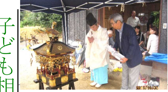
お宮にお参りされた皆さん、雨の中ご苦労様でした。