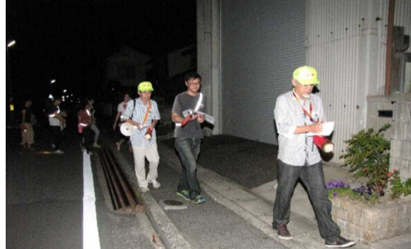
暑い日でしたが、元気に防犯パトロールを行う役員

コースはさきよう町→あかね町→本町→あかね町→さきよう町→みどり町と約1時間周りました。暑い日でしたが、元気に防犯パトロールを行う役員