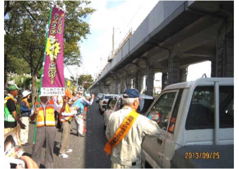
ドライバーに安全運転を訴える参加者