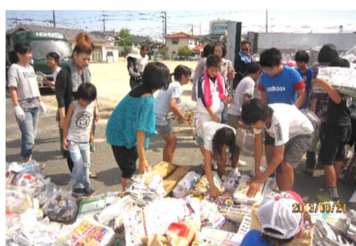
暑い中での積み込み作業を行う子ども達

子ども会 2回目の廃品回収を行う 晴天に恵まれた9月21日(土)、花尻子ども会は今年度2回目の資源回収を行いました。いつものように、午前9時から広報車で町民に協力をお願いして回りました。