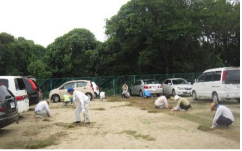
暑い中、吉備荘跡地の草刈りを行う花尻・白石両町内会の役員の皆さん

比較的きれいでしたが、フェンス付近は夏草が生い茂っていました。草刈り機で刈る人、鎌や鎌で草を刈る人、そして、集める人それぞれが仕事を分担しながら作業を進めました。