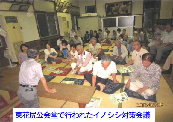
東花尻公会堂で行われたイノシシ対策会議