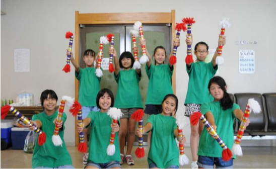
立派な演技を見せた花尻子ども会の銭太鼓チーム

銭太鼓の音が綺麗に響き、子ども達も上手に演奏できた為、会場の皆さんから大きな拍手を頂きました。続いて中学生の吹奏楽部によるユーフォニウム、サクソフ、クラリネットの演奏があり、PTAのダンス、吉備中教員バンドの演奏で大いに盛り上がりました。