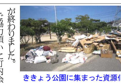
ききょう公園に集まった資源化物品

子ども会 2回目の廃品回収を行う 晴天に恵まれた9月21日(土)、花尻子ども会は今年度2回目の資源回収を行いました。いつものように、午前9時から広報車で町民に協力をお願いして回りました。