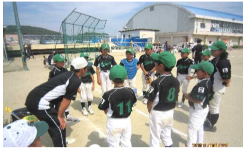
試合前、監督のアドバイスを聞く子ども達