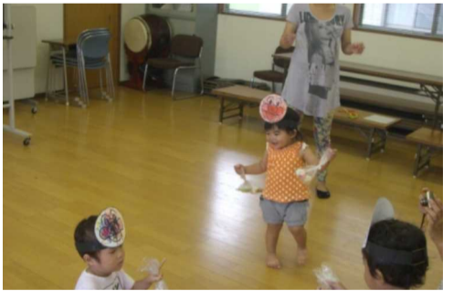
パンダのお面でさんさん体操をする幼児達

9月3日（火）に活動を行いました。アンパンマンのお面と敬老会にお渡しするメダル作りをしました。子ども達は大好きなアンパンマンのお絵かきをこぎげんで楽しんだり、メダル作りは母親が折り紙で折った物に子ども達の色をぬったりしました。その後作ったお面を着けてアンパンマンの「サンサンたいそう」を踊って身体を動かしました。10月は、イオンモール倉敷のマリオさんによる出張コンサートを楽しむ予定です。