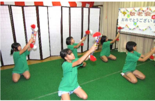
銭太鼓を披露する子ども会6年生の5人(上)揃いのTシャツ姿で「青い山脈」を歌う婦人部・愛育委員会役員の皆様(写真下)